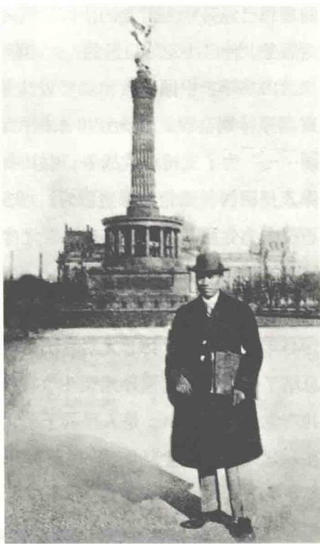
在德国柏林的朱德

展社会主义劳动竞赛中表现出来的蓬勃精神感到无比兴奋。在莫斯科郊外的秘密军事训练班，朱德任队长，在苏联教官讲课时，他负责军事教程解释等工作，还经常给中国学员讲解如何利用地形地物，如何使用机关枪、迫击炮、手榴弹，如何保存自己消灭敌人，如何侦察，如何袭击，等等。同时，他注意研究苏联内战时期的游击战术。教官曾在课堂上问他回国以后怎样打仗，朱德回答“部队大有大的打法，小有小的打法”“打得赢就打，打不赢就走”“必要时拖队伍上山”。