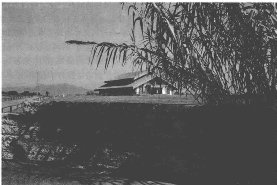
图2 上山文化遗址公园