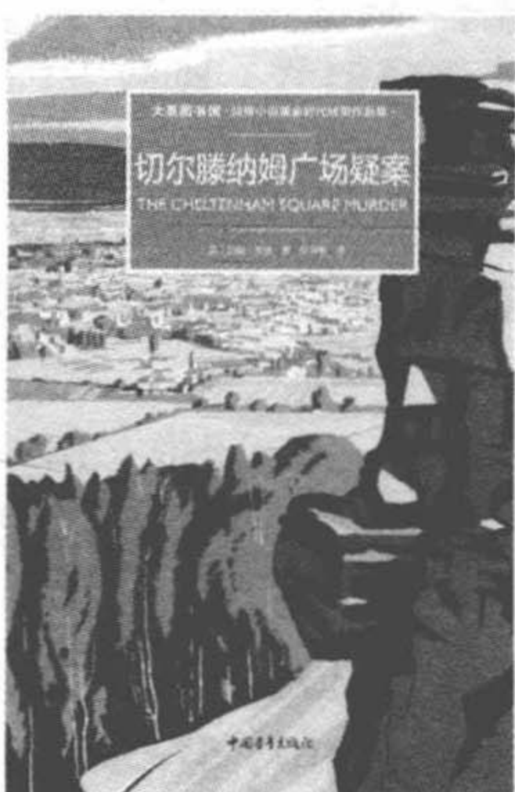
《切尔滕纳姆广场疑案》