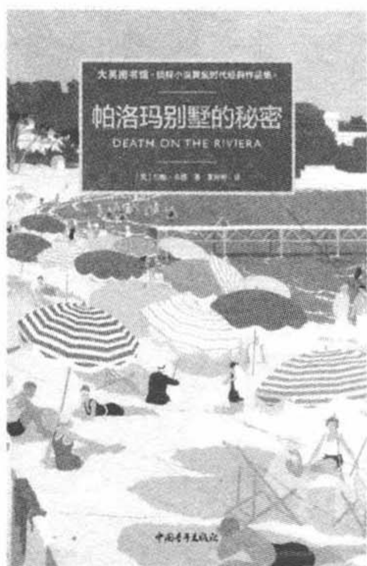
《帕洛玛别墅的秘密》