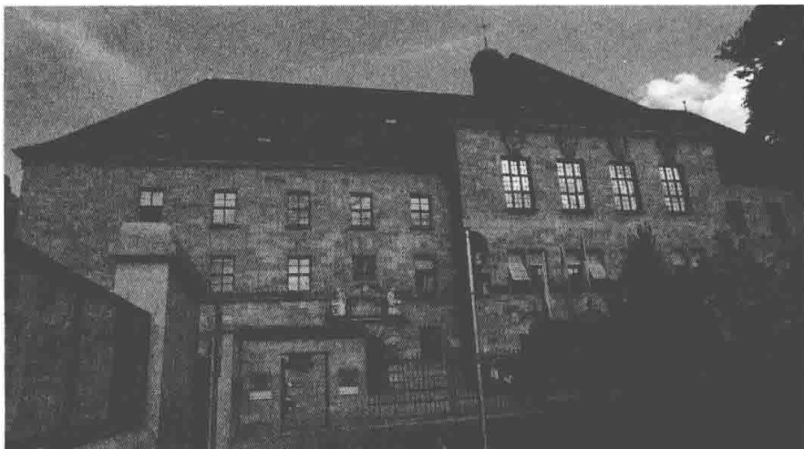
图1 德国纽伦堡审判旧址

节寰袁公墓志铭》这样记载：“迨秋奴复至，南卫收获，大肆侵略。公（袁可立）命将设伏，乘风纵火刍茭，糗粮尽归一炬。”现实中，武力侵略的目的往往涉及领土、经济和文化，这就需要对“侵略”做狭义和广义的理解。