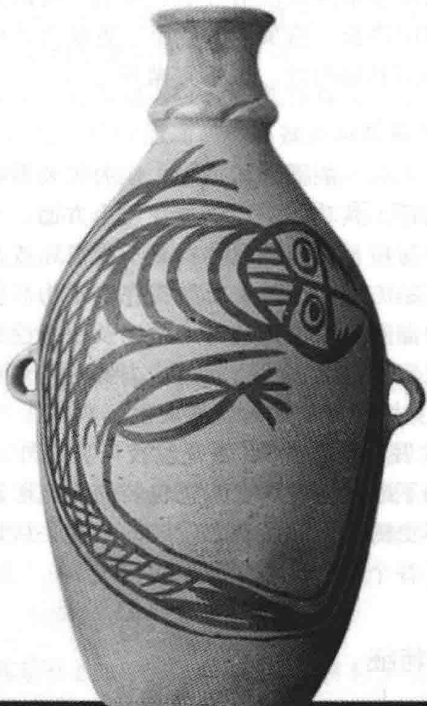
图 1-1 人面鲵鱼纹瓶 仰韶文化 甘肃博物馆藏

古代陶瓷包装虽然不是特别追求造型的独特性和装饰的繁复性，但无论是造型还是装饰，均深深地根植于中国传统文化之中。从现存实物来看，我国新石器时代的陶瓷包装就体现了吉祥文化思想的物化特征。如西安半坡及临潼姜寨出土的新石器时代彩陶纹样中的鱼纹，就有双鱼联体、三鱼联体、一体二头、鱼腹中藏人、鱼鸟相连等多种形式，还有人首鱼身的“人面鱼纹”。这类鱼纹被大量运用到作为包装容器的器物上，实质上都是原始先民用以寄托氏族子孙繁衍昌盛和赖以生活的物质资料年年有余的吉祥纹样（如图 1-1 所示）。