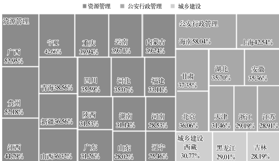
图 1-2-1 各省级行政区行政诉讼最高发的行政管理领域分布

注：图中百分比为各省级行政区最高发的行政管理领域占本地案件比(%)，即每个省级行政区各类行政管理领域中，排名首位的管理领域案件数占本地全部案件数的比例。