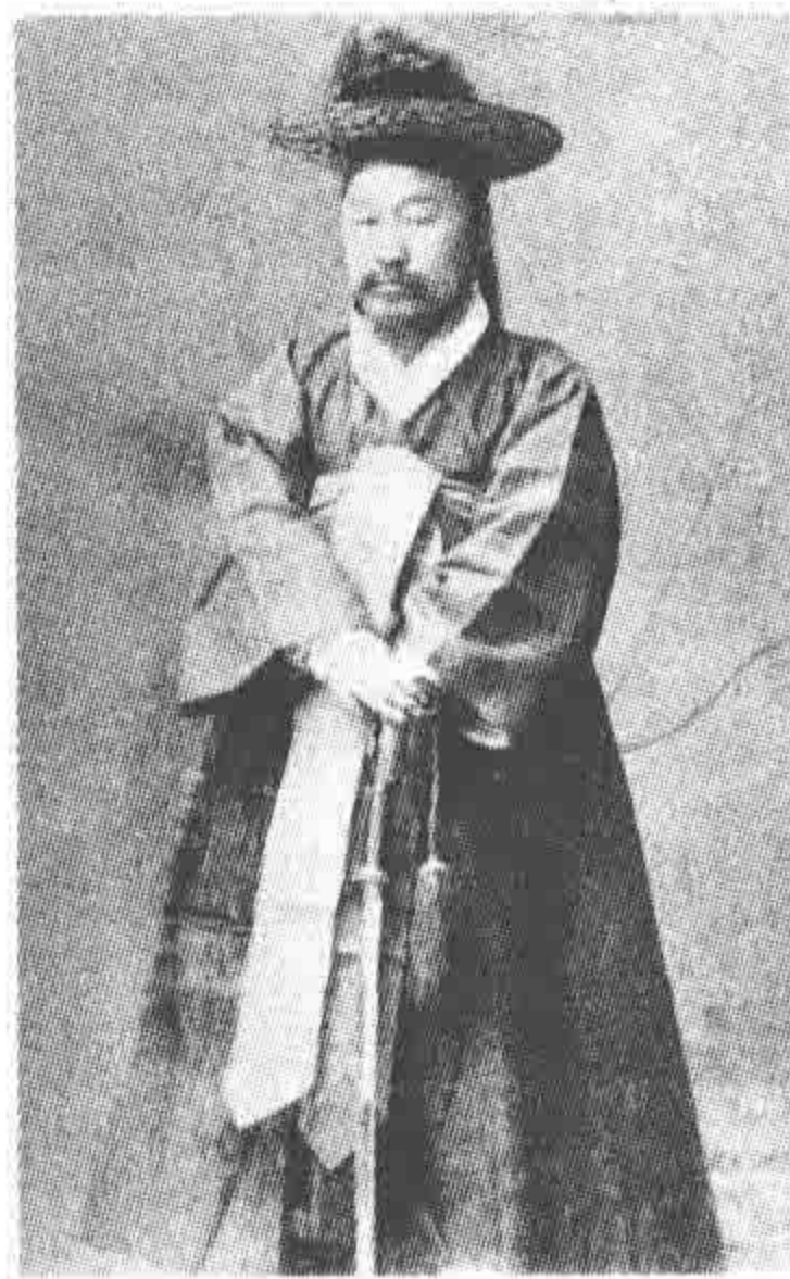
两班 穿官服的文官（左）和穿军装的武官（右）