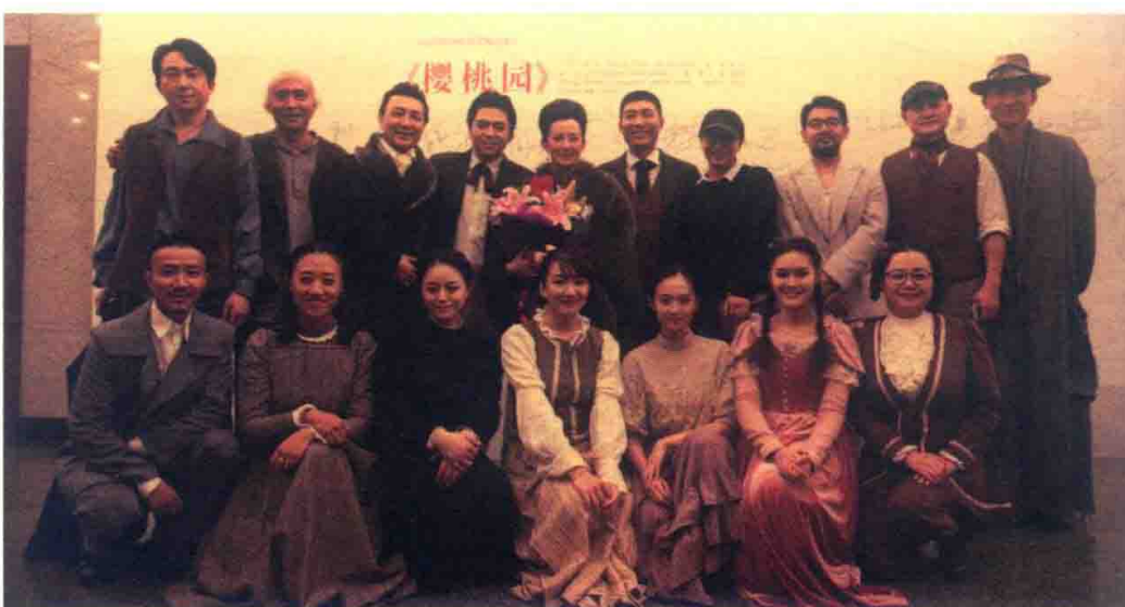
中央戏剧学院实验剧场 2014 年演员合影