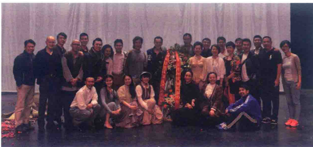
中央戏剧学院实验剧场 2014 年演出合影