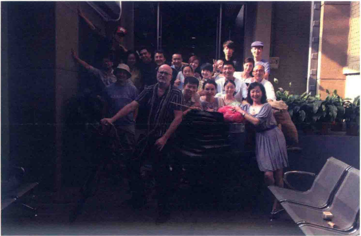
中央戏剧学院北剧场 2014 年合影