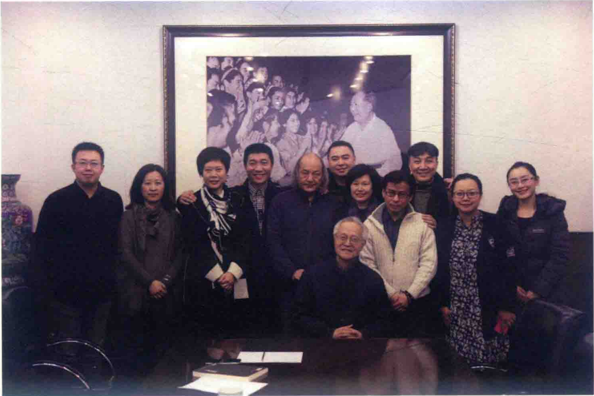
《樱桃园》主创团队 2016 年研讨会合影