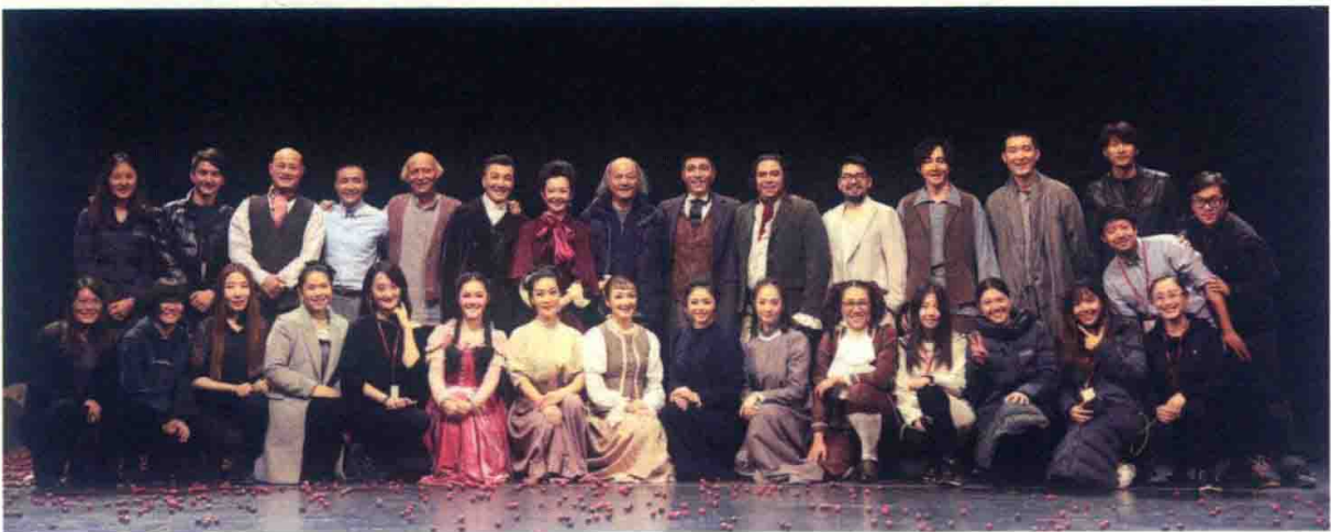
首都剧场 2016 年演出合影