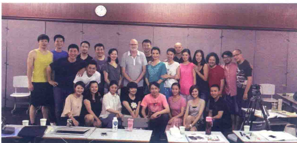
中央戏剧学院东城校区舞蹈教室 2014 年合影