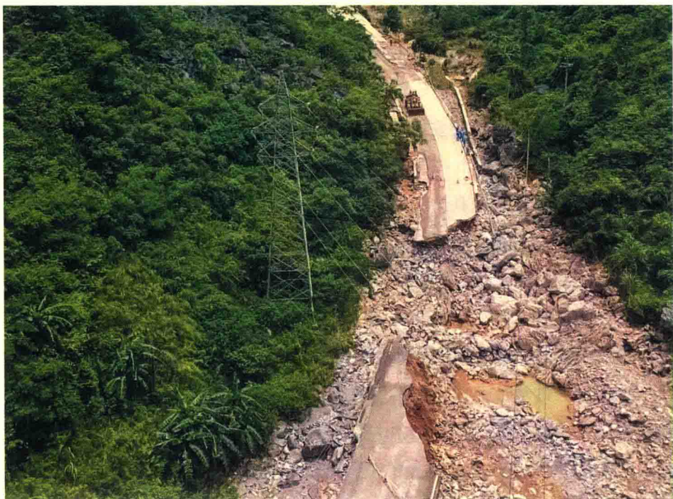
被暴雨山洪冲毁的公路