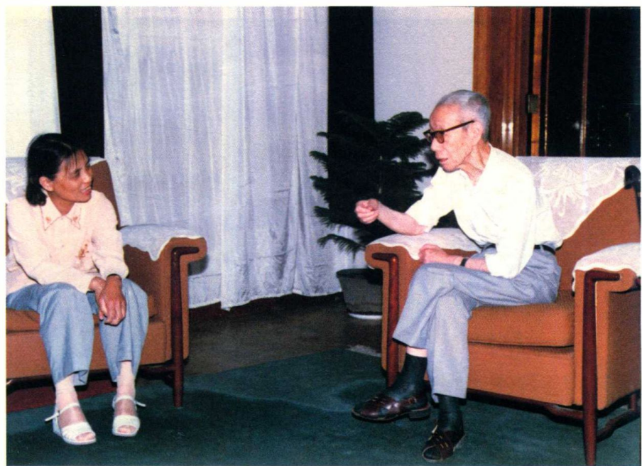
1990年，冯蕙（左）向著名语言学家吕叔湘先生（右）请教