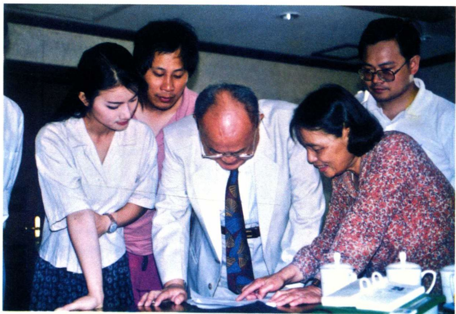
1996年6月24日，冯蕙等就毛泽东读苏联《政治经济学教科书》（社会主义部分）的情况，采访胡绳同志。前排中为胡绳，右一为冯蕙；后排右一为曹志为