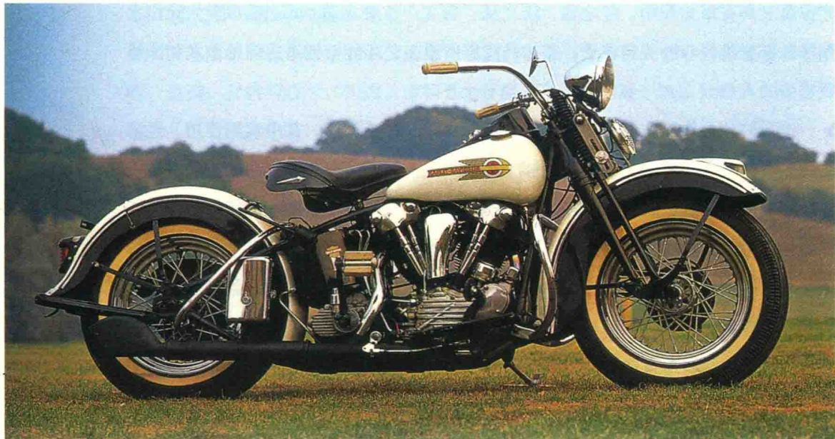
图 0-3 “哈雷·戴维森”摩托车

还要考虑一些艺术之外的因素，如市场因素、使用者因素和使用环境因素等。设计是一种综合的设计，包括造型设计、色彩设计、纹饰与肌理设计、技术设计、人机因素等等。