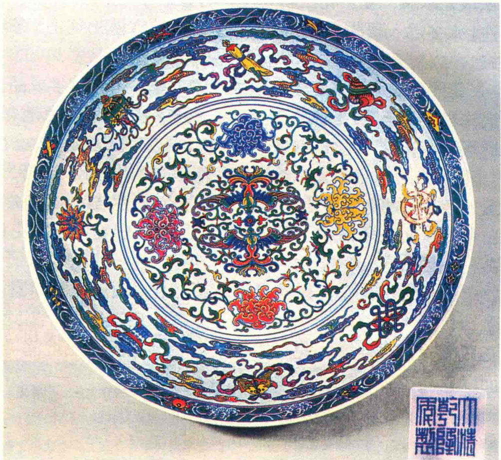
图 0-2 斗彩八吉祥纹大盘,清乾隆

最初‘图案’一词就包括了平面图形和立体形态的设计，与 design 是一致的，后来的工艺美术指的是与日常生活相关的各类物品的设计，在本质上与 design 也是相同的，现在我们用艺术设计（design）一词，表面看是一个新词，实际上与前两者在内容上完全相同。三个词的演变，意味着认识角度的转换，而基本内涵也没有根本性的差别。但认识角度的转换也是研究重点的转移，从造物过程看，无论是手工业、机器生产还是现代高新技术，总有一个创意的前阶段，再有一个制作的阶段，这是一个完整的过程。” 8 （图 0-2）