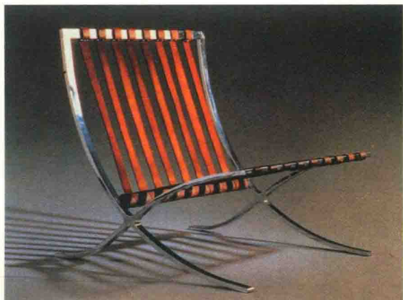
图0-5 巴塞罗那椅，密斯·凡·德罗

再说鱼纹。鱼纹在中国出现较早且存在时间最长，它从新石器时代半坡彩陶的鱼纹盆一直延续到晚清民国的鱼纹盘，直到今天，鱼纹还是瓷器上常见的装饰纹样。彩陶装饰