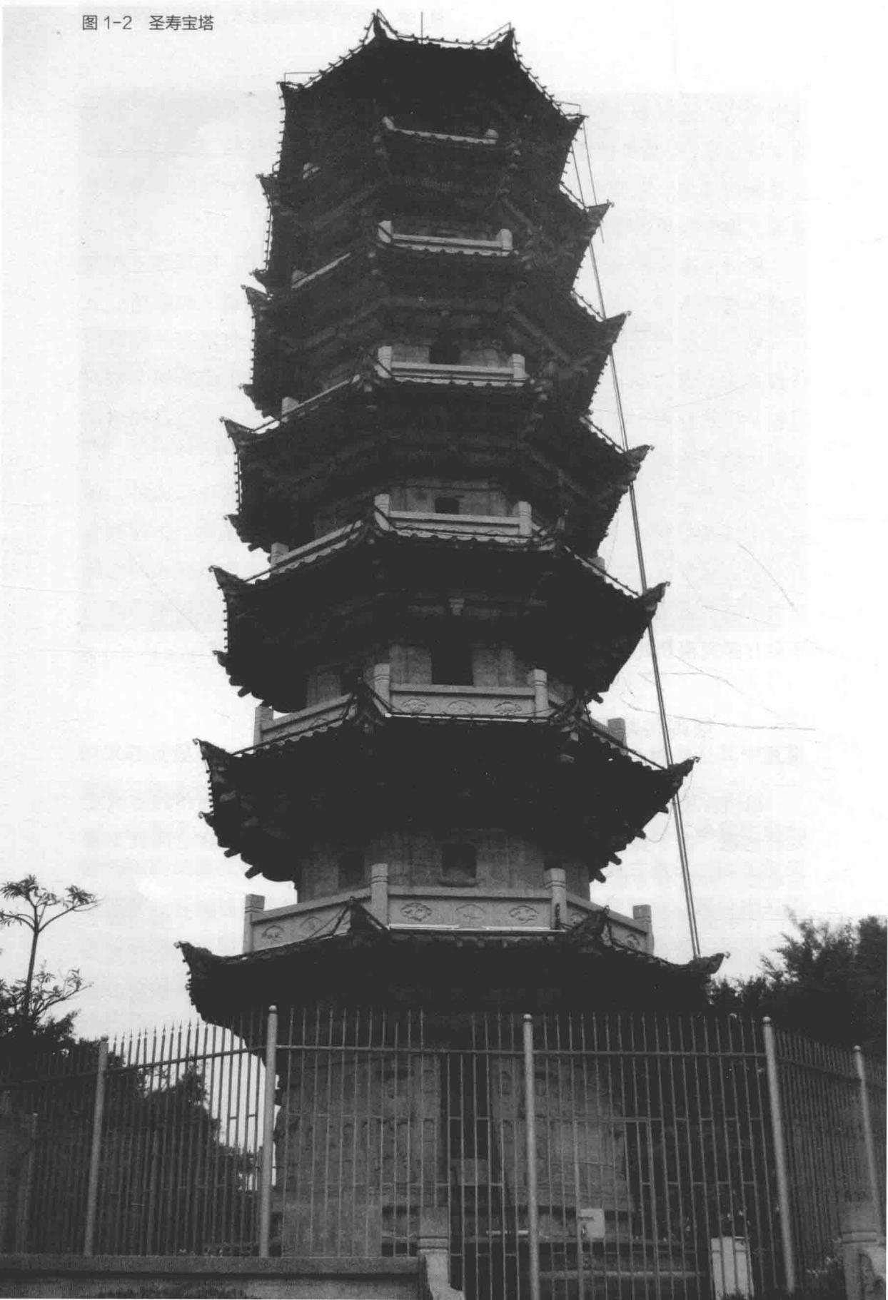
图 1-2 圣寿宝塔