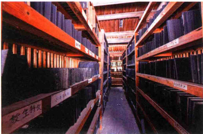
鼓山印经在明清时期达到鼎盛，被誉为“中国的第一法窟”

唐建中四年（783年），僧灵峤入山诛茆为台，诵《华严经》以驱毒龙，因号华严台，亦以名其寺。五代梁开平二年（908年），闽王王审知命神晏居焉，号国师馆，“徒千百，倾国货给之”，乾化五年（915年）改为鼓山白云峰涌泉院。宋宣和（1119—