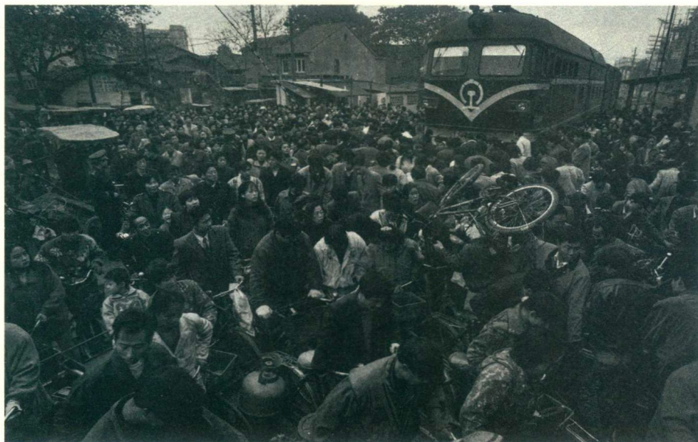
《30年道口，30年中国铁路的变迁》之一 1996年的杭州，拥堵严重时，列车停下来让行人。