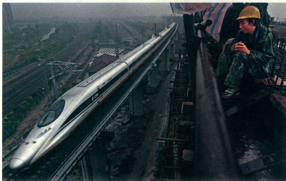
《高铁基石》之一