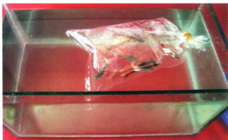
若袋、缸温差大且袋温高，可让袋漂浮半小时后解袋放鱼