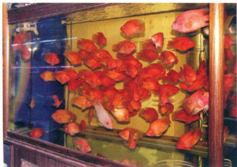
1厘米厚玻璃拼成的超高大型玻璃缸

特点 老式玻璃缸还有一个突出的优点, 即观赏效果真实, 鱼体不会变形, 所以深受欢迎。老式玻璃缸规格应有尽有。此外, 老式玻璃缸比较轻便, 搬运与换位都比较容易, 如规格为120厘米×50厘米×60厘米的缸可被两个人抬起。但是, 老式玻璃缸受撞击或当底座不够水平时也容易破裂损坏。