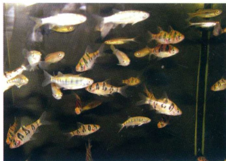
颜色鲜艳、索饵积极、活泼敏捷、鳞片闪光的鱼可购

健壮 脊背相对宽厚的鱼可购，脊背如刀左右摇晃的鱼不可购；索饵凶且诸鳍有力的鱼可购，吞吞吐吐而有气无力的鱼不可购；合群相挤、随众游动的鱼可购，离群独游、尾随众后的鱼不可购。