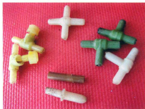
用于气泵导管分流的二通、三通、四通和截气流的节气阀

功用 一种高效单纯用于增氧的电器，如果出气足够大，可以使缸中养鱼的数量增加 10 倍以上。