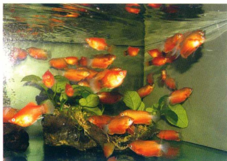
所谓血丽丽鱼即为饰色厚唇丽丽鱼，色艳可人

色艳 同胎鱼体色相对鲜艳，鳞片闪光者可购，体色暗淡，鳞片松落、充血者不可购；同胎鱼中体色相对鲜丽者可购，体色相对平淡者不可购。但中规格以上的鱼除红肚凤凰鱼、红调七彩神仙鱼等极少数种外，雌鱼一般不