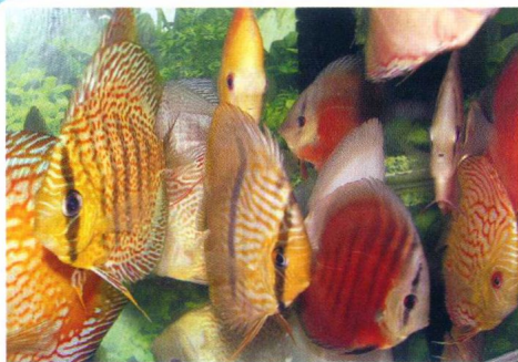
七彩神仙鱼色彩华丽