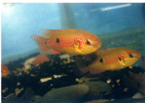
几乎所有丽鱼都具攻击性，以雌雄 1 对或 8 尾以上共缸为好

(5) 具攻击性与霸道的鱼最好另缸或独养。缸小则同种或同规格鱼只能养 1 尾，稚鱼期一般可相安无事（从仔鱼养到成鱼的斗鱼，在同缸中争斗并不激烈，但与非同缸养大的斗鱼却斗得你死我活）。丽鱼科幼鱼（包括 3~4 厘米长的七彩神仙鱼稚鱼）往往会独霸饵料，不让他鱼接近，使他鱼挨饿等，应充分注意，防止造成事故等。