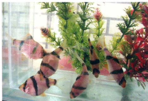
虎皮鱼绝对是闹鱼，胆敢将多种长须鱼之须

动静 有的鱼喜静，如神仙鱼、泰国斗鱼等；有的鱼喜动，如斑马鱼、虎皮鱼；有的鱼文静不“闹”，有的鱼却常惹事生非、攻击他鱼。每个人对鱼的动静都有喜欢的倾向，喜欢安静的鱼，可选神仙鱼、泰国斗鱼、美鲈鱼等；喜欢好动的鱼，可选斑马鱼类、鲃鱼类、孔雀鱼类。亲自观察后下手挑选，组缸后还可调整。