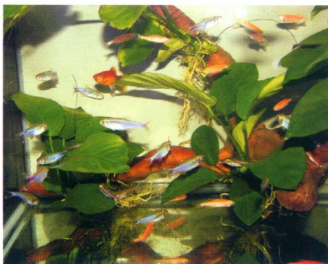
斑马马鱼、月光鱼、红灯管鱼等均较好养