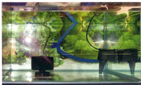
鱼缸中注水八成满，配齐充气、过滤等设备，即可试运行

注意 在养鱼容器里，一般都只注入70%~80%容积的水，有时还要罩上网等。热带鱼多为“跳高健将”，水太满时，鱼有可能跃出缸外而死去。此外，水太满也不利于防范天敌袭击。