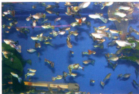
普通孔雀鱼既漂亮又耐粗放，可试养

标准 耐粗放的热带鱼一般生命力都极强。那么，什么样的热带鱼是耐粗放的鱼？在新水中、给氧充分、饵料足而精、防鱼病感染细致入微的环境中长大的鱼均属娇养鱼，而在陈水（极少对水）或老水中、供氧较差、饵料不足而较粗、防鱼病感染不周到的环境中长大的鱼均属耐粗放鱼。有的品种鱼较耐粗放。