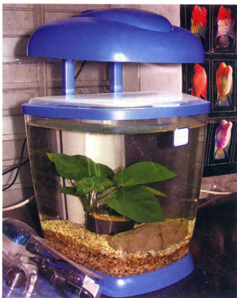
四棱台式艺术鱼缸

装饰 微型工艺造型缸是一类浇铸而成的较小鱼缸，虽只适合于养小型与小规格鱼，但外观漂亮、玲珑多姿。其中大多都配有底座或底架，颜色鲜艳，造型独特。