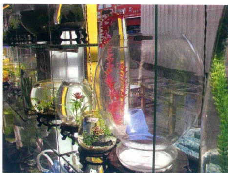
配置底座的多种艺术缸