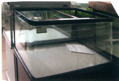
中型方形三拼(前、左、右面合一, 后面, 底面)玻璃缸

美观 所谓三拼玻璃缸, 即由三块玻璃黏结成的缸, 前面和左右侧面固定在一起成一弯面, 另有后面和底面两个面。由于前侧两个棱无黏结缝, 因而显得很美观。有一类三拼玻璃缸的前面为弧面, 更为别致, 称弧面玻璃缸。一般商品三拼玻璃缸多配有柜式底座等, 很适合置于室内。