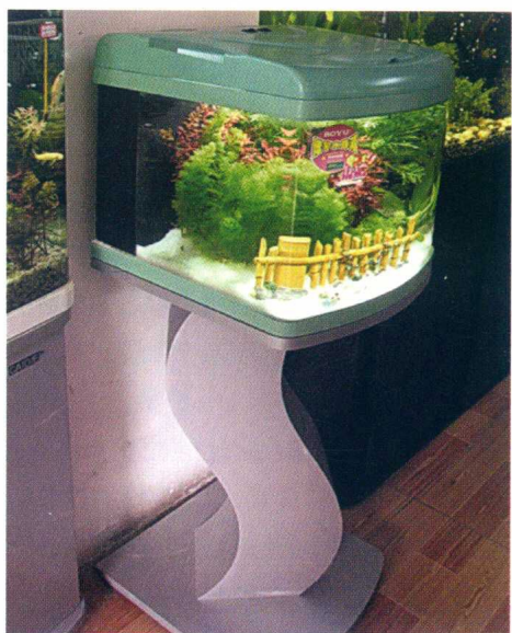
高架微型艺术玻璃缸

特点 因是浇铸整体成型的，故是无接缝玻璃缸，本身观赏价值就高，与其说适合于养鱼，不如说更像室内摆设物。鱼缸较小，可养小鱼且不能养太多，小些的不能超过20尾。其修饰效果不亚于工艺品。