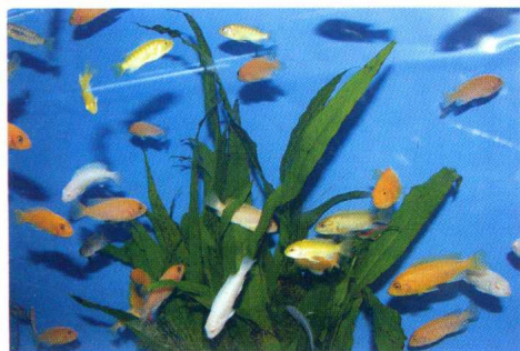
非洲大湖鱼耐粗放，但要用偏碱性硬水

挑选 当然，我们很难知道商家卖的鱼是娇养鱼还是耐粗放鱼。不过我们还是可以根据一些迹象进行粗略判断：同规格的鱼鳍略长者耐粗放，同日龄的鱼个头小者耐粗放，同一种鱼同等条件下更能接受素饵者耐粗放，一批鱼从不见死鱼的有可能耐粗放，很粗很差的饵料都能吃的鱼极有可能耐粗放，颜色相对深者耐粗放，对植物饵料很感兴趣者耐粗放。