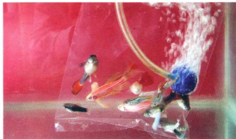
若袋、缸温差大且袋温低，可解袋充气半小时后放鱼