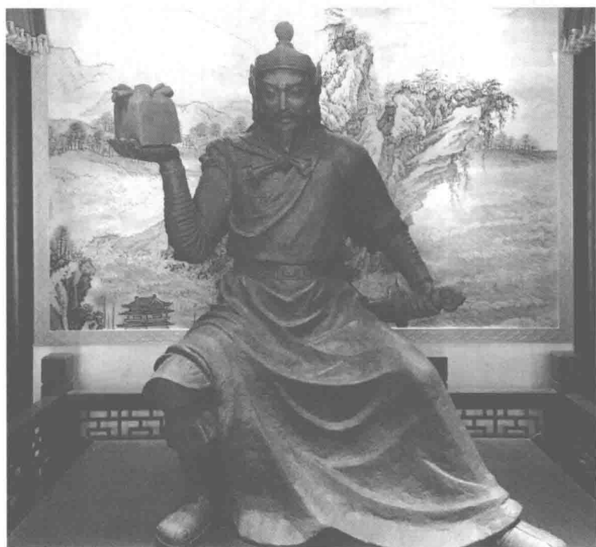
卢忠肃公祠内卢象昇塑像