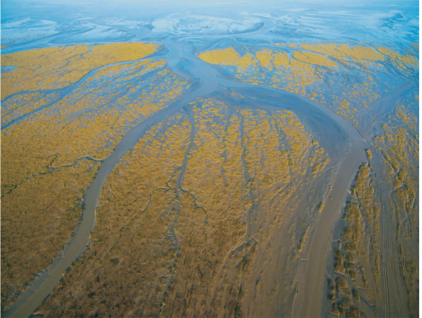
地球之肾