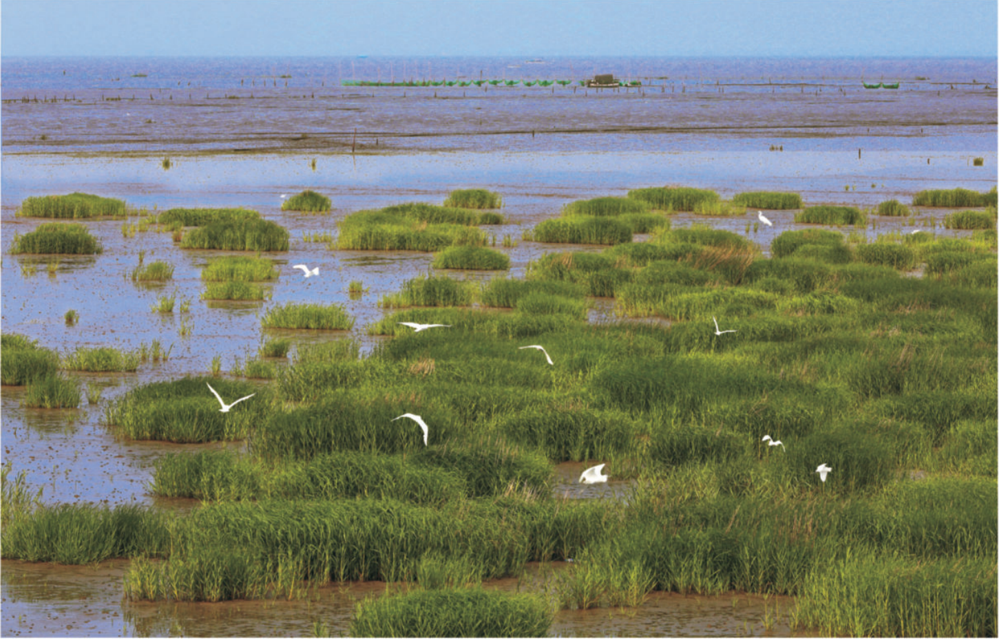
生态美景