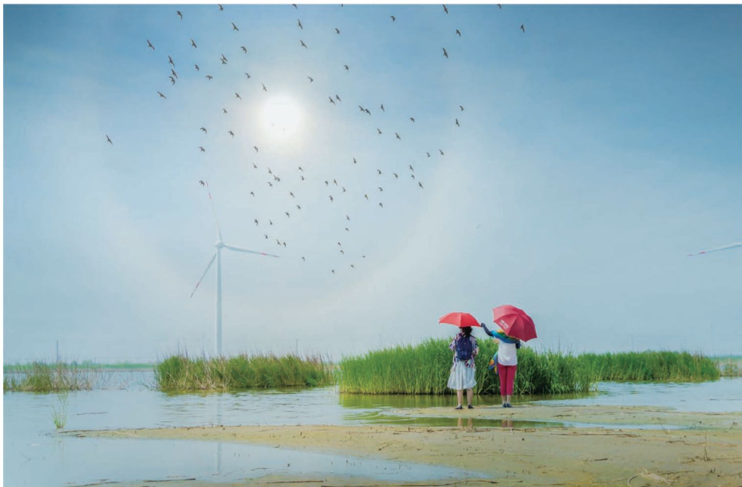
迷人的东凌湿地