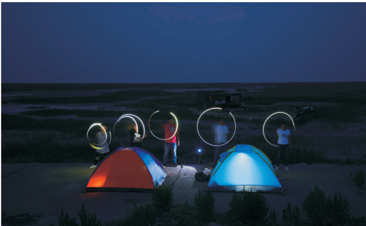
圆梦东湖外滩