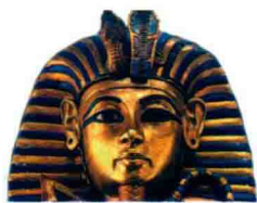
图坦卡蒙的黄金面具

卡特在1922年发现的图坦卡蒙墓及其出土文物,对欧洲装饰艺术领域产生了重要影响,欧洲的装饰艺术运动时代的家具就受