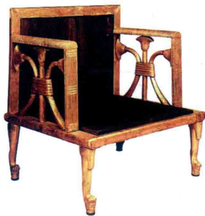
古埃及折叠凳和踏台

出土于古王国第四王朝法老妻子赫特菲尔斯陵墓,为现存最早的椅子。木质部分贴有金箔,体现出王室风范。椅子座面很矮且很宽,腿脚端为兽足。在两旁的高扶手上,雕刻着三根自成一束的纸莎草,此为下埃及一带的象征性图案。