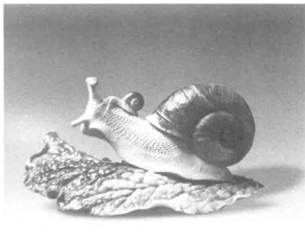
图4 秋之韵 25cm×20cm×23cm 叶品勇

的作者长期在社会历史条件下形成的生命态度、宗教信仰、价值观、生活愿景及生活情趣，是青田石雕的创作内容与审美观的直接体现，并与中国传统文化传统与精神追求紧密相依。传统的青田石雕作为通俗文化的形象载体，既有信仰、人生态度，又有平素生活的审美情趣等平凡易见的内容，如作品有《山海经》故事、有儒道释的人物、有立意幽远的万壑千岩，还有日常生活所见的高粱、玉米、谷子、辣椒、南瓜、竹笋、白菜、丝瓜、葡萄等谷物、果蔬为创作母题。所以，青田石雕不仅承载着中国传统美学思想和宇宙观念，还充分地体现了通俗文化的思维模式和人生境界。