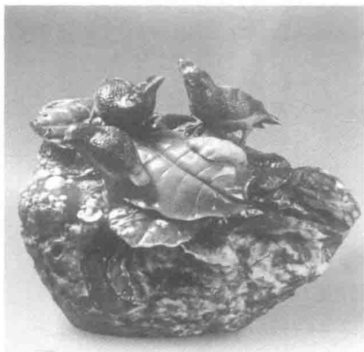
图3 雨后 30cm×20cm×15cm 叶品勇