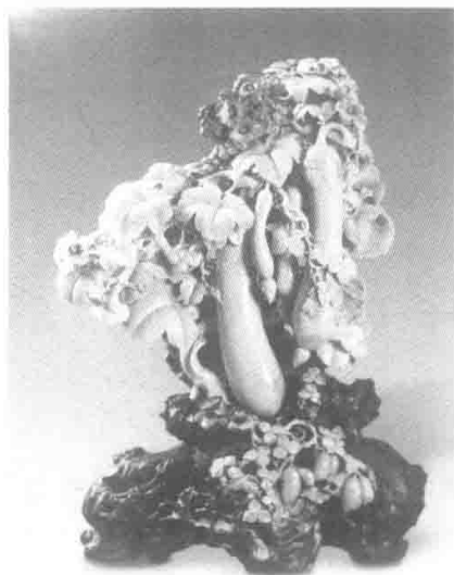
图2 丝瓜 35cm×30cm×70cm 留大伟

向精细丰富的雕刻风格与审美趣味推进。从简约粗犷到细腻精巧，固然有不同时期美学趣味的转换使然，同时我们还应当注意到一个更为重要的因素，即青田石雕的石材质地细腻柔软，易于雕刻细节，使青田民间石雕艺人能够不断地认识和掌握石材性能——“因材石性”“依色取巧”，这是其形制风格走向精巧细腻的重要原因之一。从龙泉双塔内发现的五代吴越国时期的青田石雕佛像造型形制来观察，青田石雕技艺日趋完善，造型的线条亦体现唐绘风格。至宋代，青田石雕吸收了“巧玉石”的制作工艺，石雕艺人已经善于运用“因势造型”“依色取巧”的制作理念和技巧，开始充分发挥“石色”“石质”“石性”的青田石料的独特优势，借助青田石质柔软温润的独特石性，创立多层次镂雕，即表层、中层、里层雕刻这样一种融合技艺，雕工极为精细，使得精致入微的刻画和复杂的造型处理得以实现，这几乎是任何其他玉石雕刻都难以做到的。石料雕刻优势也是影响青田石雕风格趋向逼真模仿造物对象的重要成因。