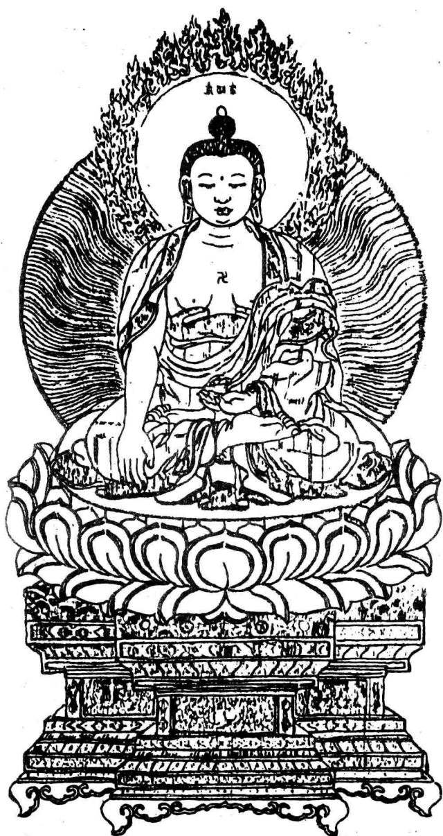
如 来 佛