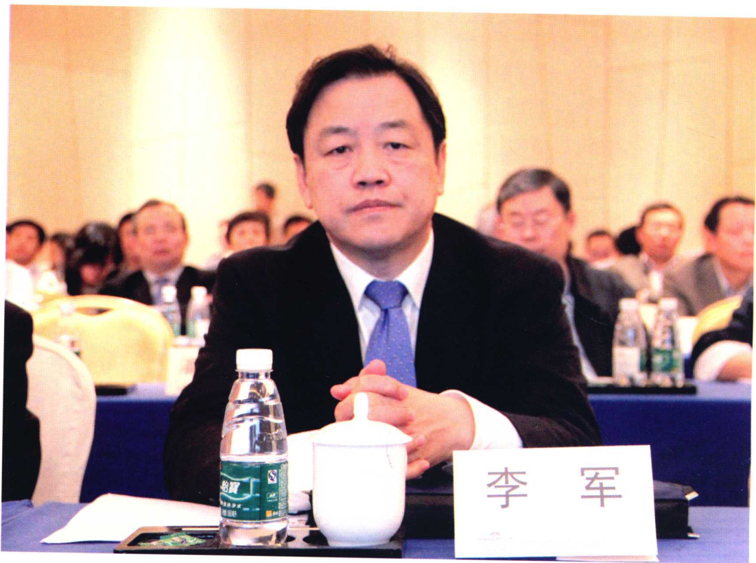
民航局李军副局长