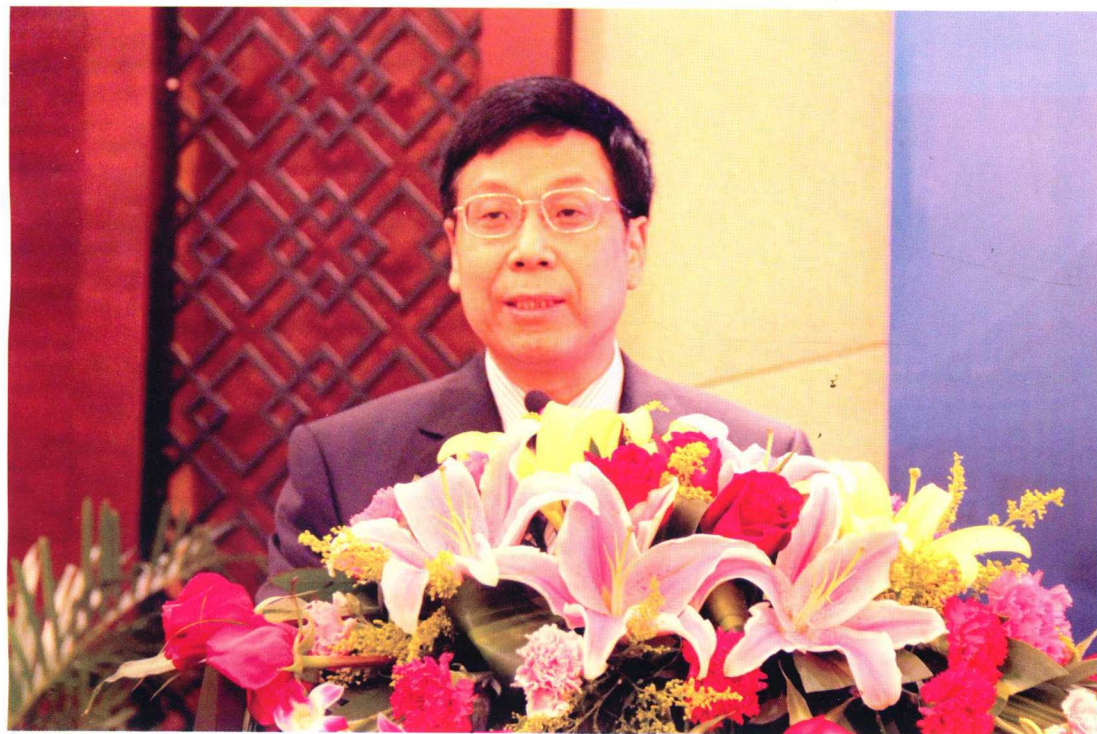
交通运输部财务司任永民副司长做工作报告