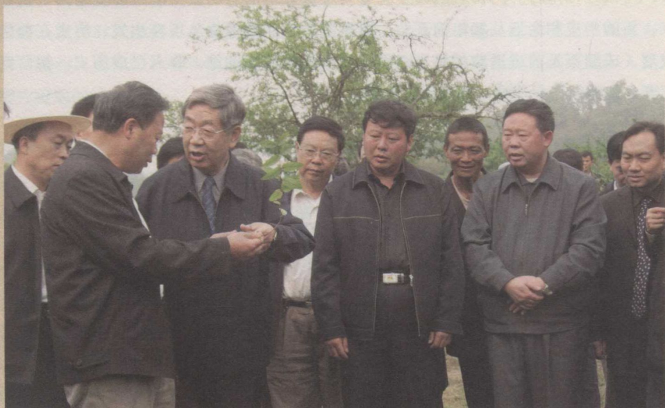
全国人大常委会原副委员长许嘉璐（左三）在贵州省人大常委会副主任许正维（左二，时任黔西南州委书记）、州政协主席张定书（左一）、州委原副书记田忠明（左四）、州政协副主席黄建勇（右一）、第九届县委书记王立辉（右二）陪同下视察我县