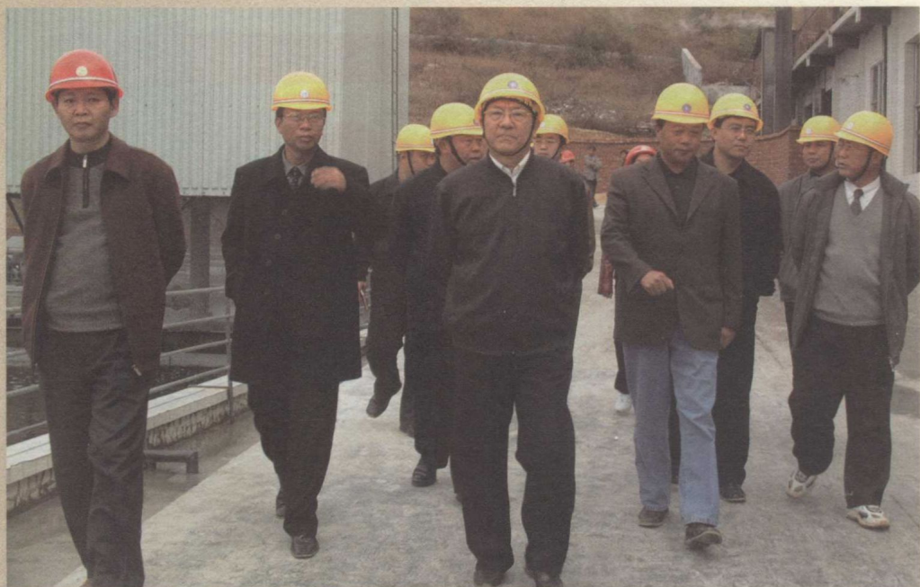
贵州省委原副书记曹洪兴（中）在省人大常委会副主任许正维（右四，时任黔西南州委书记）、第十四届县政府县长周玉仁（左二）陪同下在我县调研