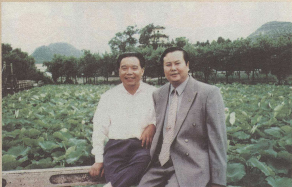
贵州省政协主席黄瑶（左，时任黔西南州委书记）在原州委常委、第八届县委书记殷晓敏陪同下调研安龙旅游业