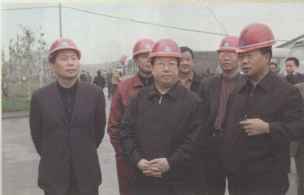
贵州省委常委、常务副省长王晓东（前排中）在省人大常委会副主任许正维（右一，时任黔西南州委书记）、第十届县委书记周玉仁（右二）陪同下考察安龙重化工基地