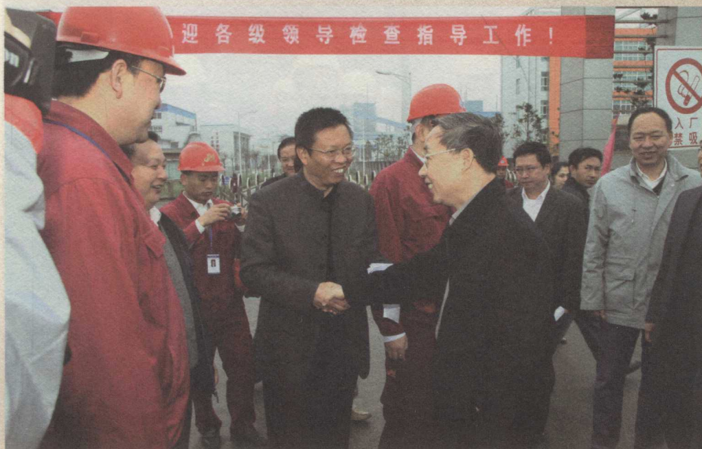
贵州省省长林树森（右握手者）在重化工基地亲切接见第十届县委书记周玉仁