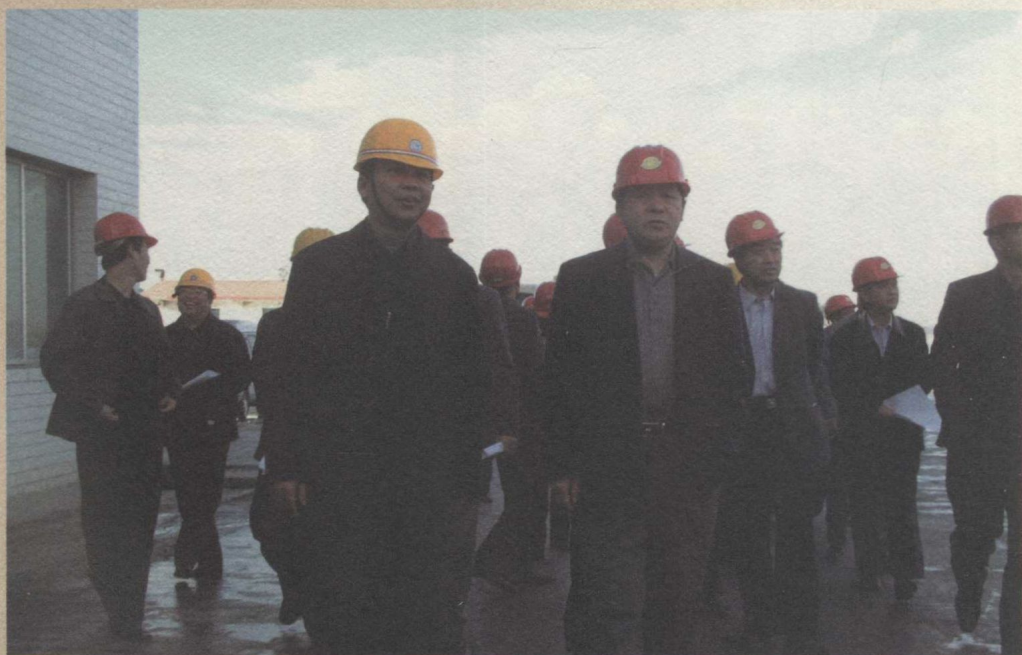
贵州省委常委、副省长黄康生（前排右）在我县考察