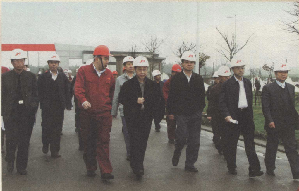
贵州省省长林树森（前排左三）在黔西南州委书记陈敏（前排右三）、州长陈鸣明（前排右二）、第十届县委书记周玉仁（前排左一）、第十五届县政府县长邓修宇（前排右一）陪同下到我县调研