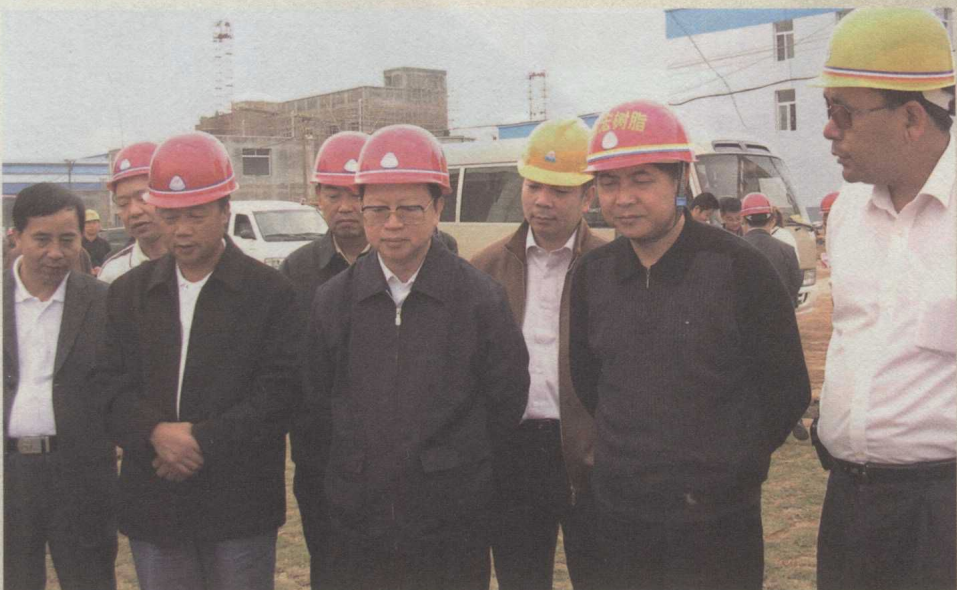
全国政协副主席钱运录（前排左三，时任贵州省委书记）在省人大常委会副主任许正维（前排左二，时任黔西南州委书记）、原州长班程农（前排右二）、副州长陈文发（前排左一）陪同下到我县非公有制企业调研