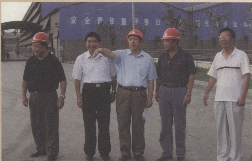
贵州省委常委、省委秘书长张群山（中，时任副省长）在省人大常委会副主任许正维（右二，时任黔西南州委书记）、原州长班程农（左二）、第九届县委书记王立辉（左一）、第十四届县政府县长周玉仁（右一）陪同下考察安龙重化工