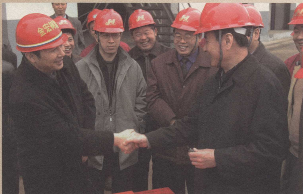
贵州省委书记石宗源（右一）视察安龙重化工基地