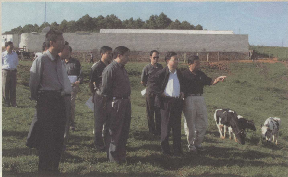
全国政协副主席钱运录（前排右二，时任贵州省委书记）在省委常委、副省长黄康生（前排左二，时任黔西南州州长）、省人大常委会副主任许正维（前排右一，时任黔西南州委书记）、第十四届县政府县长周玉仁（前排左一）陪同下在我县调研