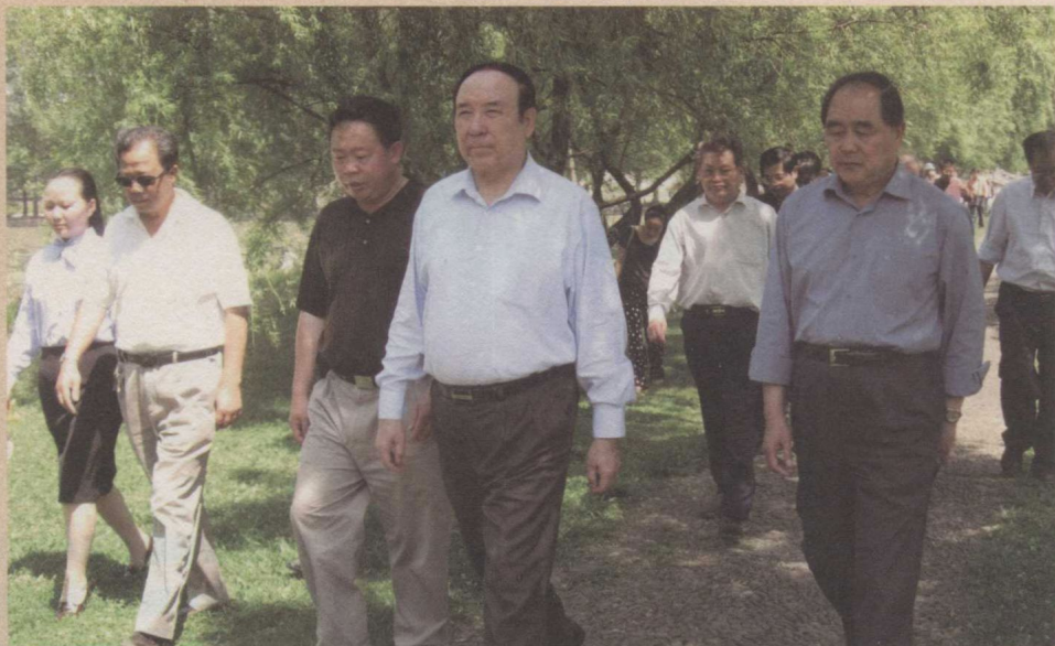
全国人大常委会原副委员长司马义·艾买提（前排右二）在贵州省原省长石秀诗（前排右一）、省人大常委会副主任许正维（前排左二，时任黔西南州委书记）、第九届县委书记王立辉（前排右三）陪同下视察我县