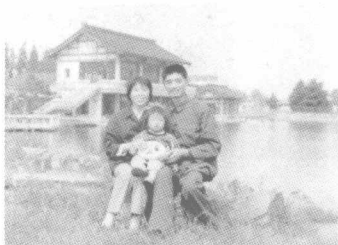
作者来苏州探亲时带女儿到苏州东园游览