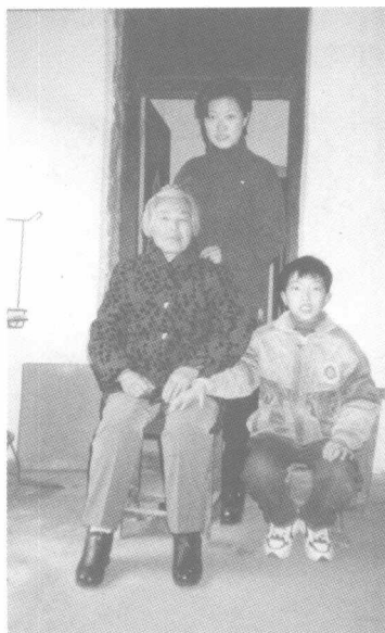
作者的母亲和孙子、孙女在一起