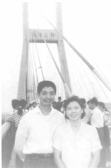
作者夫妇在南浦大桥上