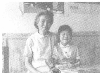
作者的女儿和奶奶在一起