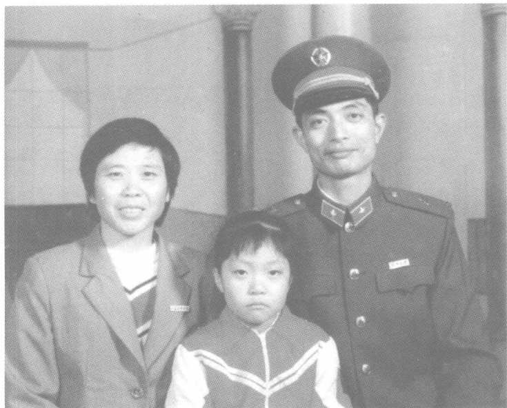
作者上苏州大学夜大时家人合影