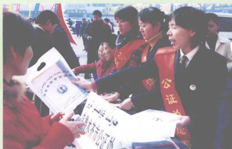
公证人员向群众宣传公证知识