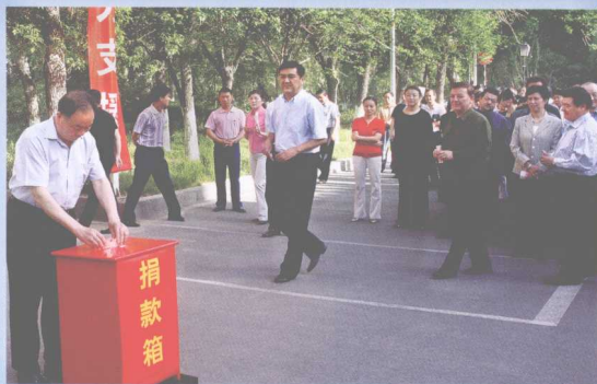
中共中央政治局委员、自治区党委书记王乐泉、自治区党委副书记、自治区主席努尔·白克力等自治区领导带头为汶川地震灾民捐款。