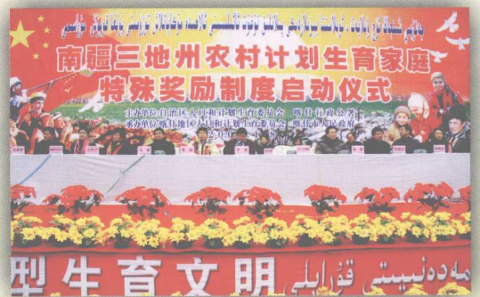
2008年国家在南疆三地州实行计生特殊奖励政策，图为在喀什市召开的特殊奖励政策启动仪式。