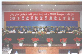
2009年民政系统党风廉政工作会议。