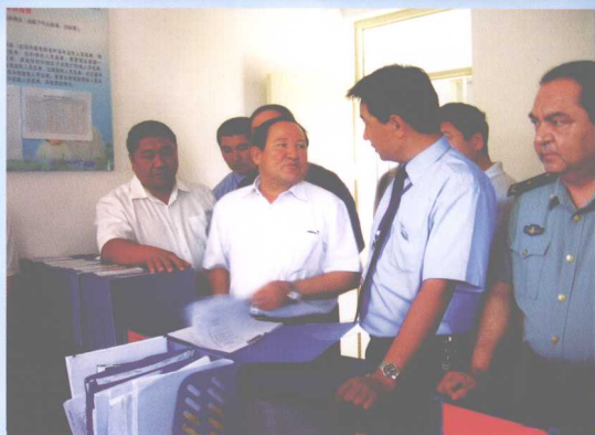
自治区副主席贾帕尔·阿比布拉等领导检查基层民政工作。