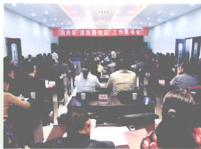
司法厅积极推进“法治六进”工作