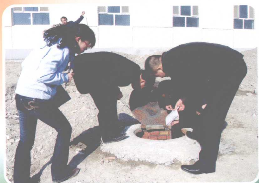
审计人员在对现场进行测量