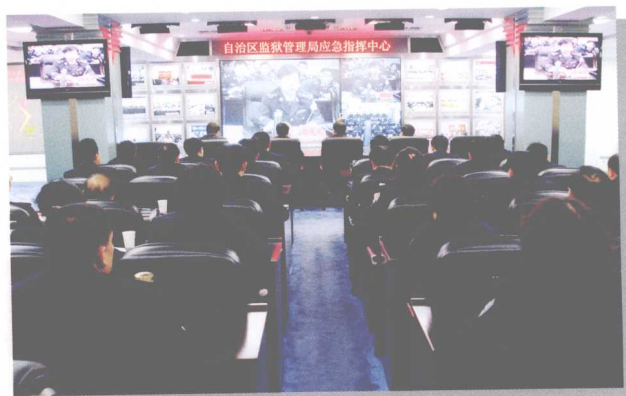
监狱局利用网络视频进行学习交流