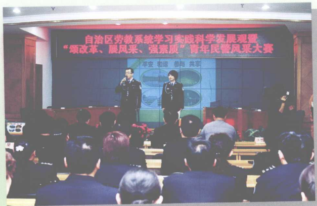
劳教局隆重举行劳教系统学习实践科学发展观暨“颂改革、展风采、强素质”青年民警风采大赛