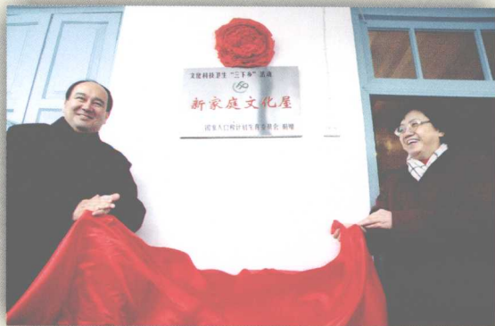
国家人口计生委在我区实施文化屋项目，2008年1月，国家人口计生委李斌主任与努尔兰·阿不都满金常委为克州阿图什市上阿图什乡新家庭文化屋揭牌。

2008年，全面启动标准化、规范化服务站建设试点工作。本着区、地、县三级联动、试点先行的原则，自治区投入340万元，支持试点县(市)改善服务条件，规范管理模式，提高管理服务能力。9月中旬，分别在伊宁县、奇台县召开现场会，总结推广先进经验。各地迅速行动，加快建设步伐，取得了良好的效果。目前，全区基本技术服务项目免费服务率达90%以上，落实长效节育措施231.4万例。通过考核验收，新增3个国家级、12个自治区级“优质服务先进单位”。