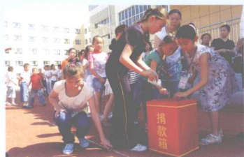
克拉玛依市二小学生为灾区捐出零用钱