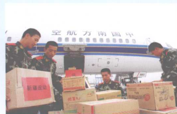
自治区加班加点为汶川地震灾区紧急运送救援物资。