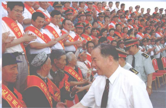
中共中央政治局委员、自治区党委书记王乐泉会见双拥模范单位和模范个人代表，并与代表们合影留念。