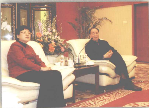
2008年1月，中共中央政治局委员、自治区党委书记王乐泉会见国家计生委李斌主任。

8月，自治区党委、人民政府召开了南疆三地州人口和计划生育工作座谈会，各地党政强化措施，加大宣传教育，农牧民家庭领证积极性空前高涨。2008年，全区新增奖励扶助对象9010人、累计达53408人；“少生快富”工程项目户12022户、累计达98948户；纳入南疆三地州特殊奖励对象9012户、累计达35165户；有740人纳入计生家庭特别扶助对象、累计达3206人；有6757名农村领证家庭子女享受升学加分政策。截止2008年底，全区领取《计划生育父母光荣证》和《独生子女父母光荣证》家庭累计达124.75万户，当年领证达15.8万户，其中农牧民领取“两证”家庭达到11.7万户。