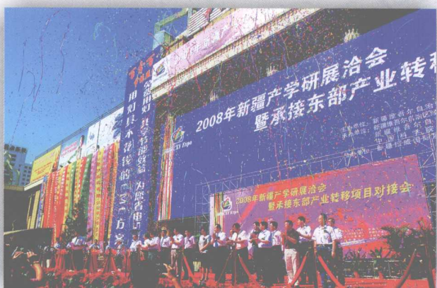
承办2008年新疆产学研展洽会暨承接东部产业转移项目对接会