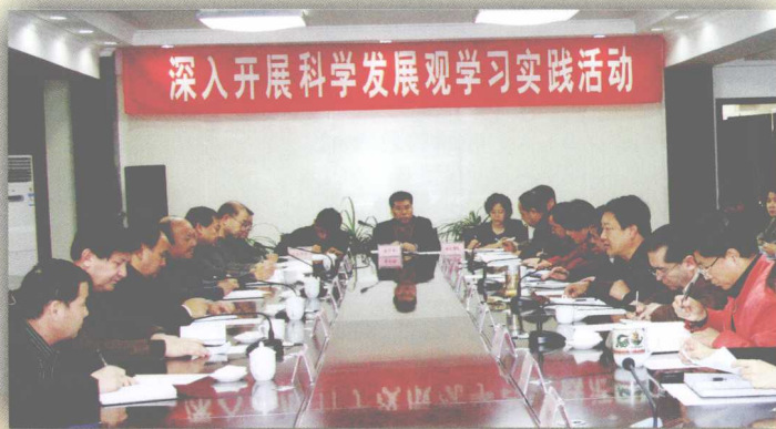
2008年3月，自治区党委、人大、政协领导到自治区人口计生委检查开展科学发展观学习实践活动情况。