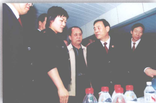
自治区检察院杨肇季书记带领检察干警到自治区大型企业调研为经济建设服务的情况

自治区人民检察院，在自治区党委和最高人民检察院的坚强领导下，在各级人大的监督和各级人民政府的支持下，全区检察机关始终坚持“立检为公，执政为民”的宗旨，紧紧围绕“强化法律监督，维护公平正义”的工作主题，按照“加大工作力度，提高执法水平和办案质量”的总体要求，切实履行宪法和法律赋予的监督职能，检察工作不断取得新的成绩，为自治区的改革、发展、稳定、构建和谐新疆做出了积极的贡献。