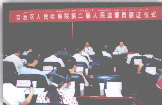
自治区检察院实行检务公开，建立人民监督员制度，接受人民群众各阶的监督

全区检察机关坚持不懈的用马列主义、毛泽东思想，邓小平理论和“三个代表”的重要思想武装广大检察干警，强化政治观念，严明政治纪律，在思想上、政治上、行动上同党中央保持高度一致，坚持把政治建设放在首位，不断加强领导班子建设和队伍建设，凝聚力和战斗力不断增强，整体素质有了新的提高；坚持“稳定压倒一切”的思想不动摇，坚决贯彻中央和自治区党委关于维护新疆稳定的决策部署，依法严厉打击“三股势力”的分裂破坏活动和各种刑事犯罪，维护社会政治大局稳定；坚持标本兼治、综合治理、惩防并举、注重预防的方针，主动出击，加强刑事立案监督、侦查活动监督、刑事审判监督、刑罚执行监督、民事审判和行政诉讼监督，有力保障国家法律的统一正确实施。为确保自治区的社会政治稳定提供坚强的组织保障。