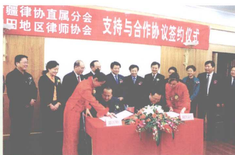
律师协会相互交流合作，共同推进律师工作的发展