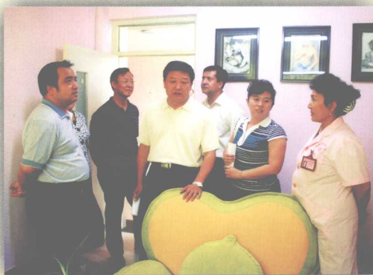
自治区艾尔肯·吐尼亚孜副主席在自治区人口计生委李国江书记陪同下到喀什市计生服务站检查工作。

认真贯彻《新疆维吾尔自治区流动人口计划生育服务与管理暂行办法》，认真贯彻自治区党委政法委等部门在伊宁市联合召开流动人口服务与管理现场交流会精神，全面加强服务与管理工作的。目前全区流动人口集中的7个地(州、市)、37个县成立了流动人口计生管理机构，共配备专兼职工作人员163人。各级不断加大对流动人口计生服务和管理目标管理责任制考核权重，加大对流动人口管理经费和免费技术服务经费的投入力度不断增强，去年，自治区本级用于流动人口计生事业经费达160万元。