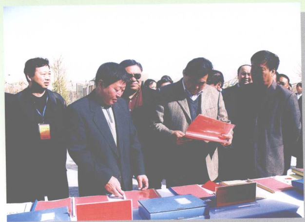
司法厅党委书记杜建锡(左二)、厅长阿不力孜·吾守尔(右二)在基层检查工作