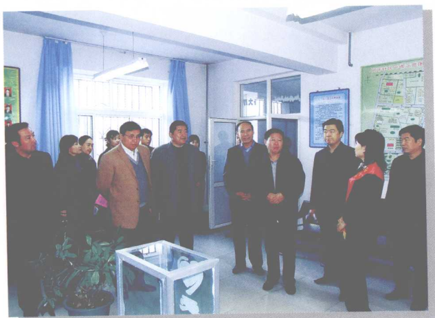
司法厅领导在基层调研