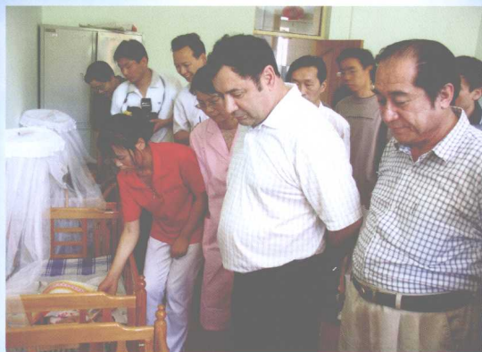
自治区党委常委肖开明·依明看望孤儿院的孩子们。