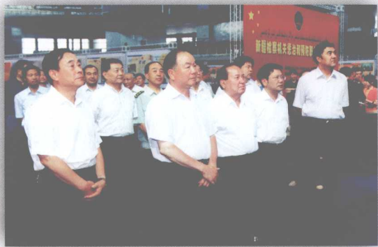
自治区领导观看新疆检察机关惩治和预防职务犯罪展览