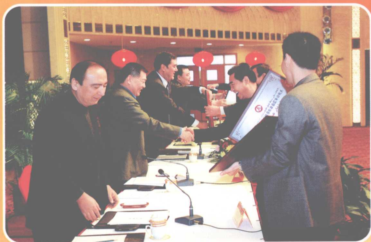
自治区领导在审计工作会议上给先进集体颁奖