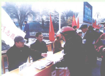
司法厅工作人员在广场进行法制宣传