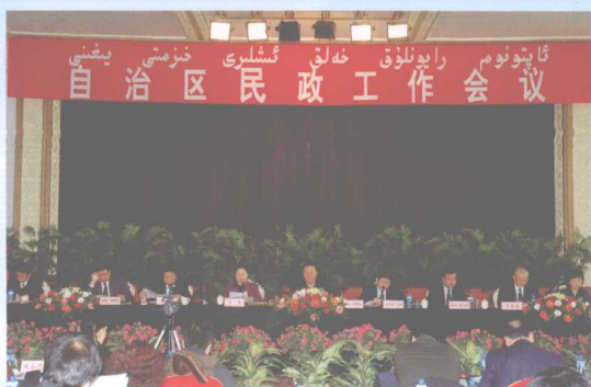
2009年自治区民政工作会议