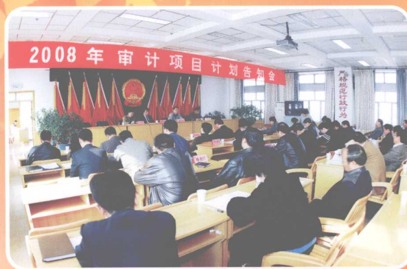
召开审计项目计划告知会

各级审计机关全年共审计2949个单位，专项审计调查233个单位，查出各类违规违纪问题金额47.4亿元，损失浪费1.1亿元，侵害人民群众利益1177万元。通过审计增加财政收入5.61亿元，追回被侵占的资金1.08亿元；移送司法纪检监察机关38人，涉案金额3625万元；移送其他部门处理事项30件。审计机关提出的审计建议被采纳3538条，被审计单位制定整改措施278项，建立健全规章制度140个(份)；提交的审计专题报告、综合性报告和信息简报被党政领导和有关部门批示、采用2030篇次。