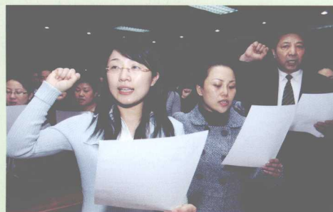
司法鉴定人员履职宣誓仪式