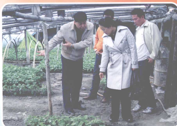
审计人员在农村信用社贷款项目现场调查