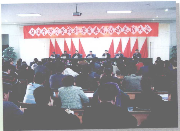
司法厅党委积极践行科学发展观