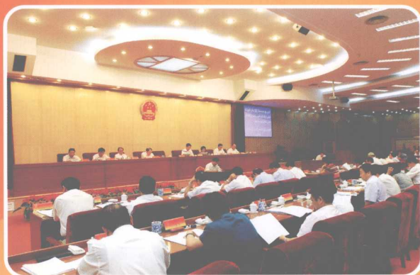
自治区人大审议审计工作报告

2008年，在自治区党委、人民政府领导下，全区审计机关以邓小平理论和“三个代表”重要思想为指导，认真贯彻党的十七大和全国审计工作会议精神，深入学习实践科学发展观，树立科学审计理念，积极围绕自治区经济工作中心，把“推进法制、维护民生、推动改革、促进发展”作为审计工作的出发点，注重揭示和反映自治区财政经济管理及运行中存在的突出问题，积极向各级党委政府提出完善体制制度和机制的建议，圆满完成了全年的各项审计工作任务。审计监督在促进加强管理，维护经济秩序，加强廉政建设，推进改革和发展发挥了积极的作用。