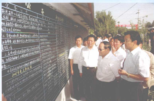
2007年9月20日，自治区副主席贾帕尔·阿比布拉（右二）在塔城地委书记彭家瑞（右一）的陪同下，前往沙湾县金沟河镇参观村务公开民主管理工作情况。