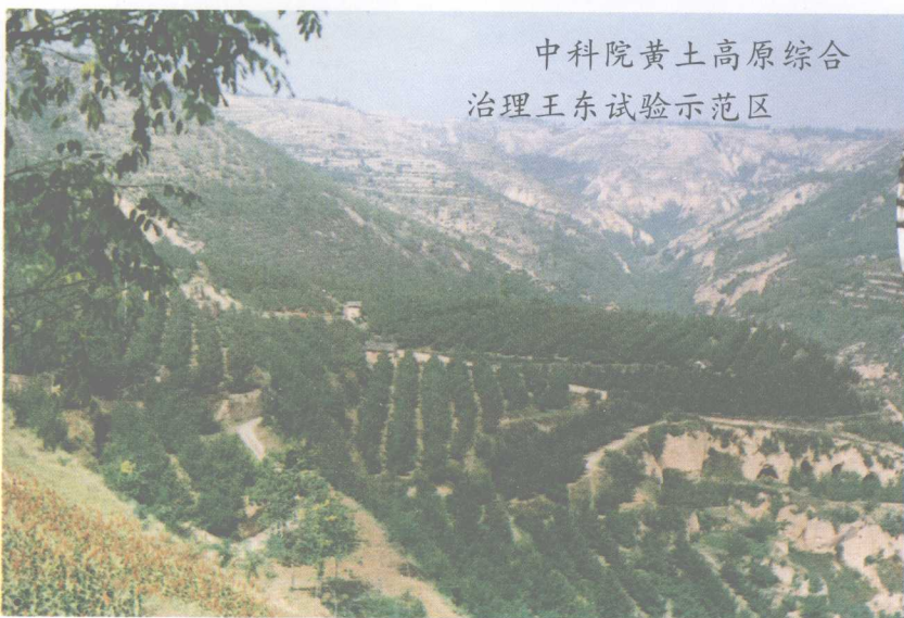
中科院黄土高原综合治理王东试验示范区