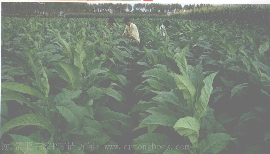
▶ 优质烤烟基地大田