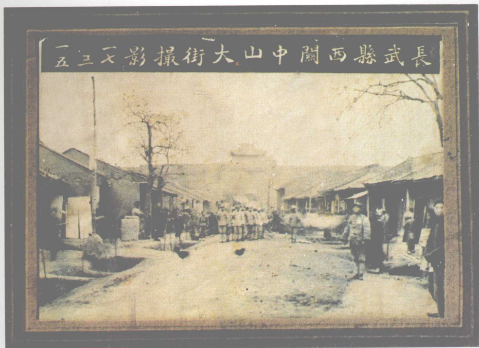
◀ 民国时期县城西街（一九二八年）