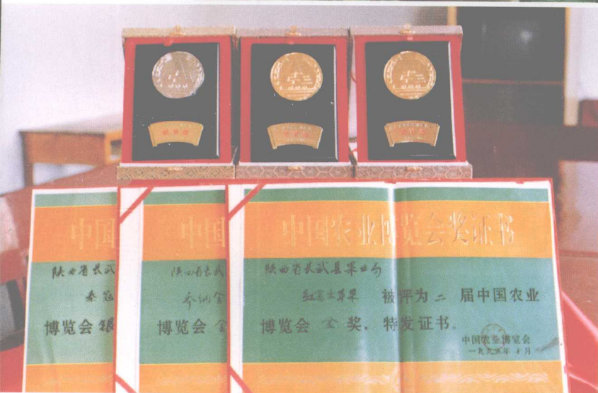
◀ 长武出产的苹果荣获中国农业博览会“两金一银”奖