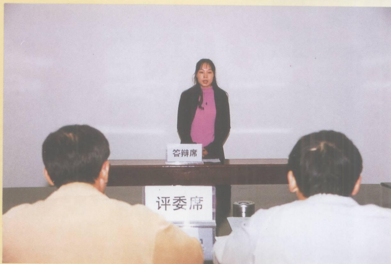
竞争上岗干部在面试。