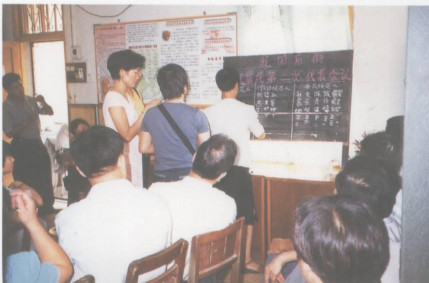
花园后街社区居委会在选举大会上统计选票。