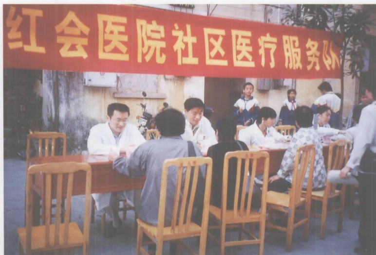
端州红会医院社区医疗服务队在为民服务。