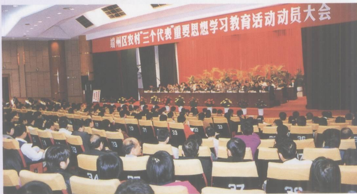
端州区农村“三个代表”重要思想学习教育活动动员大会。