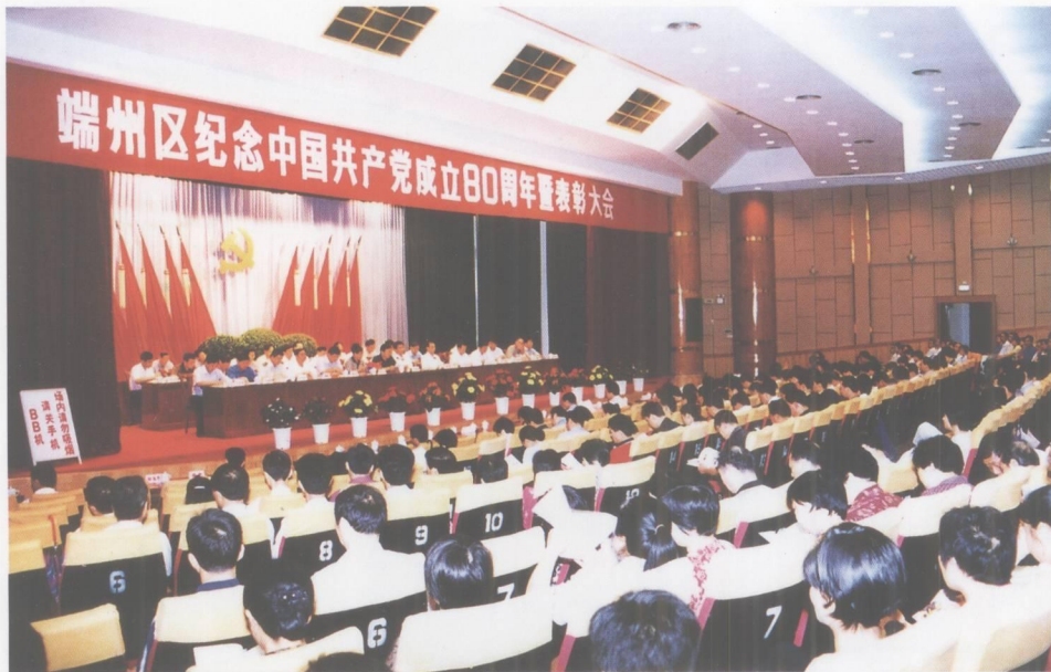
端州区纪念中国共产党成立80周年暨表彰大会。