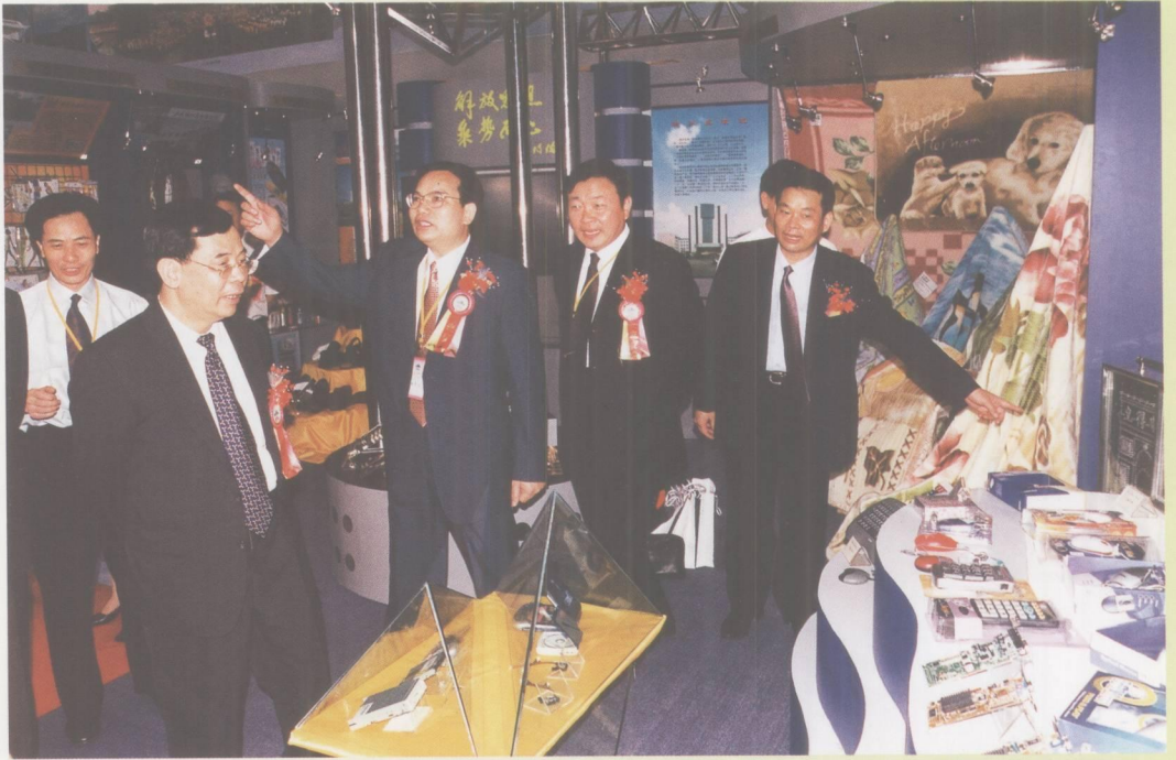
肇庆市召开经济技术贸易洽谈会。图为省、市、区领导视察端州展区。