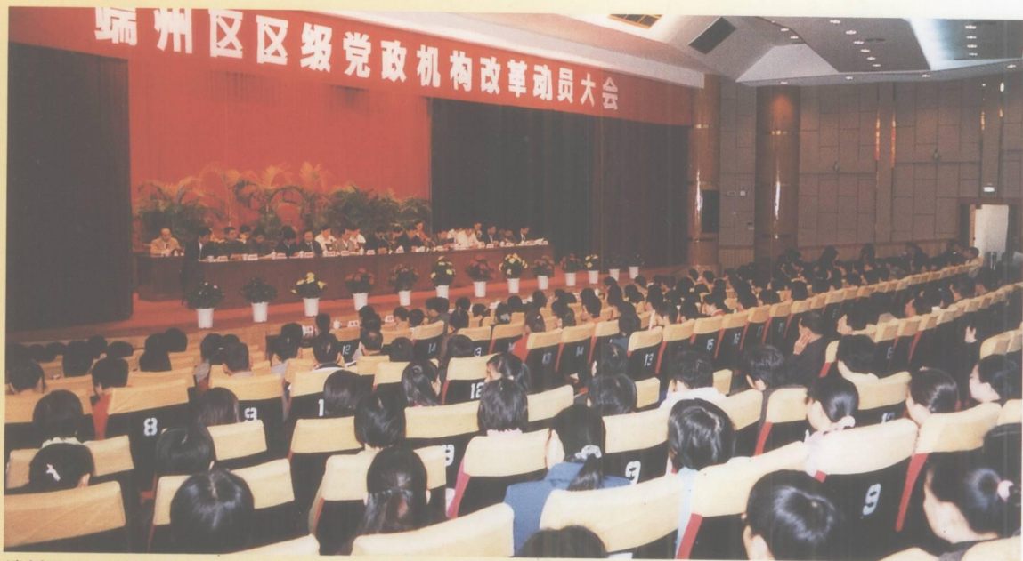
端州区召开区级党政机构改革动员大会，部署改革工作。