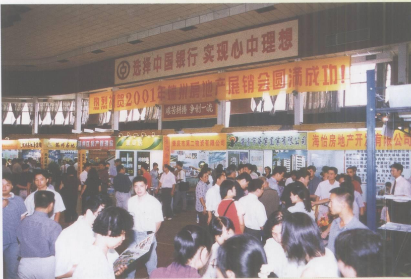
2001年端州房地产展销会盛况。