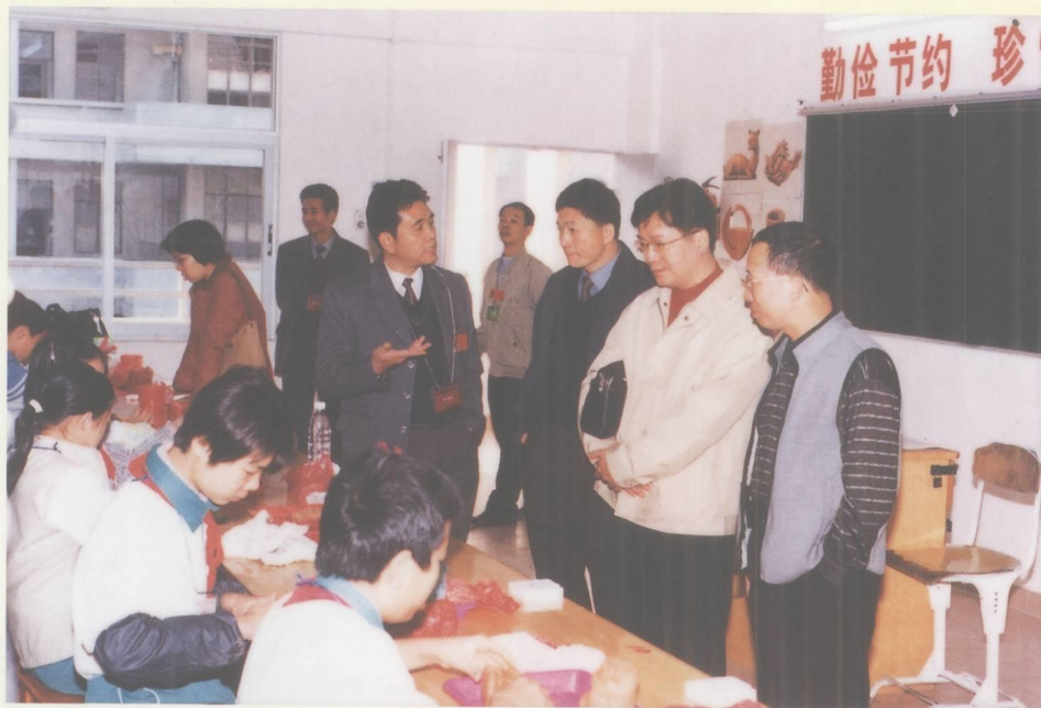
区教育局、劳动部门领导视察端州区劳动基地。