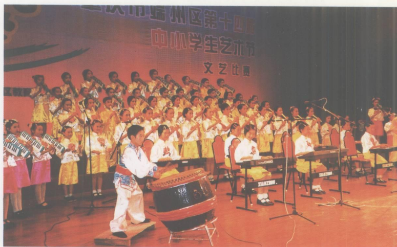
端州区第十四届中小 生艺术节文艺比赛现场。