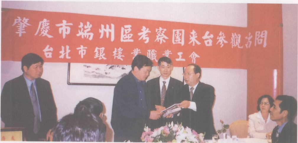
端州区赴台湾招商情景。