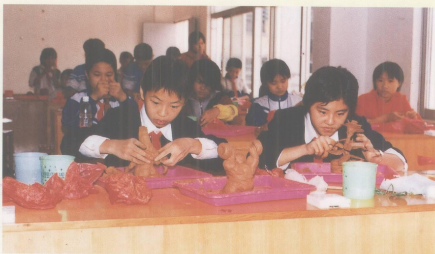
图为小学生在劳动基地学习陶艺。