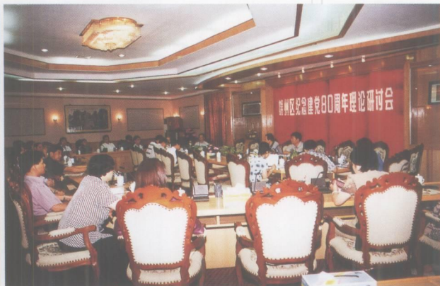
端州区纪念建党80周年理论研讨会。