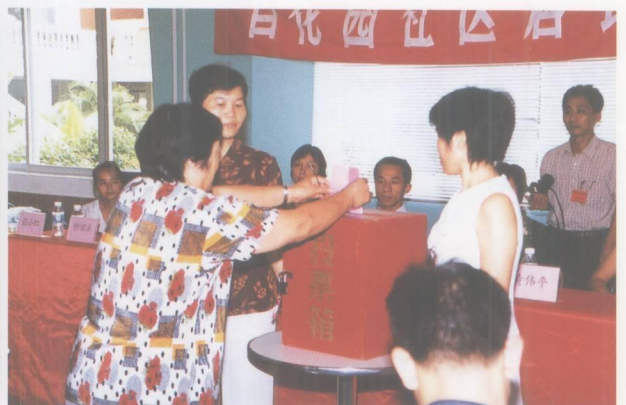
百花园社区居民行使选民权利投票。