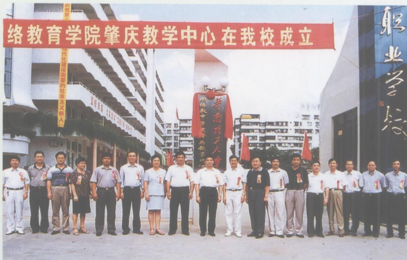
华南理工大学网络教育学院肇庆教学中心在肇庆职业学校挂牌成立。