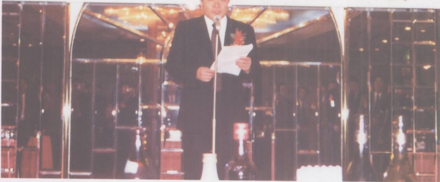
刘正南区长率队赴日本招商致辞。