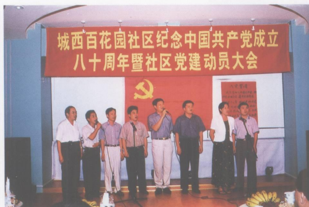
城西百花园社区纪念中国共产党成立八十周年暨社区党建动员大会。