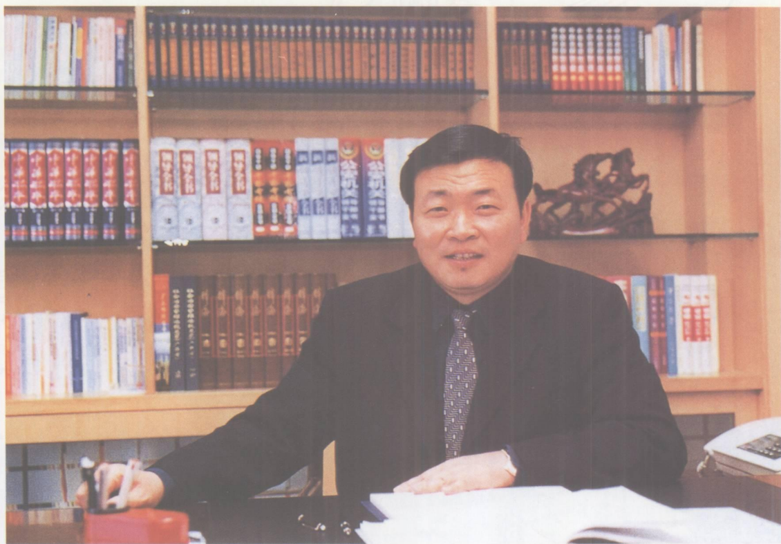
肇庆市端州区人民政府区长 刘正南

端州有着作为中等城市城区良好的基础设施及发展条件，自然资源十分丰富，经济发展欣欣向荣，社会繁荣安定。工业、建筑房地产业、商贸餐旅服务业是支撑端州经济发展的三大支柱产业。跨入新世纪，端州区实施了“二三产业并举、外向带动、科教兴区、民营旺区、可持续发展”五大发展战略。