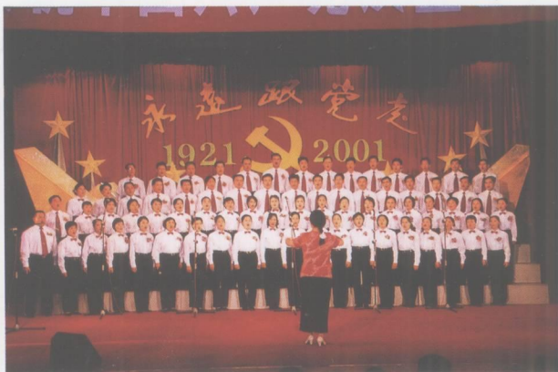
庆祝建党80周年，端州区举办“永远跟党走”歌咏大赛。16支合唱队共1000多人参加了比赛。区直属机关合唱队在比赛中获金奖。