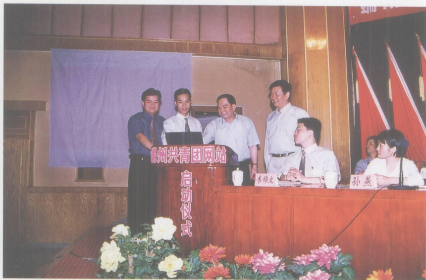
共青团端州区网站启动仪式。