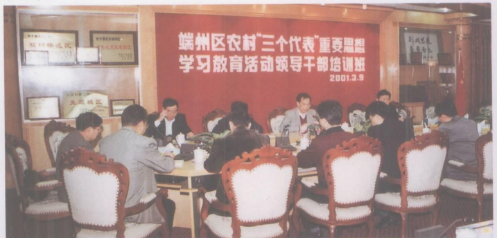
端州区农村“三个代表”重要思想学习教育活动领导干部培训班。