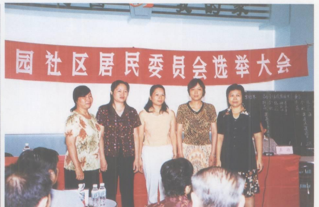
百花园社区居委会作为试点，首先选出了“当家人”。