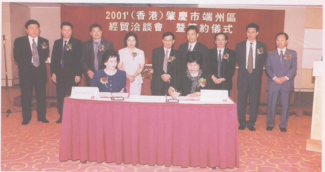
2001年（香港）肇庆市端州区经贸洽谈会签约仪式。