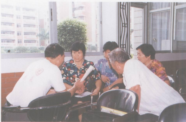
百花园社区选民在酝酿候选人。