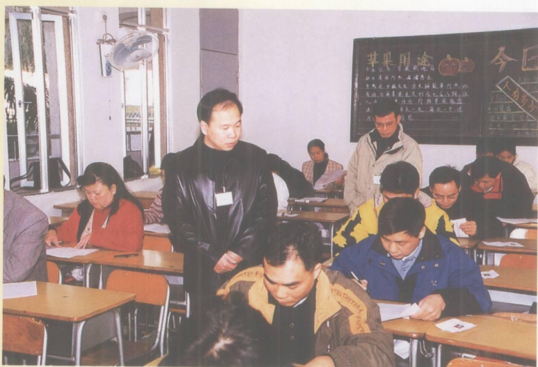
为加快干部人事制度改革，端州区对中层干部实行竞争上岗。图为区委副书记黄劲松视察笔试考场。