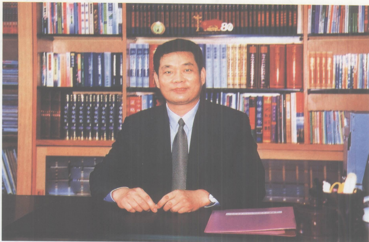
中共肇庆市端州区委书记 黄 福

端州区是广东省肇庆市的中心城区，是肇庆市的政治、经济、文化中心。地处广东省中部，位属珠江三角洲经济区范围，下辖两镇及四个街道办事处，面积152.3平方公里，人口约32.32万。