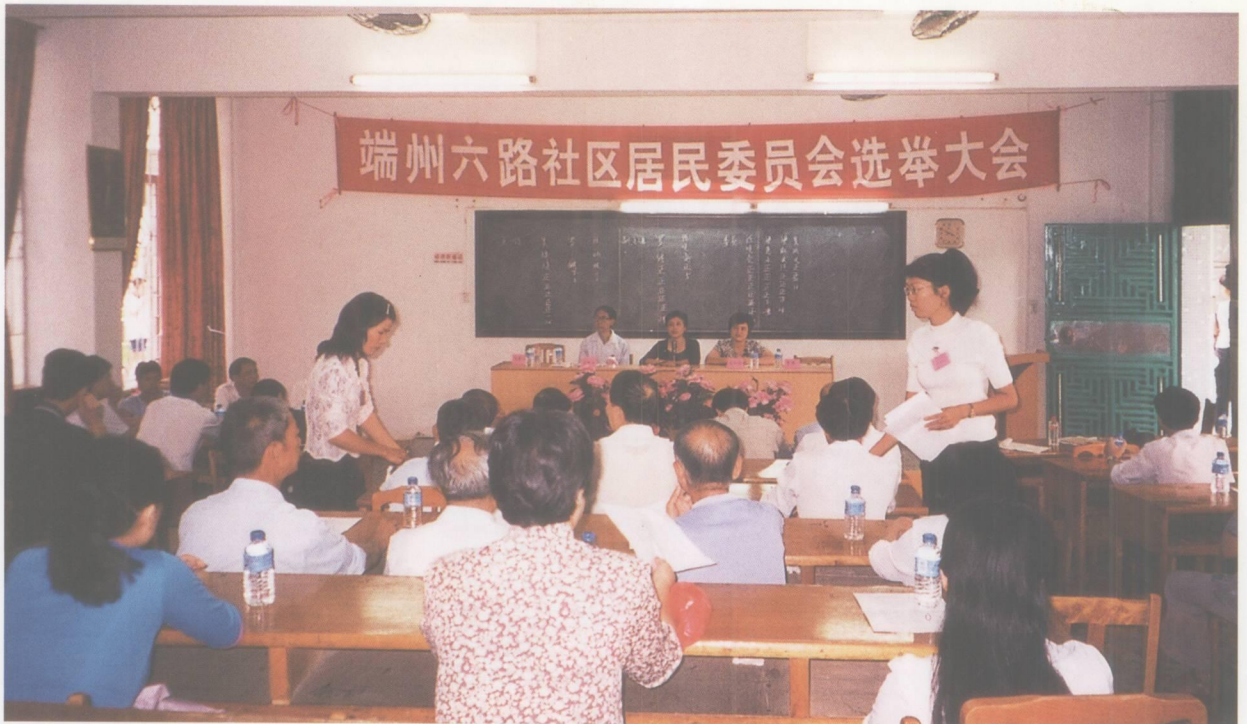
推进社区建设，加快城市化进程，端州区开展社区居民委员会选举工作。图为端州六路社区居民代表在进行选举。