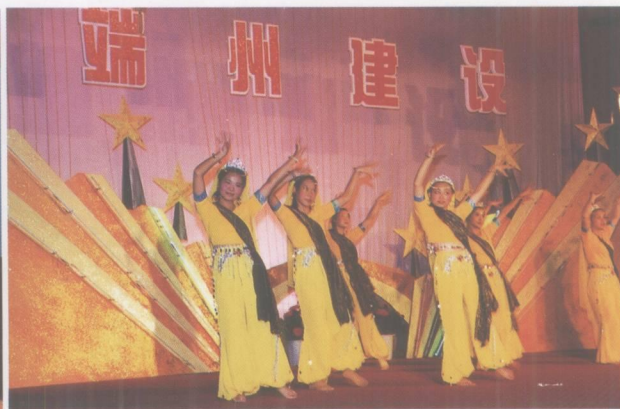
端州建设系统载歌载舞庆祝党的生日。