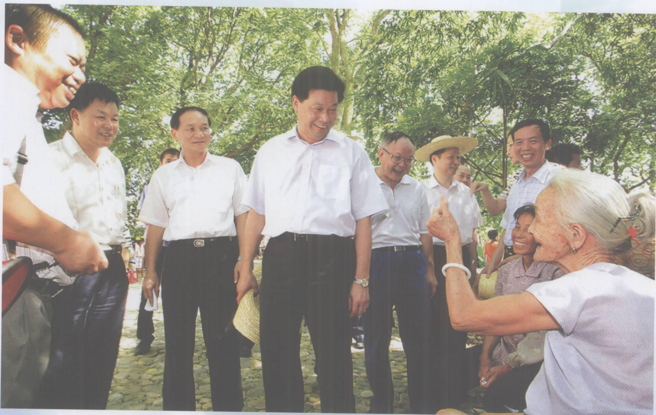
2007年7月25日，省委常委、宣传部长林雄在市委书记覃卫东，市委副书记陈文敏，市委常委、宣传部长陈以良等陪同下考察鼎湖区蕉园生态文明村。