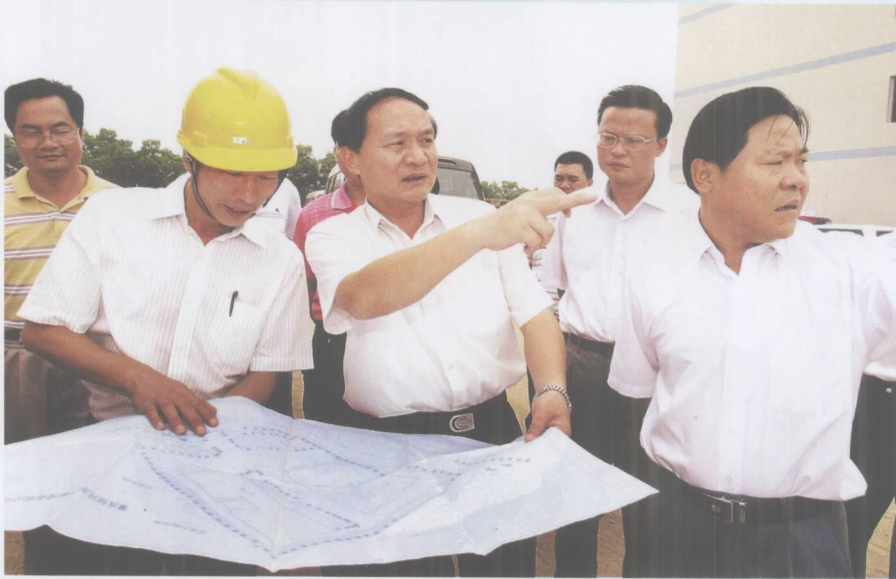
市委书记、市人大常委会主任覃卫东在高要市委书记武临黔等陪同下深入高要市开展调研。