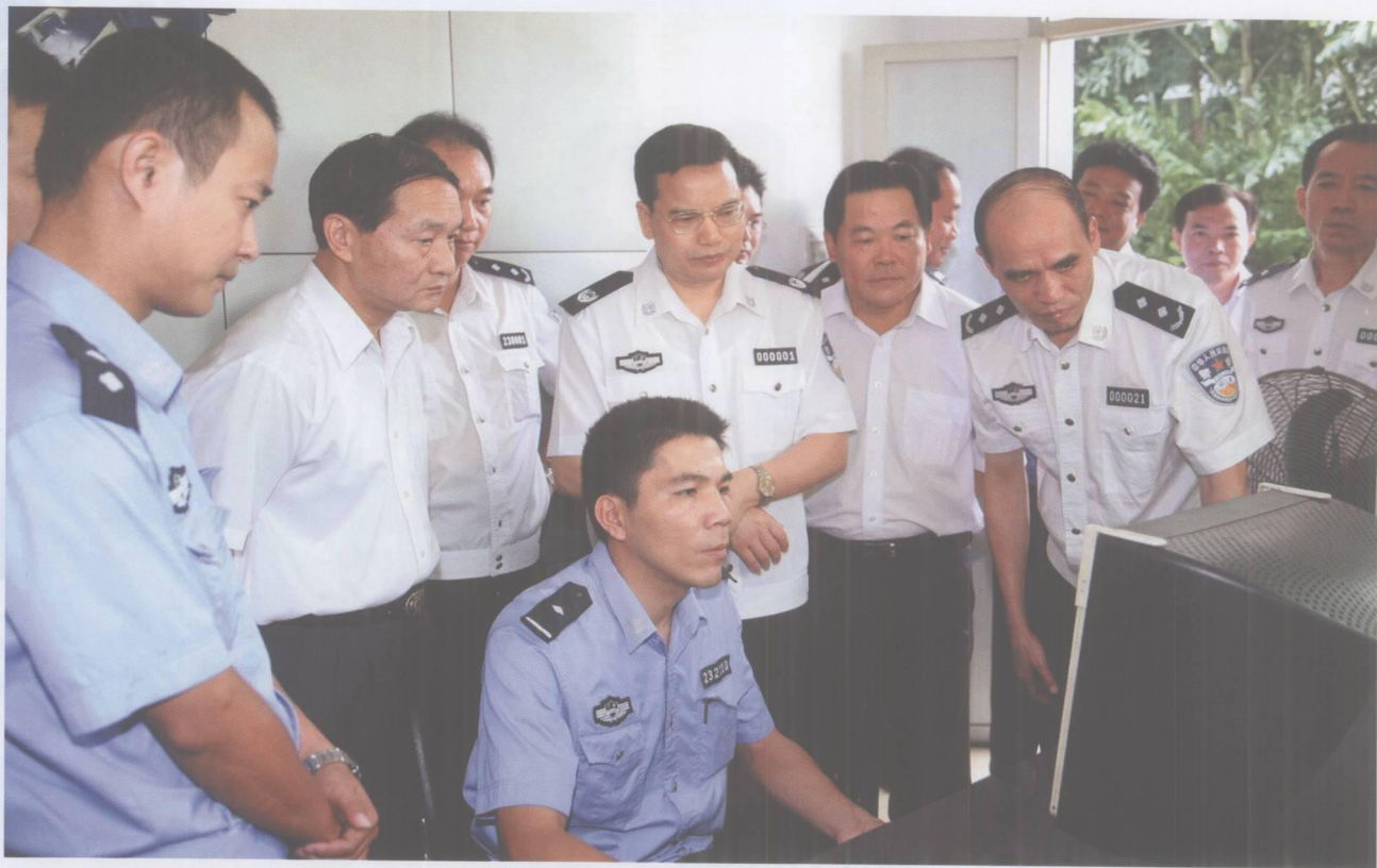
2007年9月26日，省委常委、公安厅厅长梁伟发在市委书记覃卫东，市委常委、公安局长郑针和等陪同下到高要市考察公安机关“三基”工程建设情况。