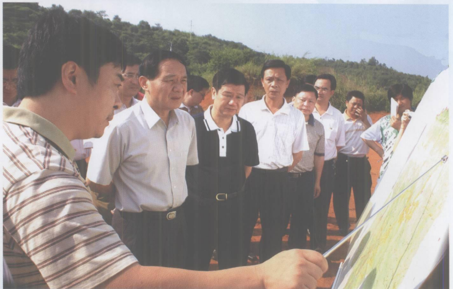
市委书记、市人大常委会主任覃卫东在封开县委书记范汝雄等陪同下考察华润水泥生产基地。