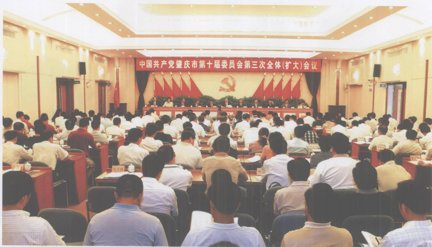
2007年5月30日，中共肇庆市第十届委员会第三次全体（扩大）会议召开。