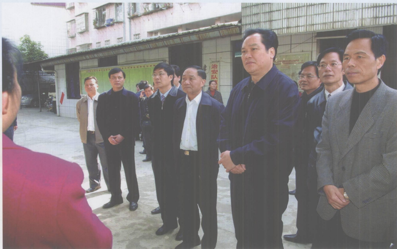
2007年1月29日，省委常委、纪委书记朱明国在市委书记覃卫东，市委副书记、市长杨浩明，市委常委、纪委书记曾超鹏，市委常委、秘书长张成文等陪同下到端州区调研、指导工作。