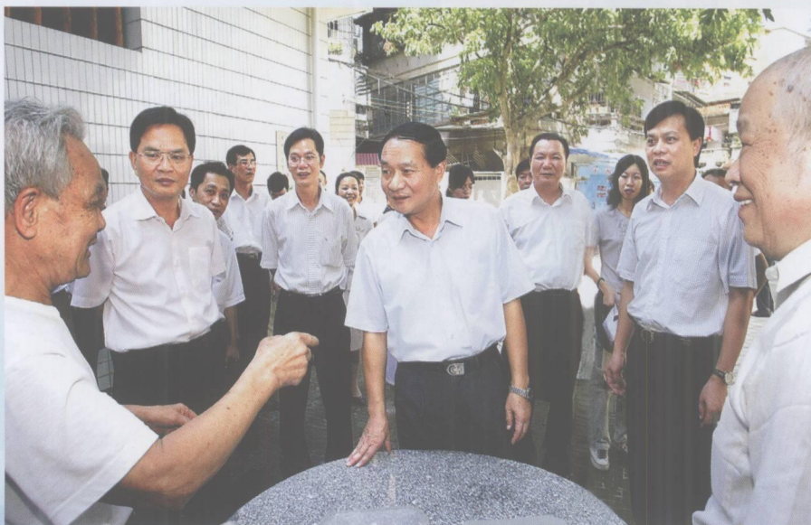
市委书记、市人大常委会主任覃卫东在市委常委、秘书长张成文，市人大常委会副主任陈端，端州区委书记杨永等陪同下到端州区开展新时期坚持党的群众路线专题调研。