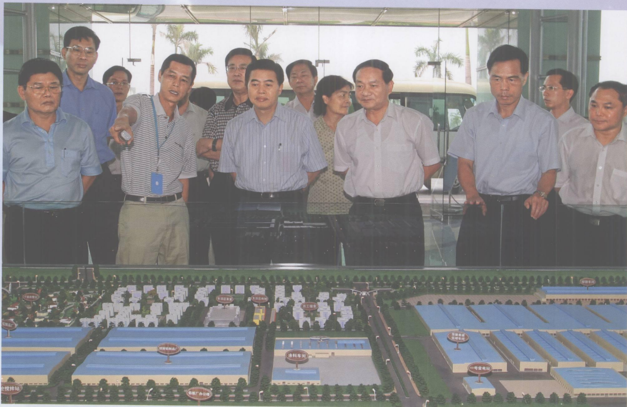
2007年8月13日，省委副书记、省长黄华华在市委书记覃卫东，市委副书记、市长杨浩明，市委常委、秘书长张成文等陪同下视察肇庆高新区。