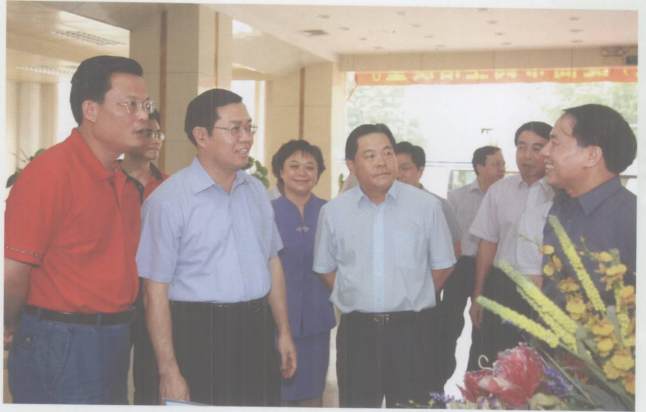
市委常委、常务副市长郭锋在高要市委书记武临黔等陪同下到高要市行政服务中心调研。