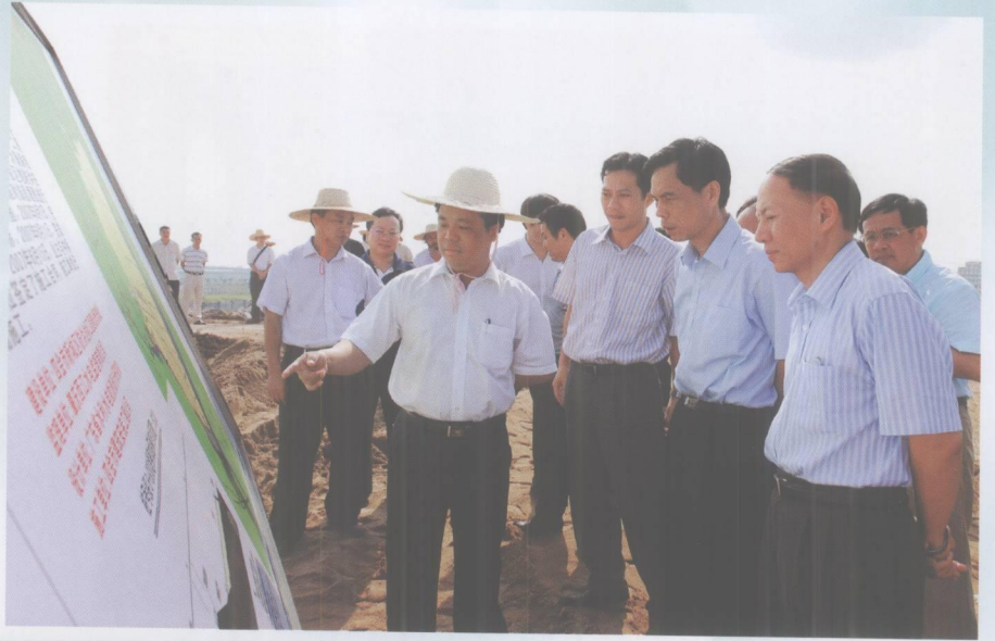
市委副书记、市长杨浩明在四会市委书记梁志强等陪同下到四会市检查指导防汛工作。