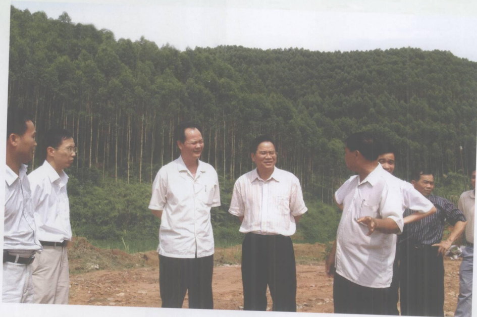
市委常委、组织部长李水华在怀集县委书记冯敏强等陪同下到怀集县调研。