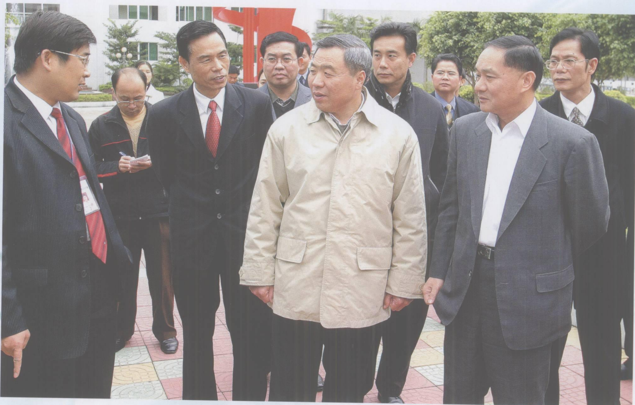
2007年1月23日，省委常委黄龙云在市委书记覃卫东，市委副书记、市长杨浩明，市委常委、常务副市长郭锋，市委常委、秘书长张成文等陪同下到肇庆市调研、指导工作。