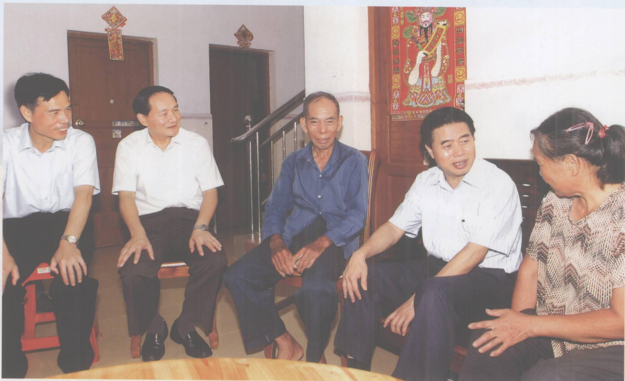
2007年8月13日，省委副书记、省长黄华华在市委书记覃卫东，市委副书记、市长杨浩明等陪同下到高要市回龙镇大井村农户家中调研。