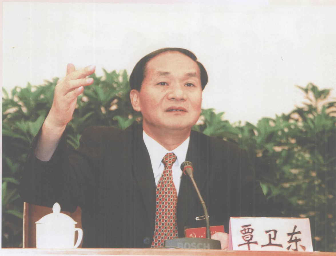
在中共肇庆市第十届委员会第三次全体（扩大）会议上，市委书记覃卫东作重要讲话。