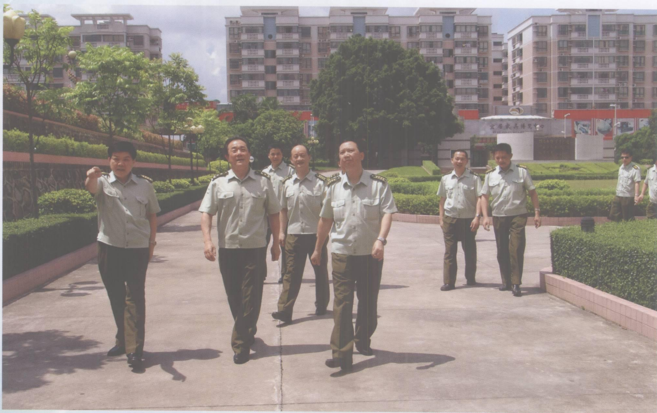
2007年5月30日，广州军区副司令员丁寿岳中将在市委常委、肇庆军分区司令员陆洪照等陪同下到肇庆军分区检查指导工作。