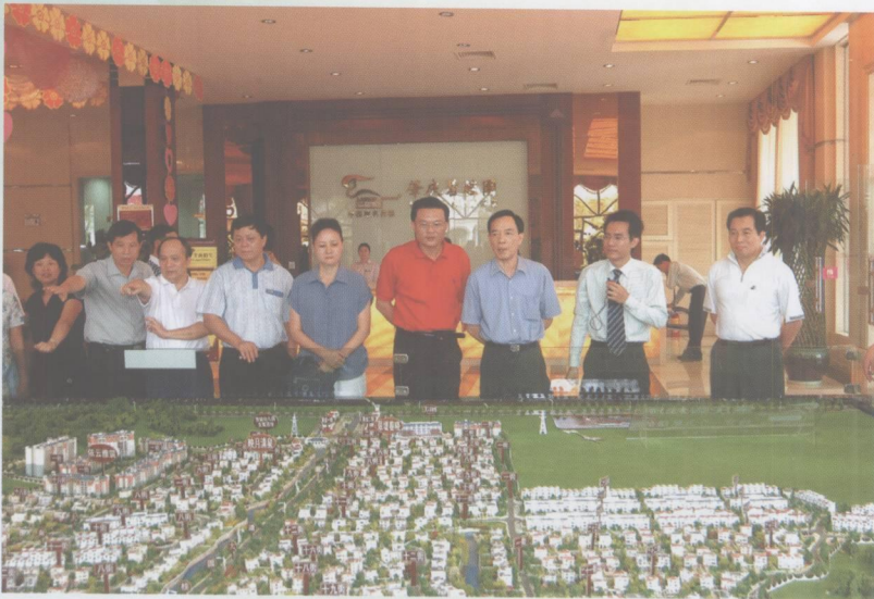
市政协主席梁国安在高要市市长徐敏坚等陪同下到肇庆碧桂园调研。