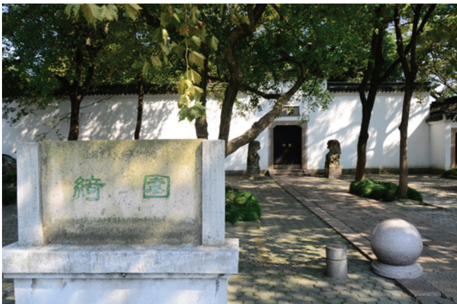
绮园(海盐县武原镇绮园路),2018年