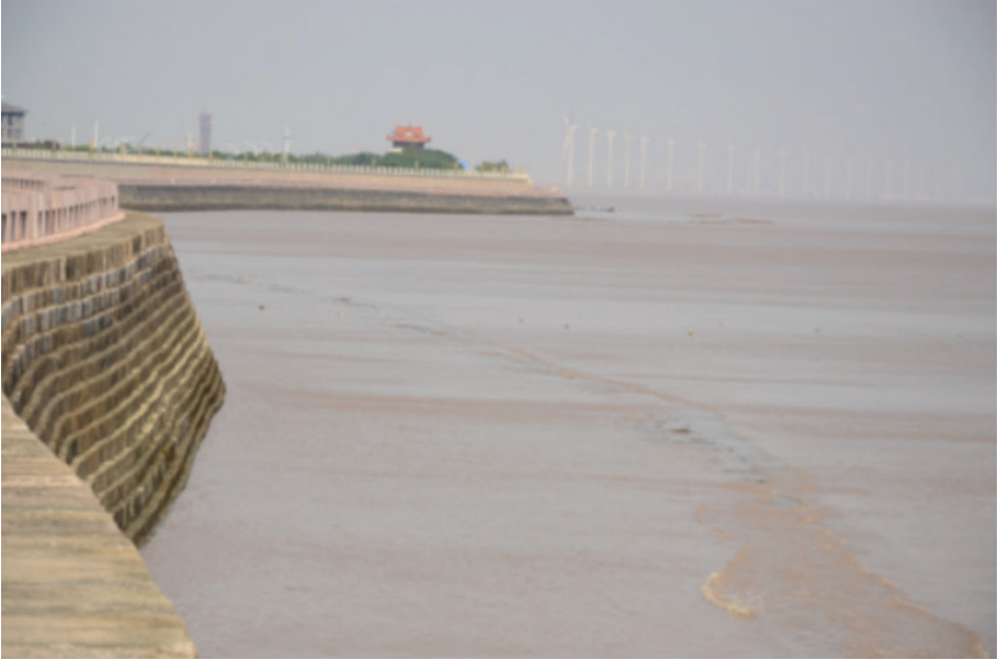
鱼鳞石塘(海盐县武原镇海塘),2018年