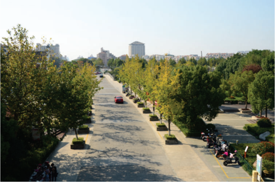
街景(海盐县武原镇滨海东路),2018年,张薇摄