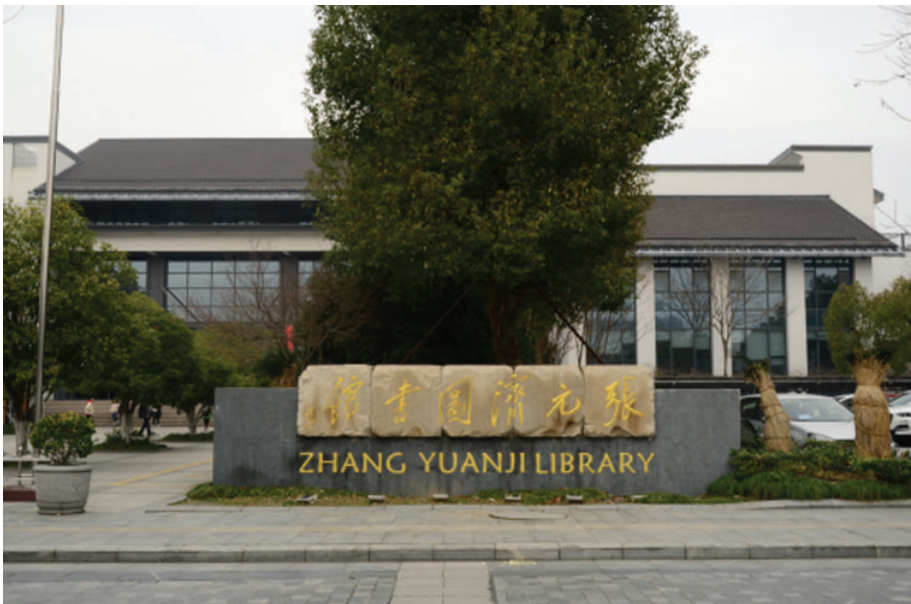
张元济图书馆(海盐县武原镇文昌东路),2018年