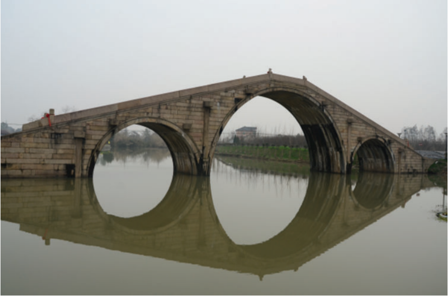
沈荡大桥(海盐县沈荡镇),2018年