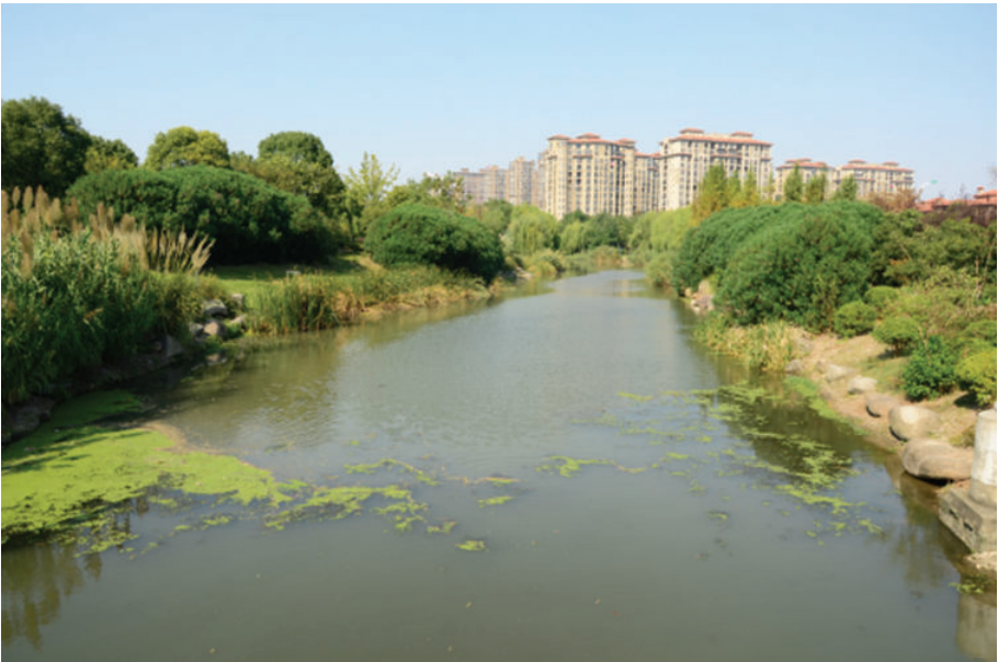
住宅新区(海盐县武原镇海滨住宅小区),2018年