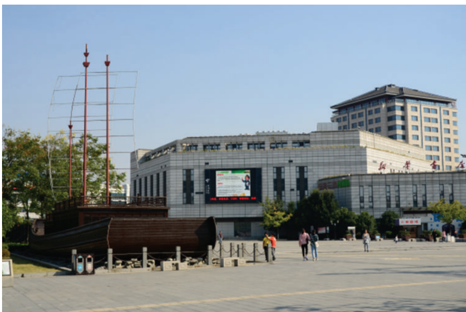
绮园广场(海盐县武原镇绮园广场),2018年