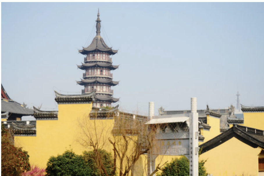
镇海塔(海盐县武原镇天宁寺),2018年