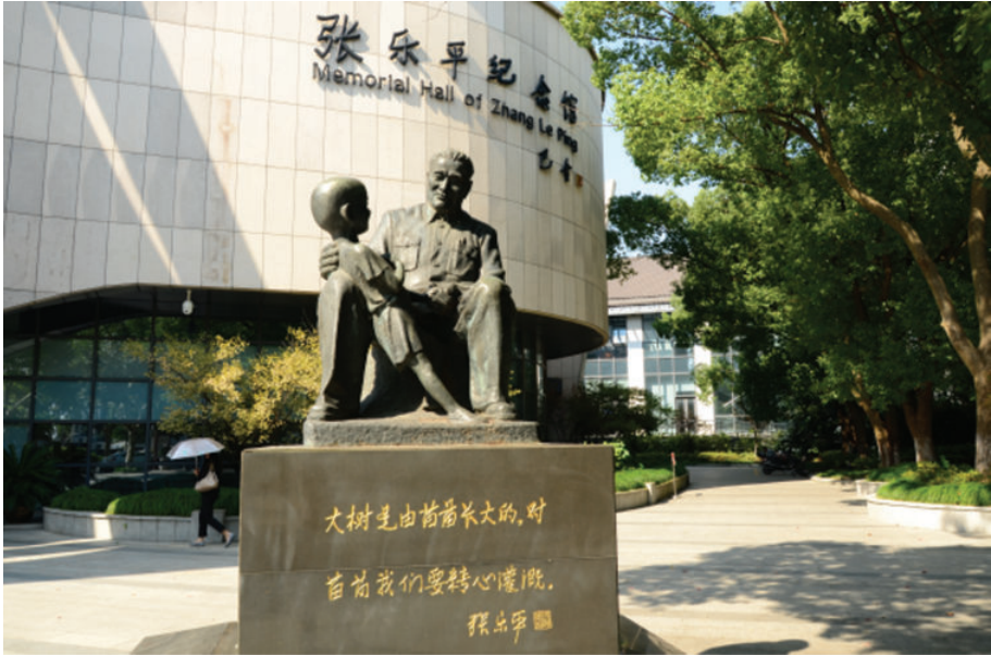
张乐平纪念馆(海盐县武原镇文昌东路),2018年