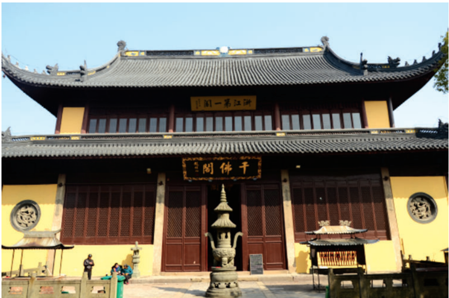
千佛阁(海盐县武原镇天宁寺),2018年