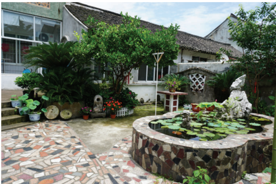
海盐民宅(海盐县武原镇杨家弄),2018年