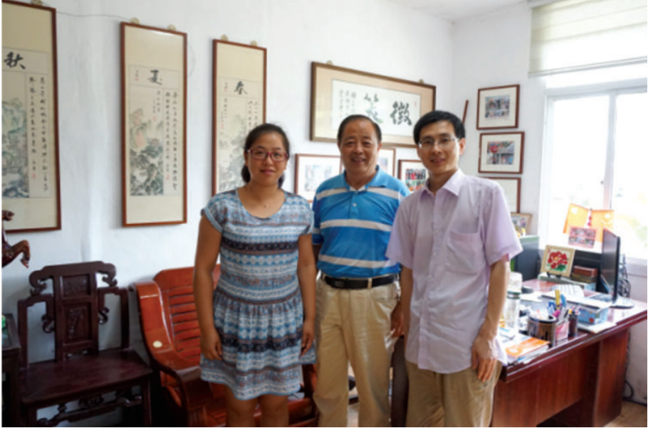
走访发音人(海盐县武原镇杨家弄),2016年,张圣英摄