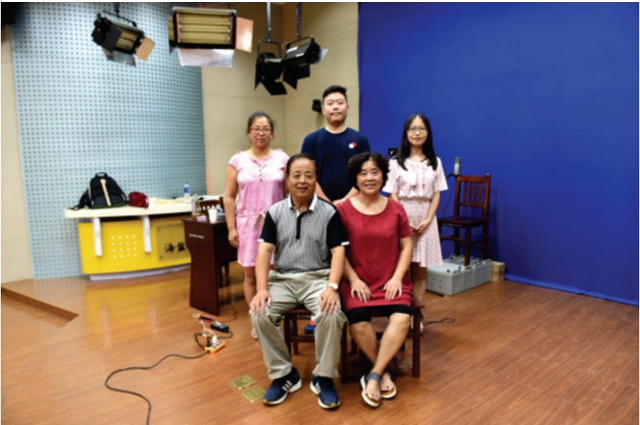
团队合影(海盐第二高级中学),2016年