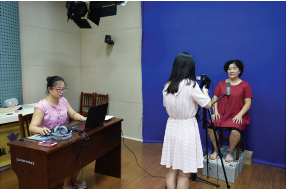
调查摄录现场(海盐第二高级中学),2016年,黄晓东摄