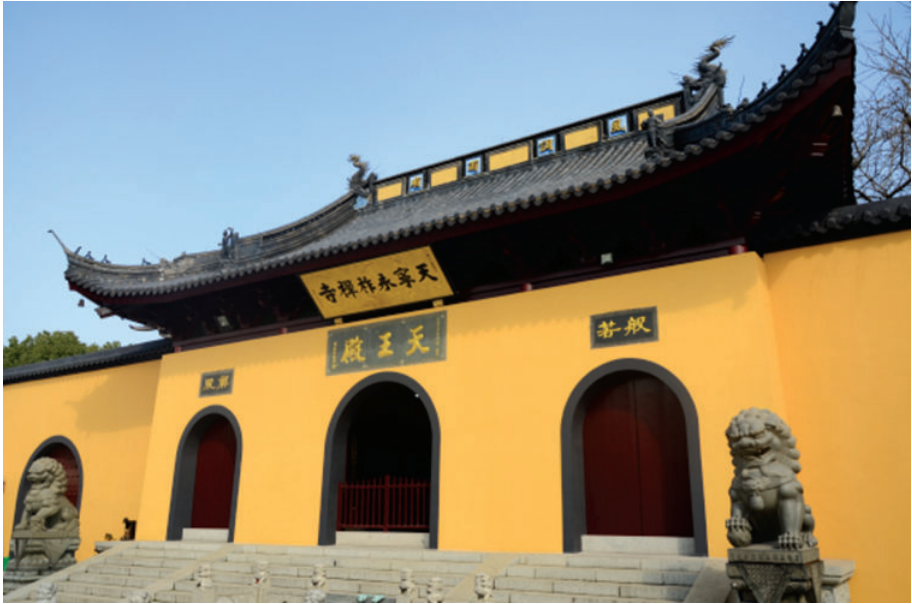
天宁寺(海盐县武原镇天宁寺),2018年,张薇摄