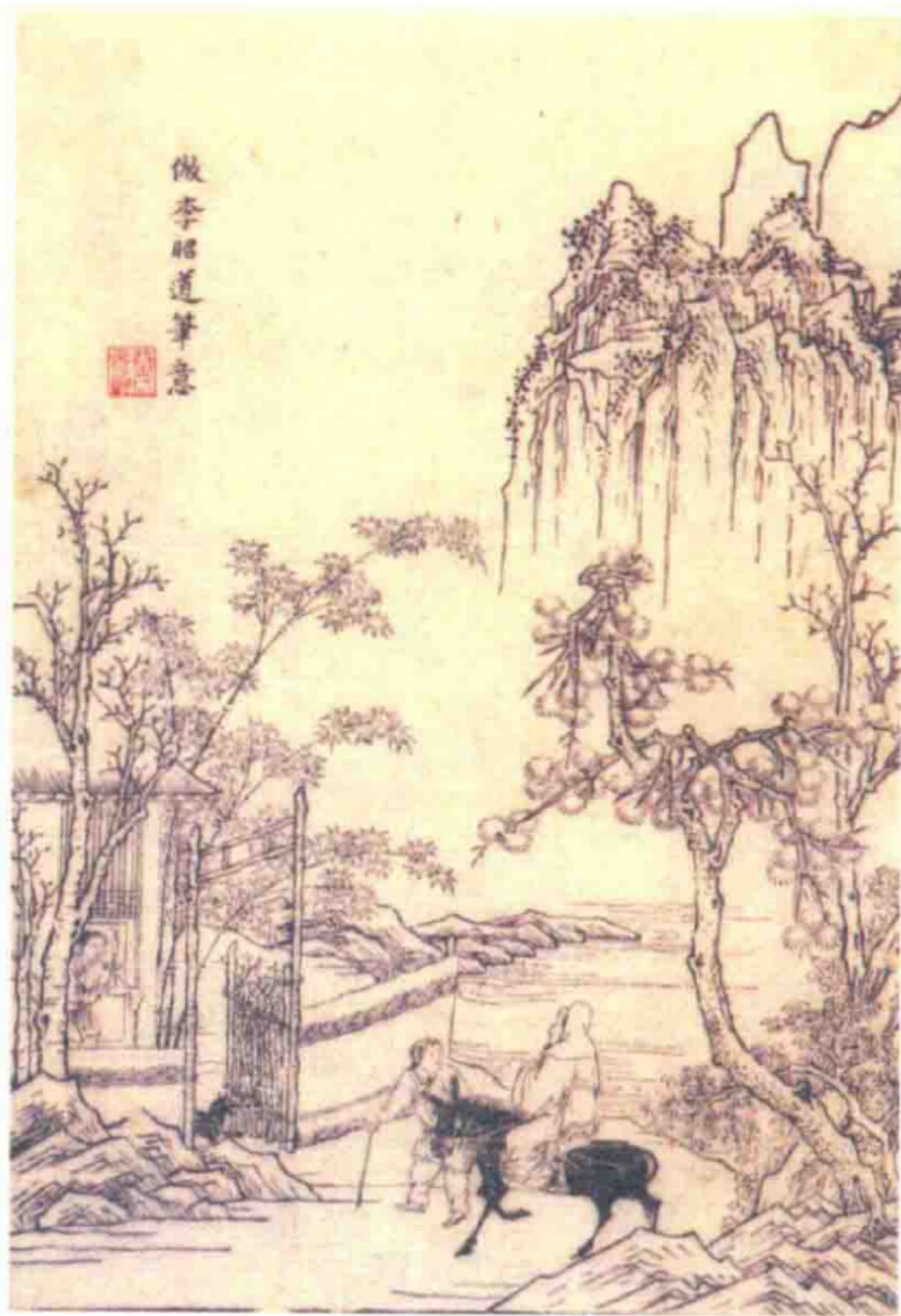
李白《峨眉山月歌》诗意图