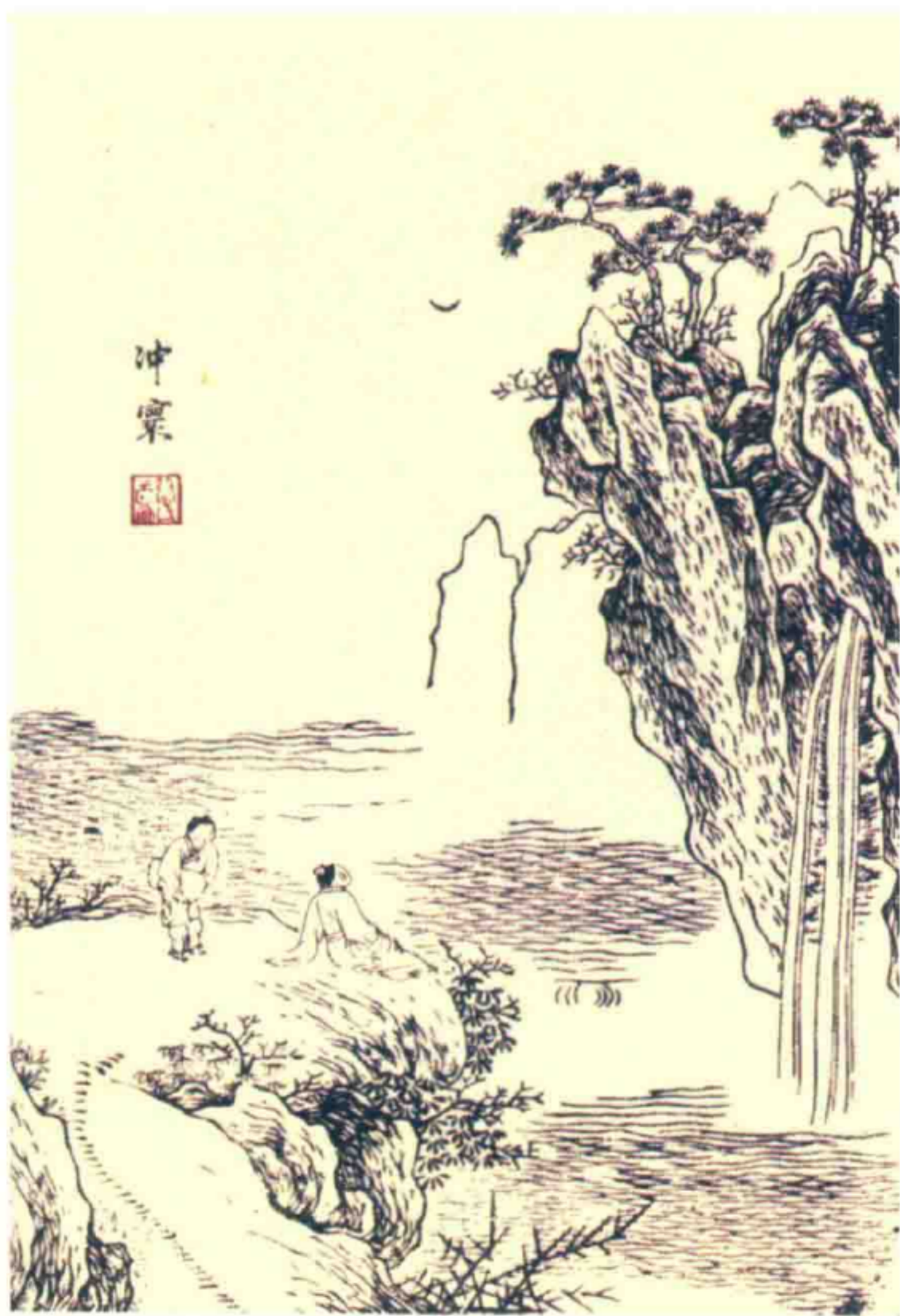
李白《峨眉山月歌》诗意图