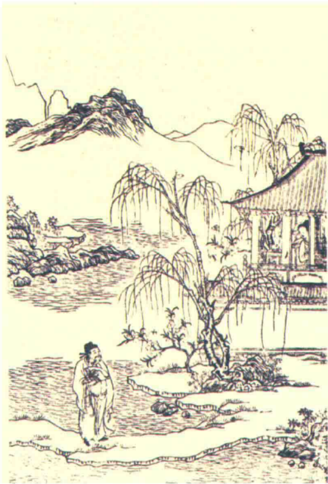
杜甫《江畔独步寻花》诗意图