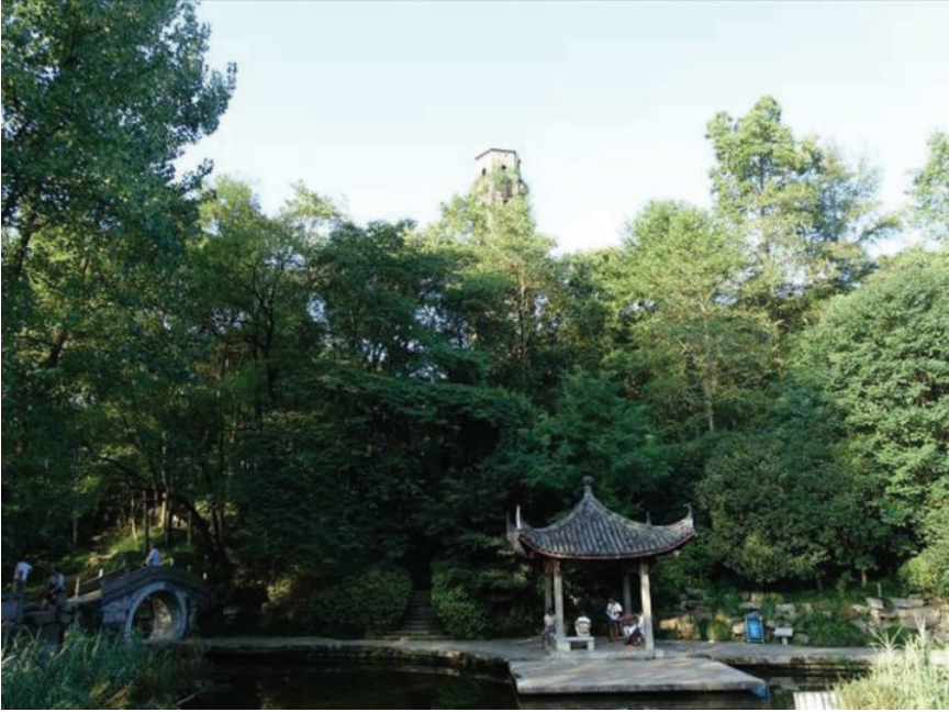
浦江县塔山公园,2016年