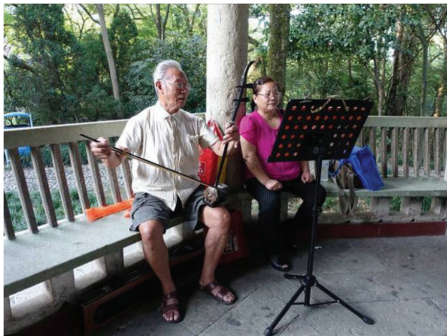
婺剧爱好者之图一,2016年