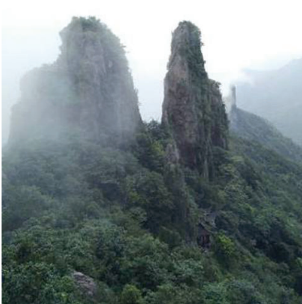
浦江县仙华山之图一,2014年