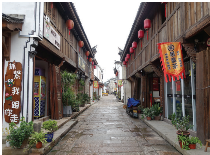
浦江县城老街,2018年