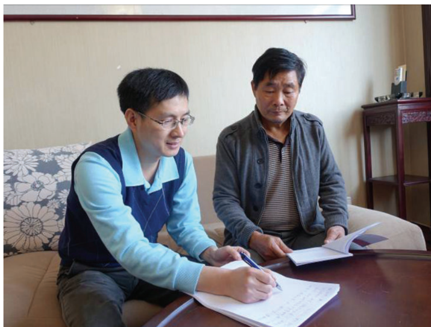
纸笔记录现场,2016年