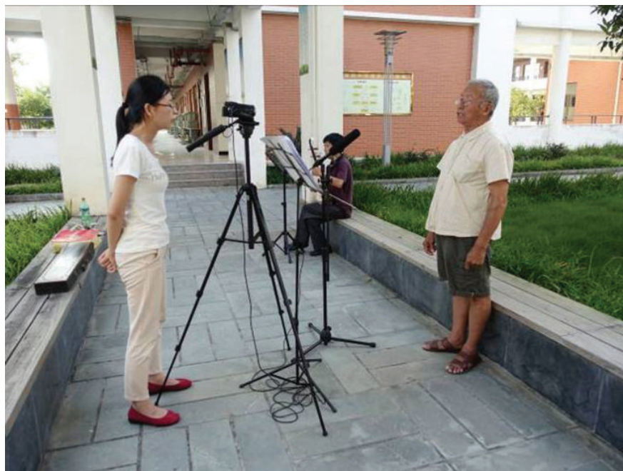
口头文化摄录现场,2016年,黄晓东摄