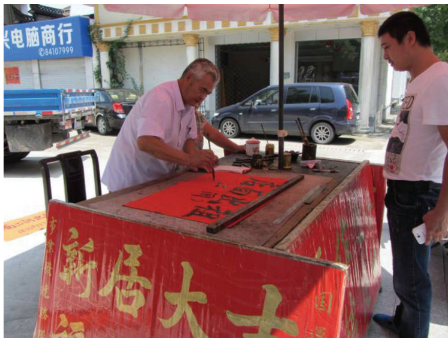
书法之图一,2014年