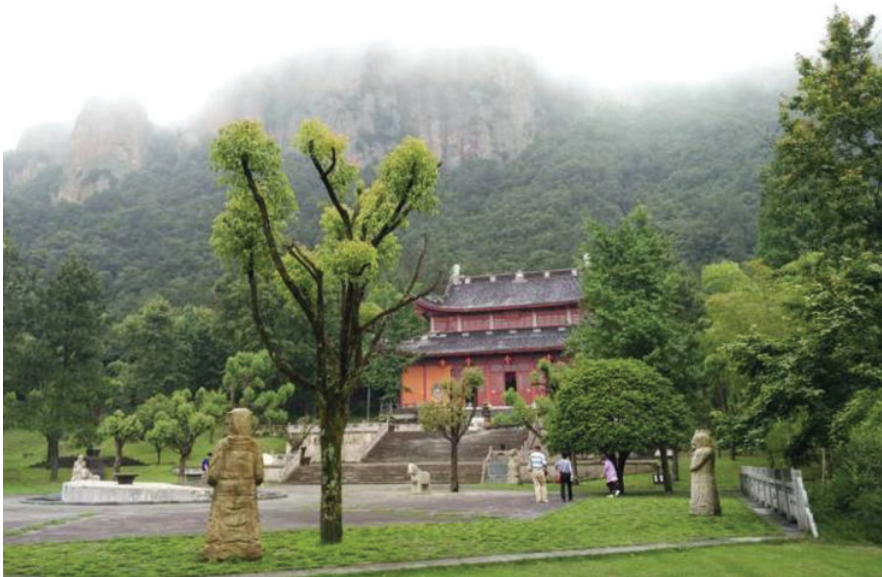
浦江县仙华山之图二,2016年