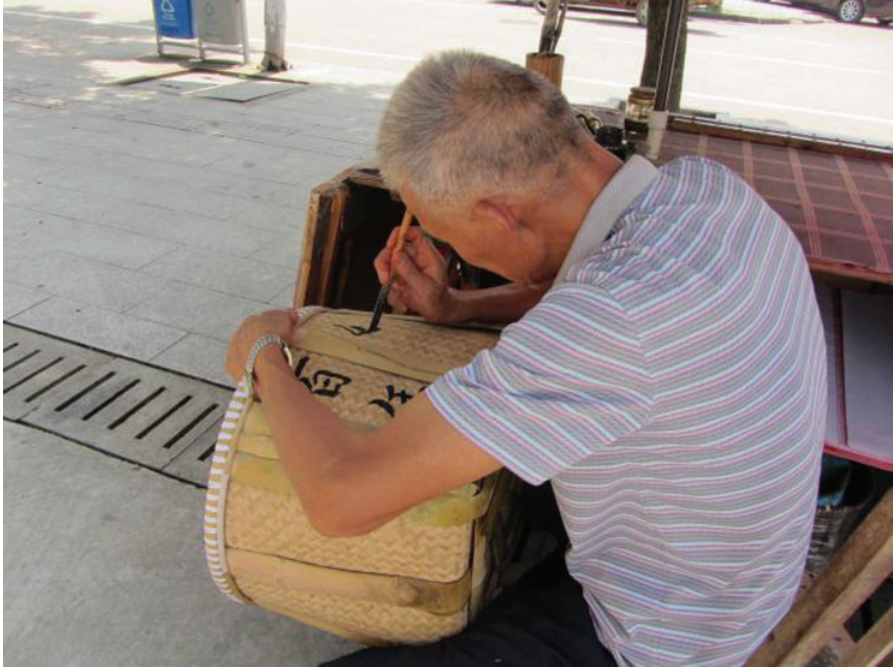
书法之图二,2014年,黄晓东摄