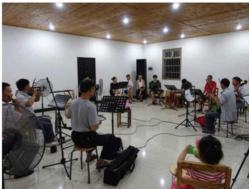
婺剧爱好者之图二,2016年