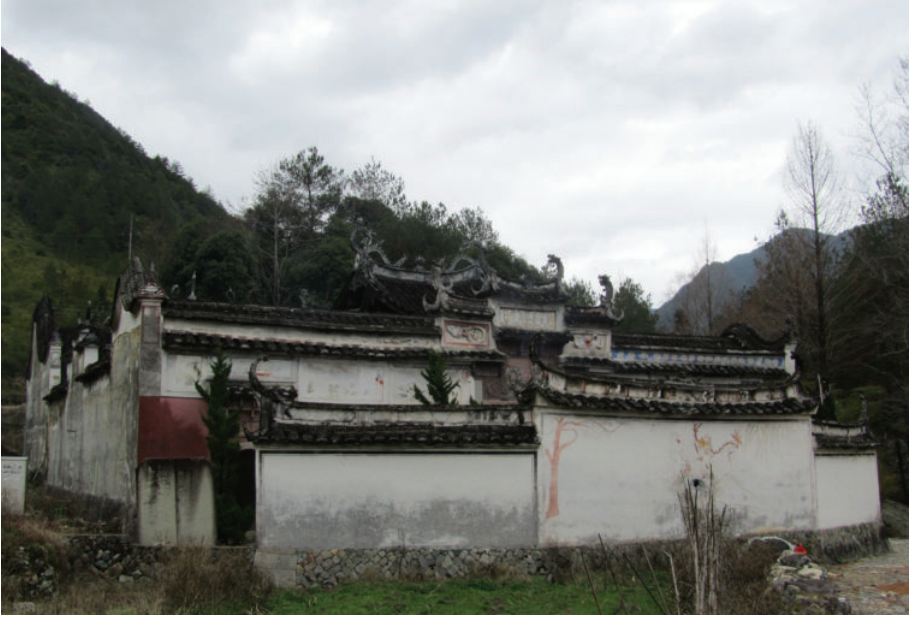
庆元西洋殿, 2015年, 王文胜摄