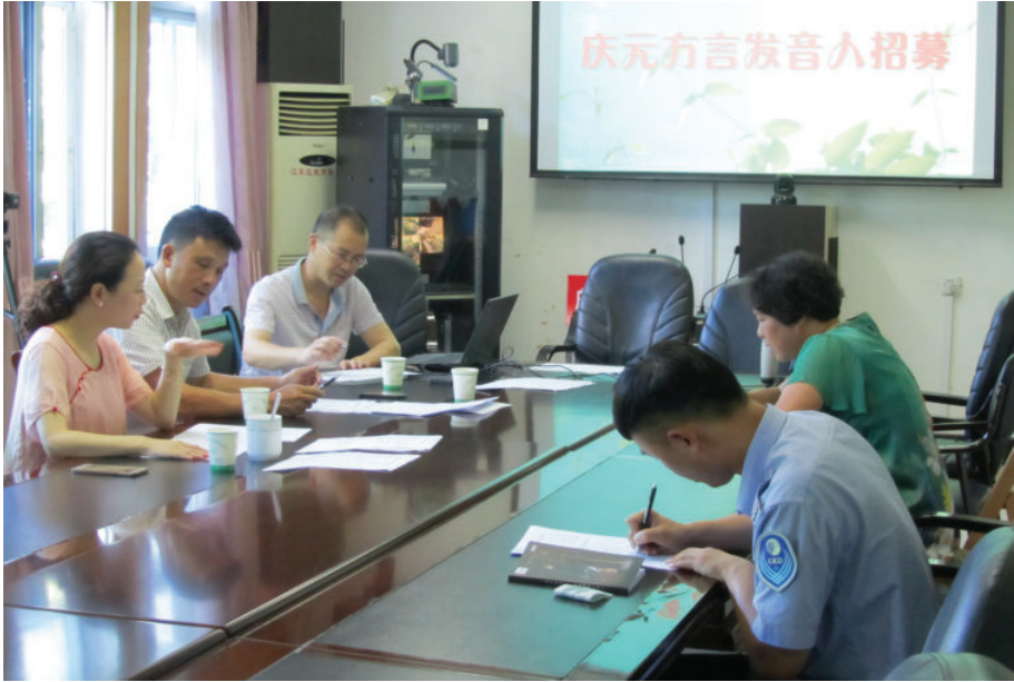
招募庆元方言发音人现场,2016年,窦林娟摄