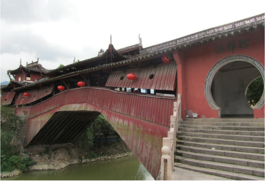
廊桥——咏归桥,2016年,王文胜摄