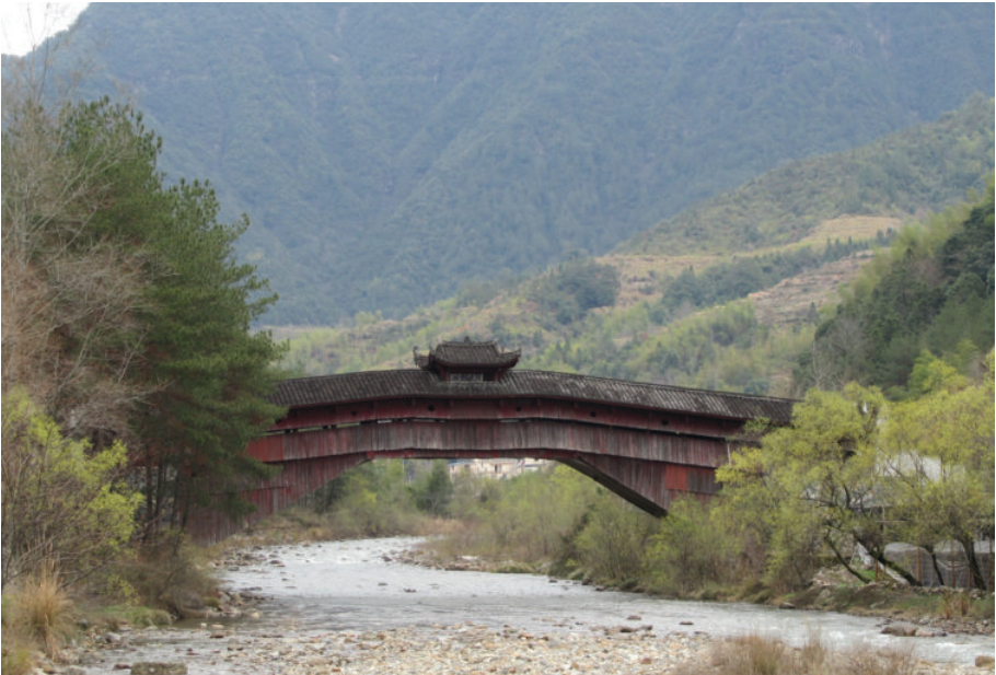
廊桥——兰溪桥,2015年,王文胜摄