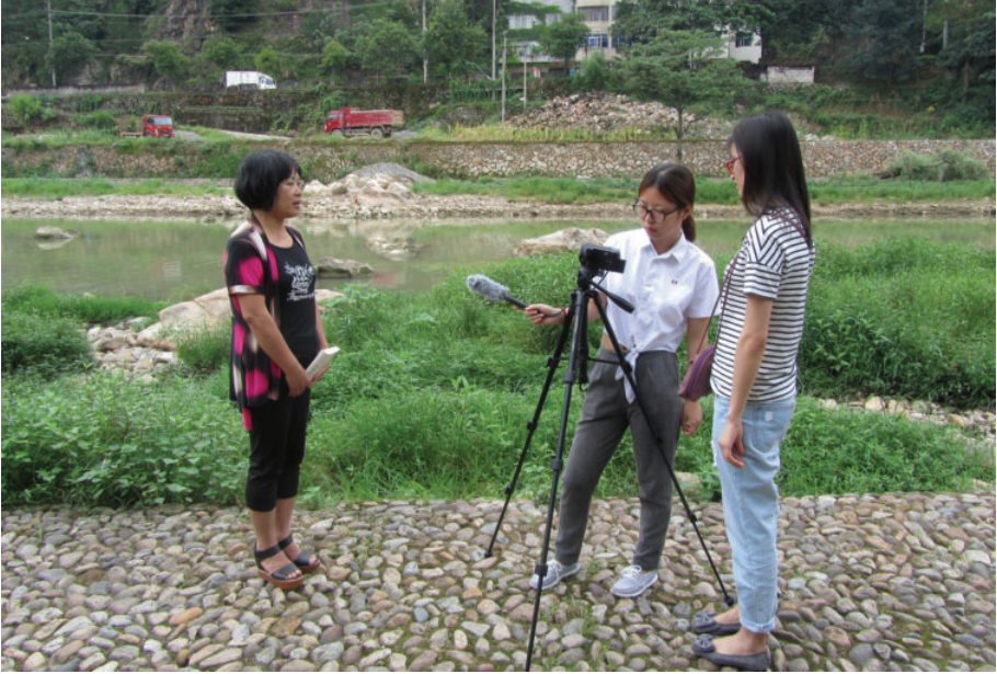
室外摄录现场——松源溪边“讲古董”，2016年