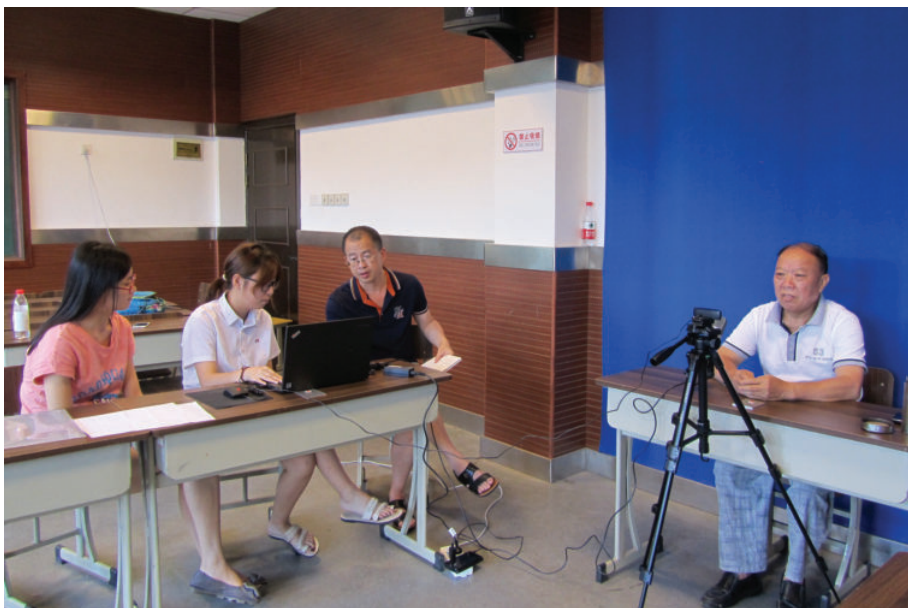
室内摄录现场——话语讲述,2016年