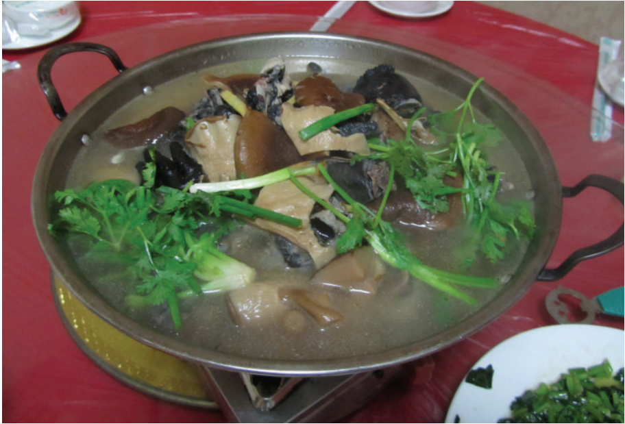
炖香菇,2016年