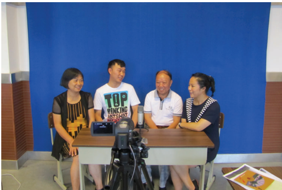
室内摄录现场——多人对话,2016年,王文胜摄