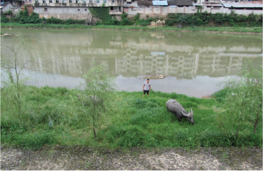
松源溪边的牛郎和他的老牛,2016年