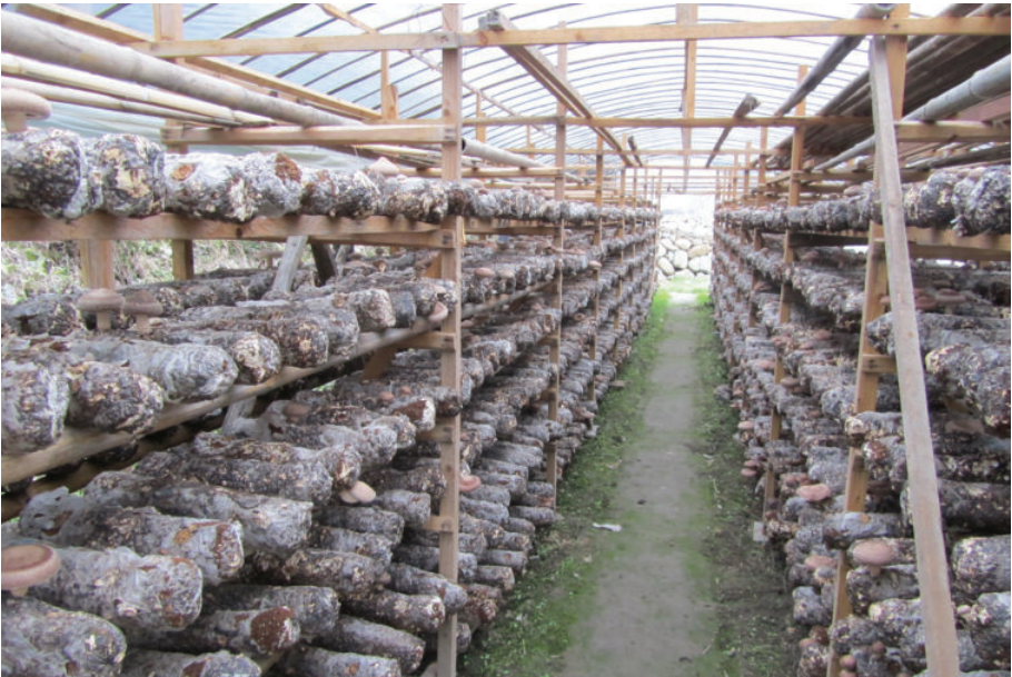
香菇棚, 2015年