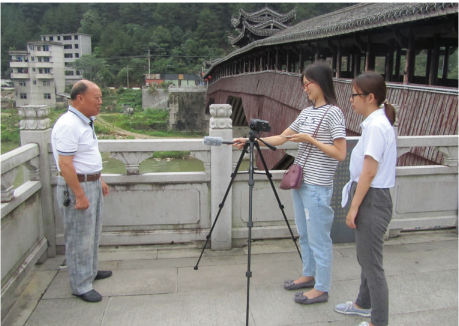
室外摄录现场——濠洲桥边来段顺口溜，2016年