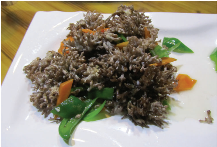
形状怪异的食用菌——老鼠牙,2016年