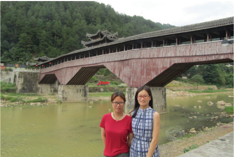
濠洲桥边美一美,2016年