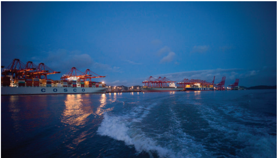
宁波北仑港,2013年