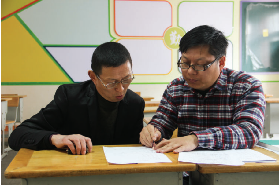
调查现场,2016年