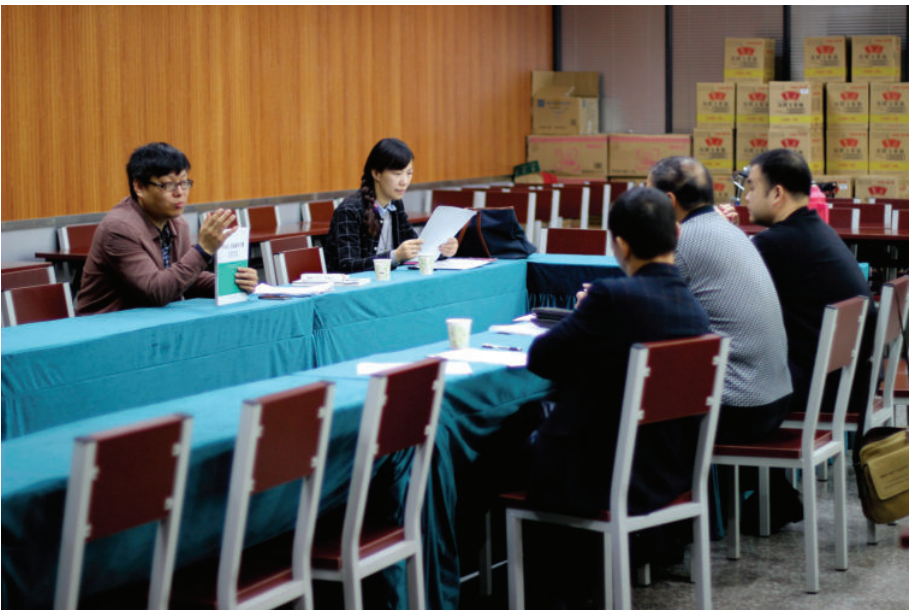
测试现场,2016年