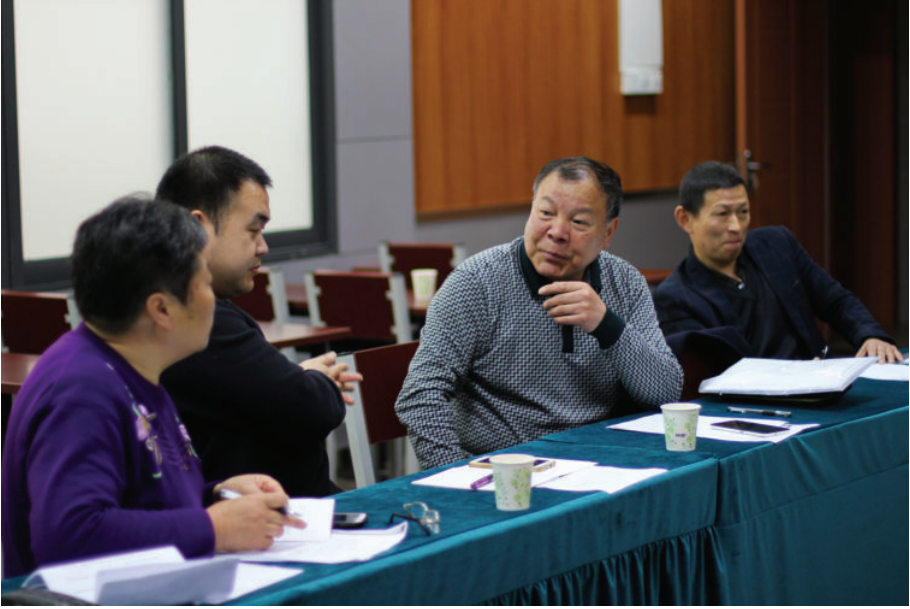
四位方言发音人,2016年