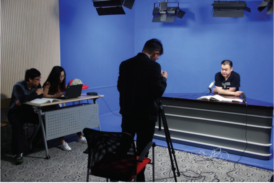
摄录现场,2016年