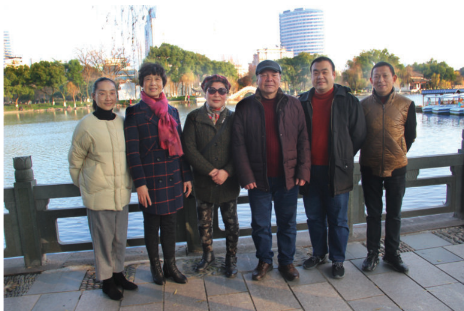
宁波城区方言发音人合影,2019年