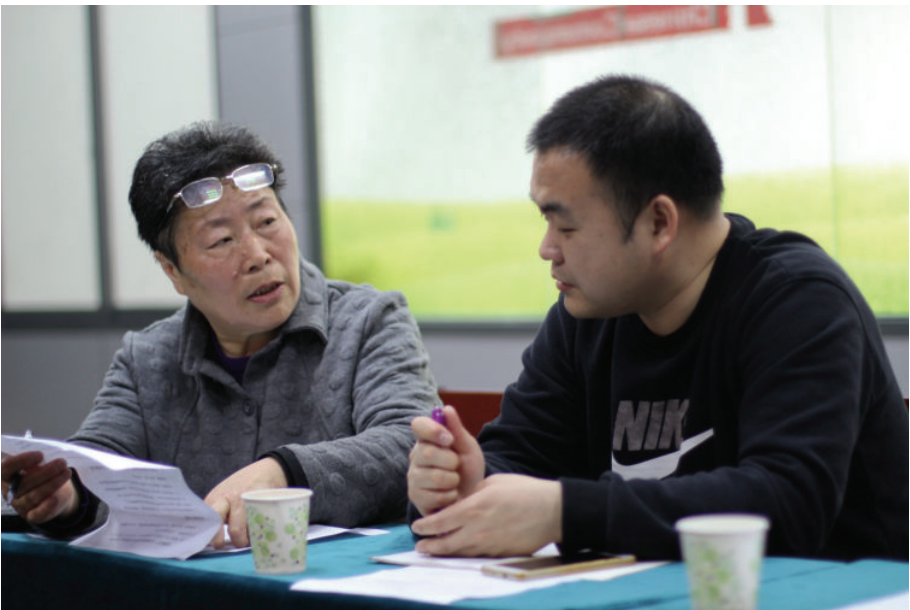
宁波方言老女发音人与方言青男发音人,2016年