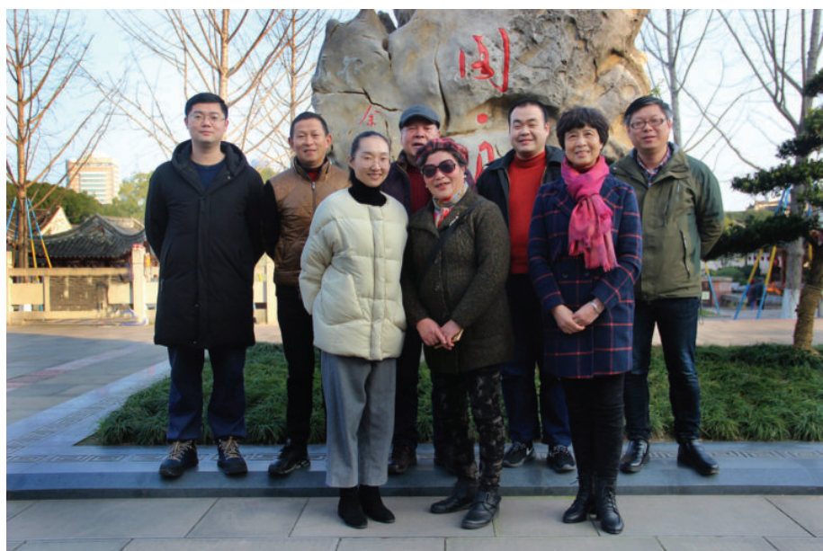
本书作者与发音人合影,2019年