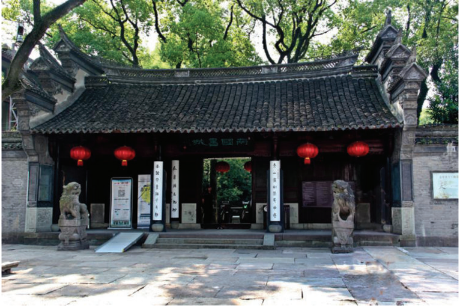
宁波天一阁,2019年