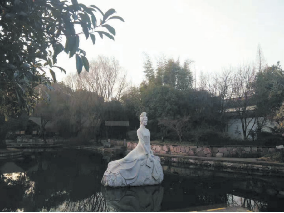
诸暨西施故里,2016年