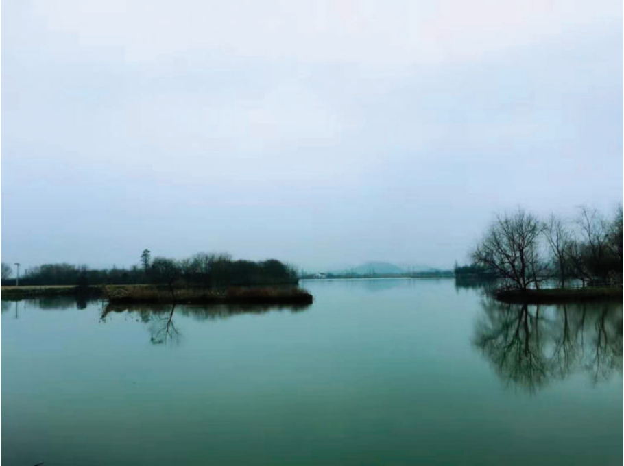
诸暨白塔湖,2016年