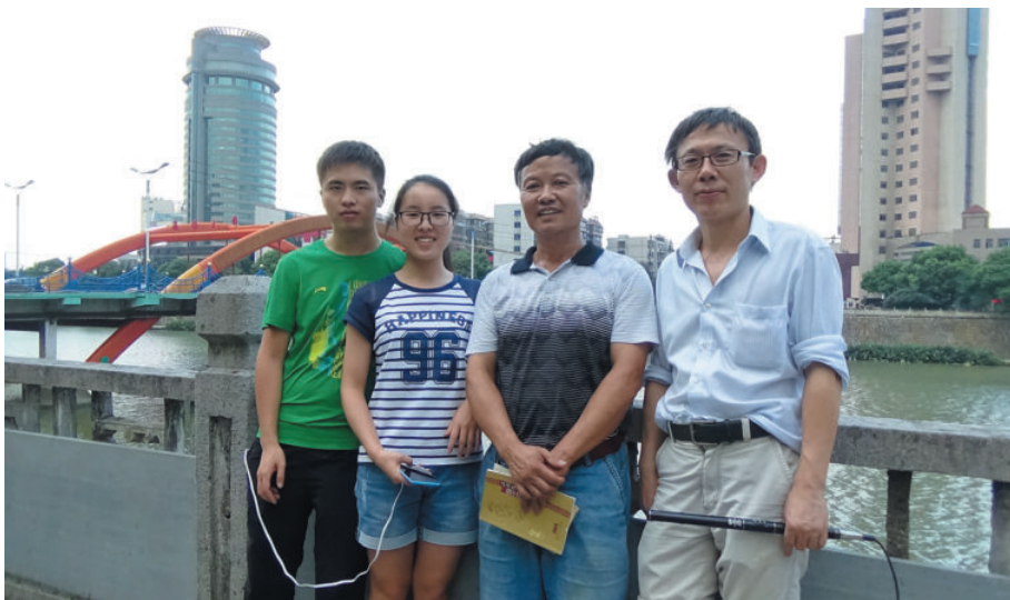
诸暨工作场景之二(诸暨西施大桥),2016年