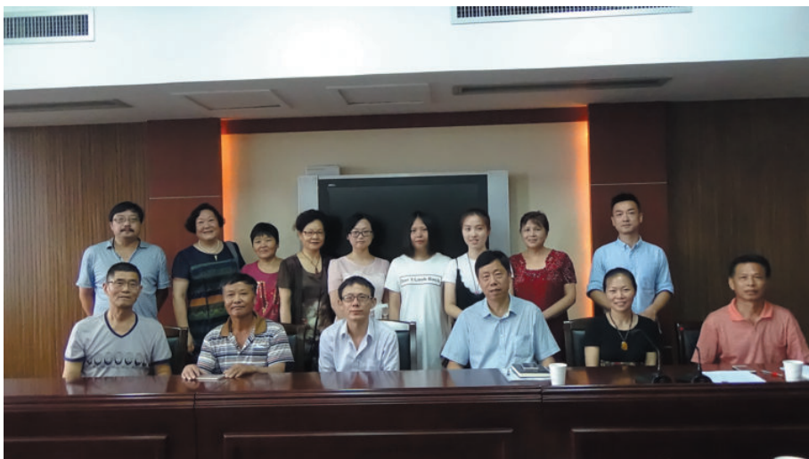
诸暨工作场景之三(诸暨教育局会议室),2016年,程平姬摄