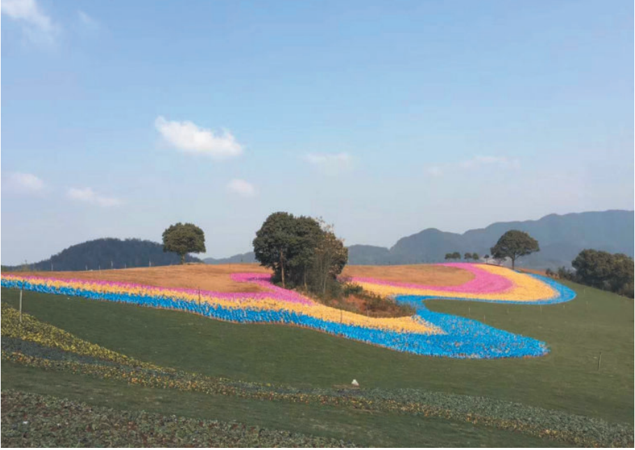
诸暨十里坪,2016年,陈杨积摄