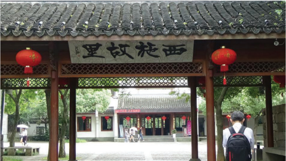
诸暨西施故里, 2016年