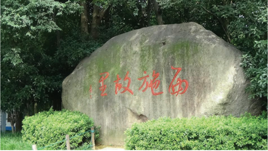
诸暨西施故里, 2016年