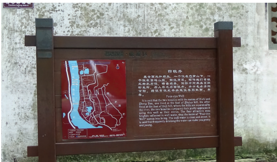
诸暨西施故里, 2016年