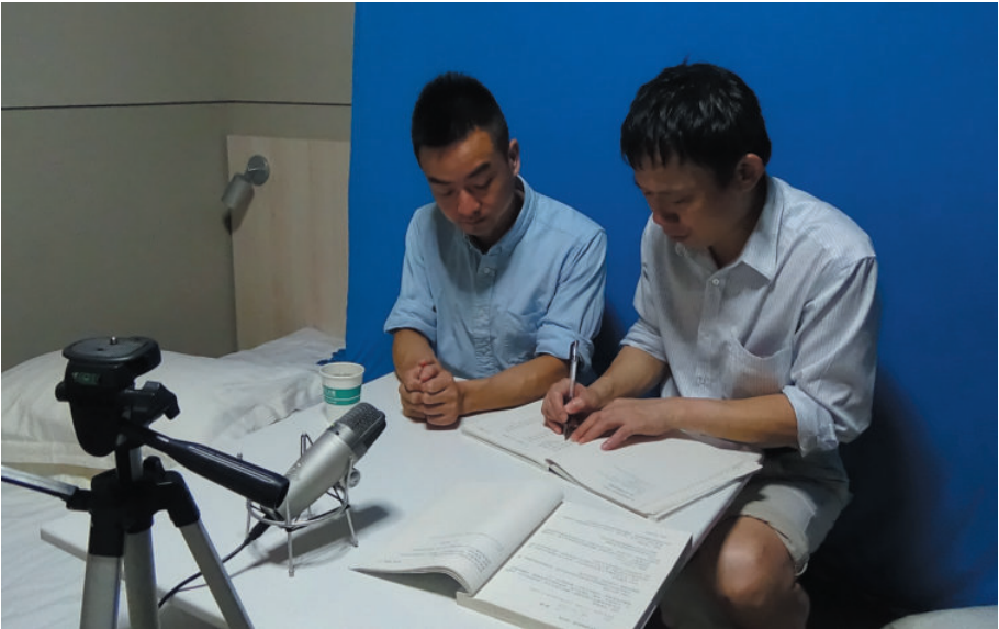
诸暨调查工作场景之一(诸暨锦星酒店),2016年