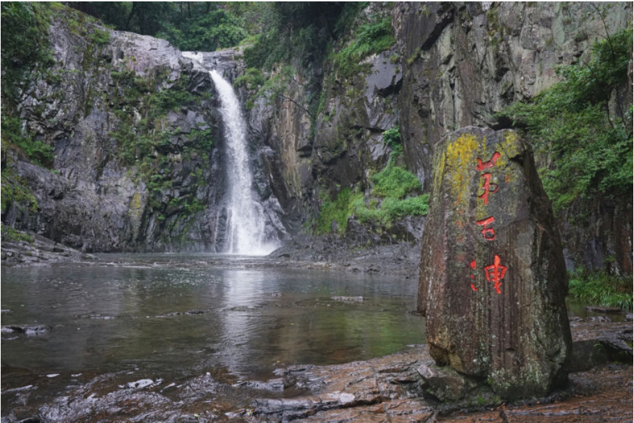
诸暨五泄风景区,2018年