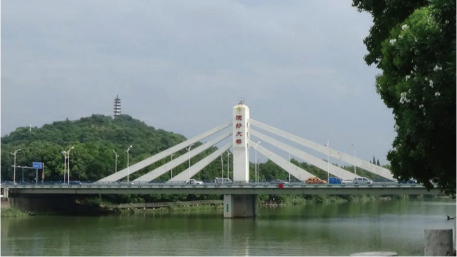
诸暨浣纱大桥,2016年