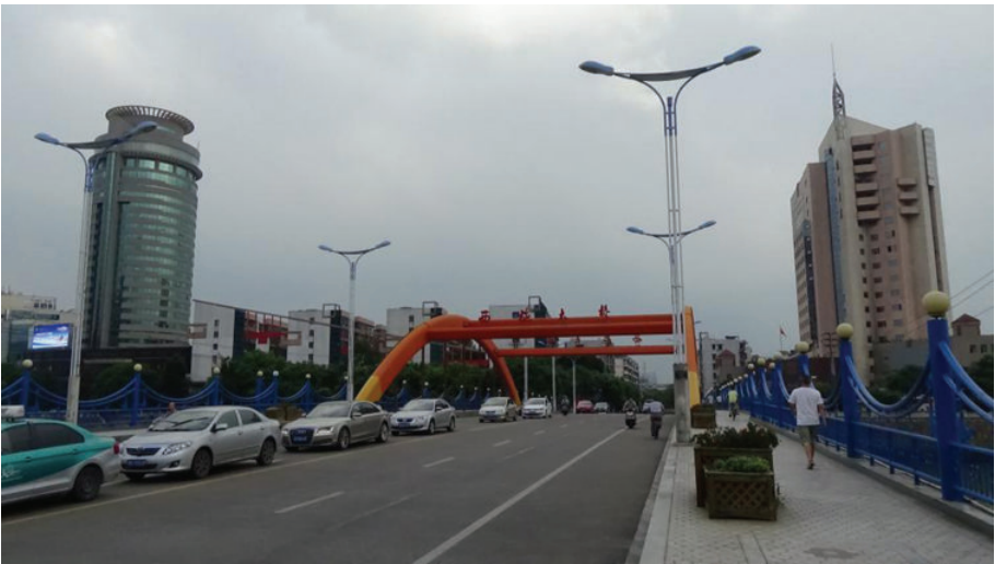
诸暨西施大桥,2016年