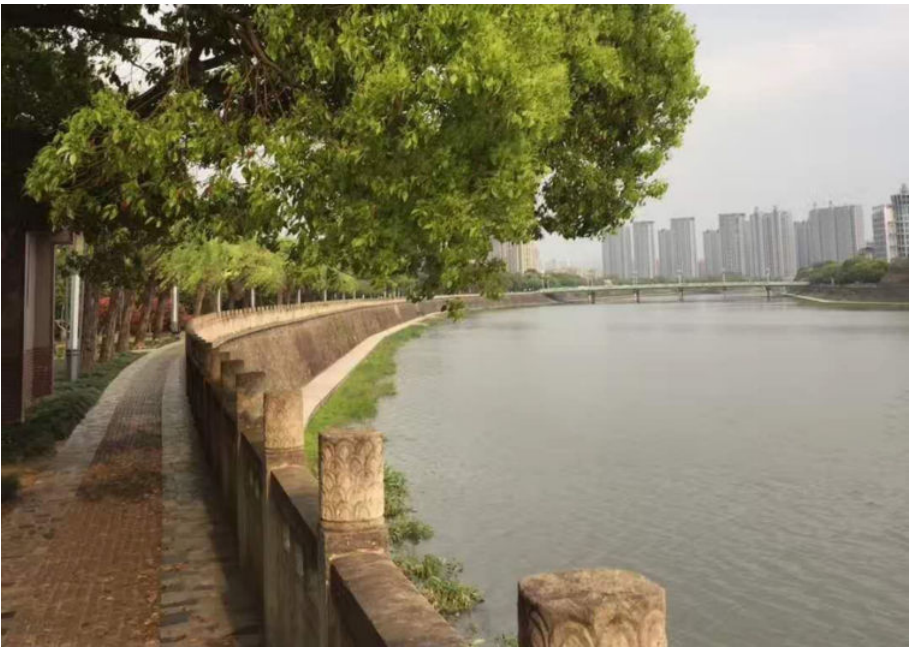
诸暨永昌桥,2016年