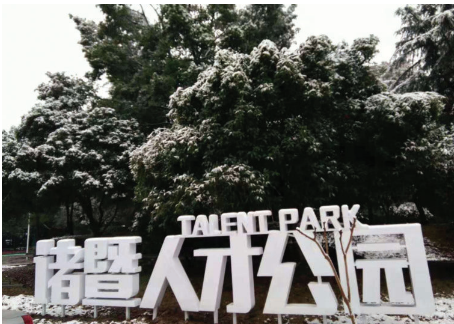
诸暨人才公园,2016年