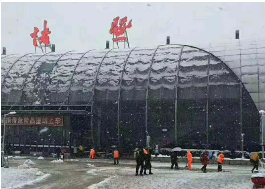
诸暨火车站,2016年