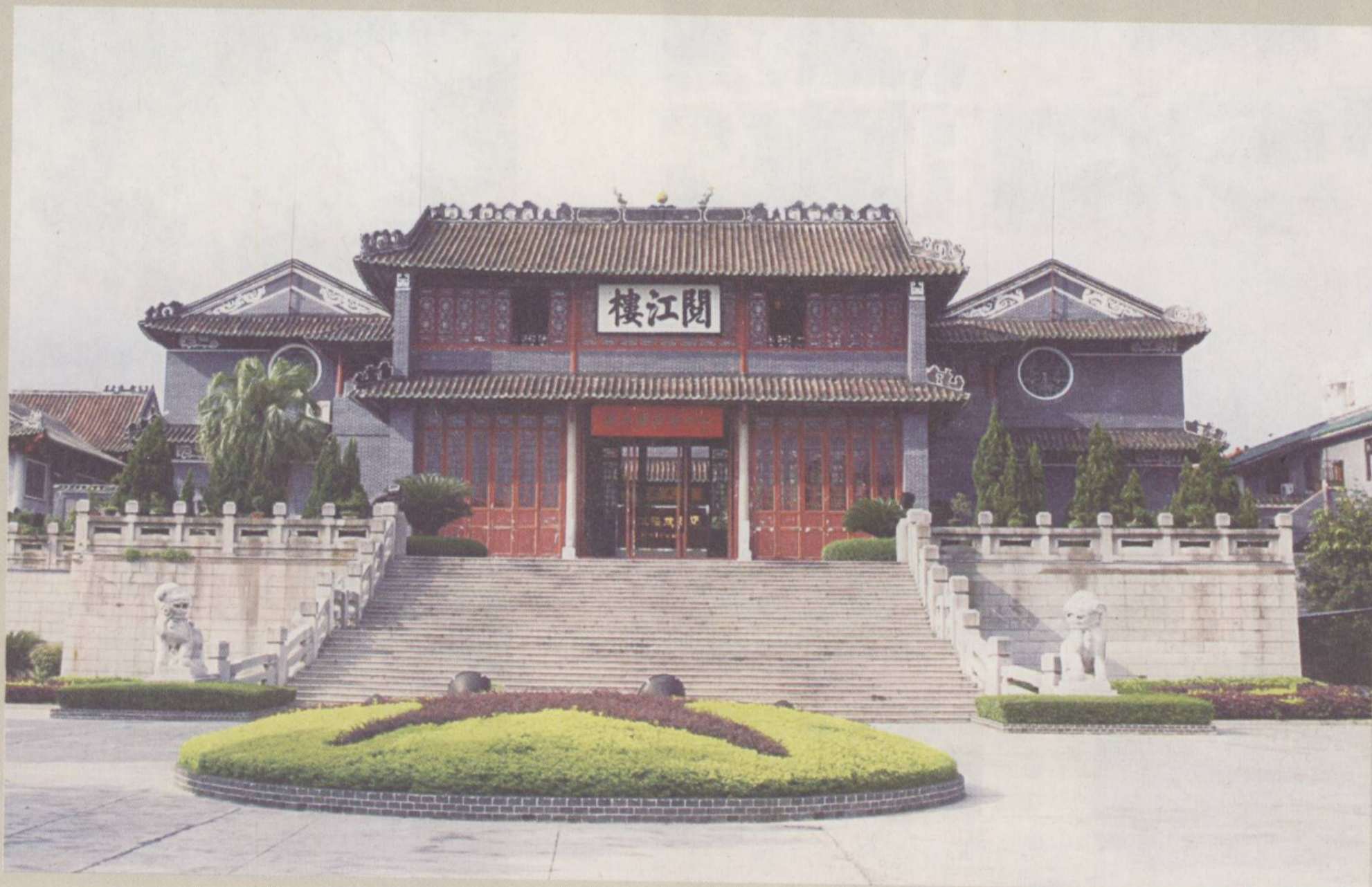
□明 阅江楼（叶挺独立团团部旧址纪念馆）