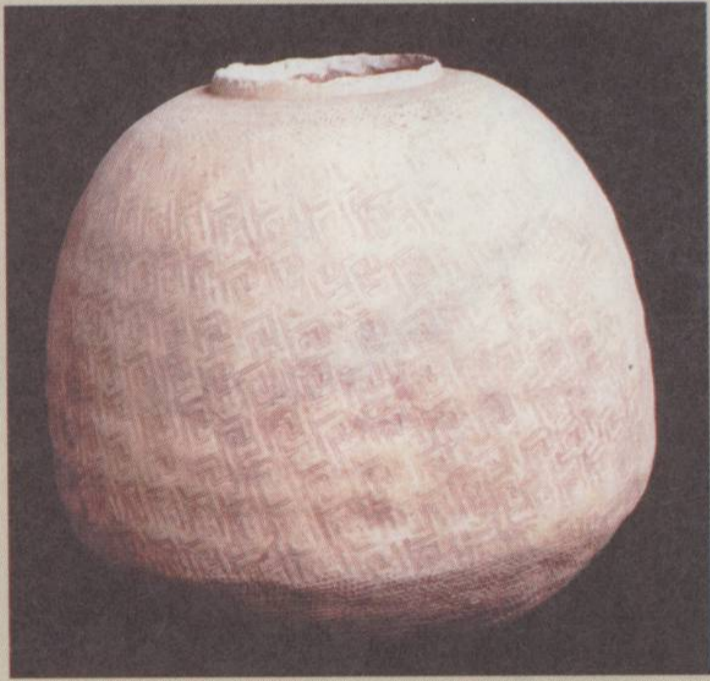
□春秋 云雷纹圆底陶罐