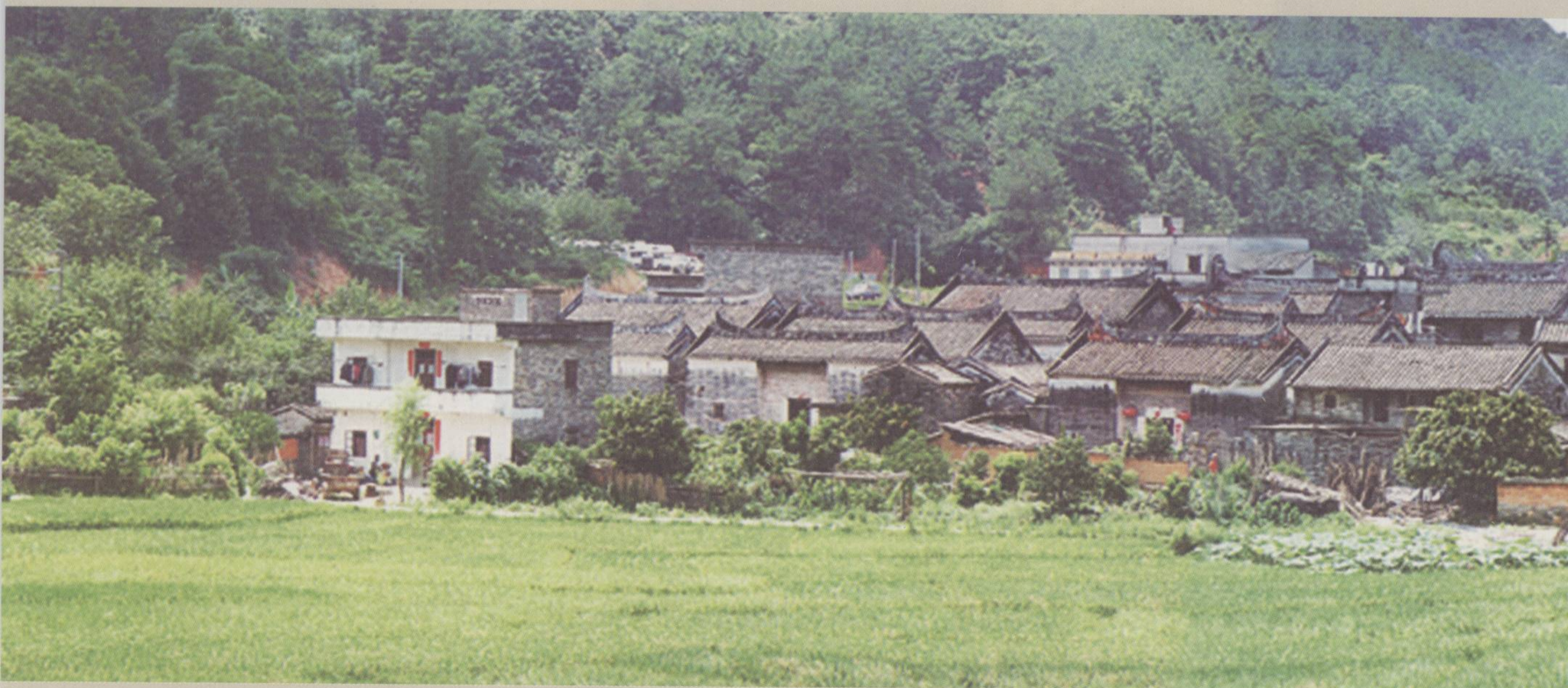
□清 封开杨池古村落