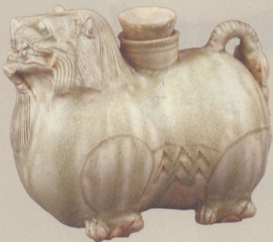
□东晋 青瓷狮形水注