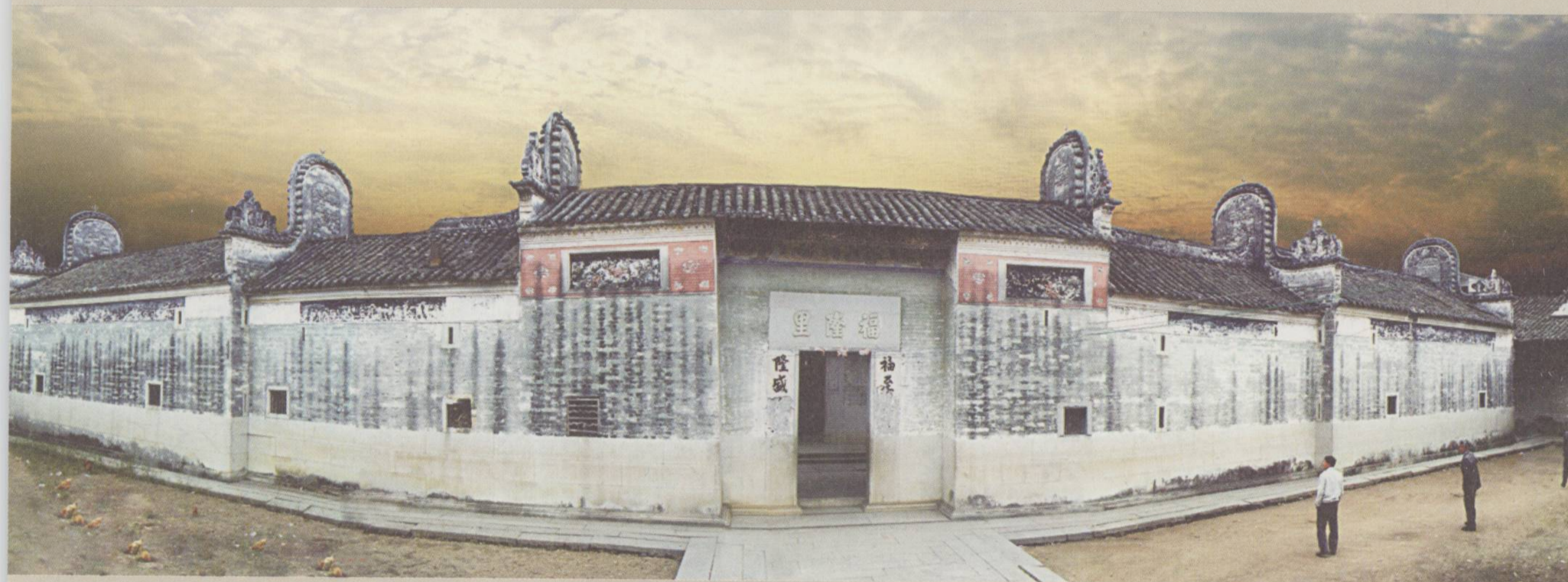
□清 广宁江屯福隆里客家大屋