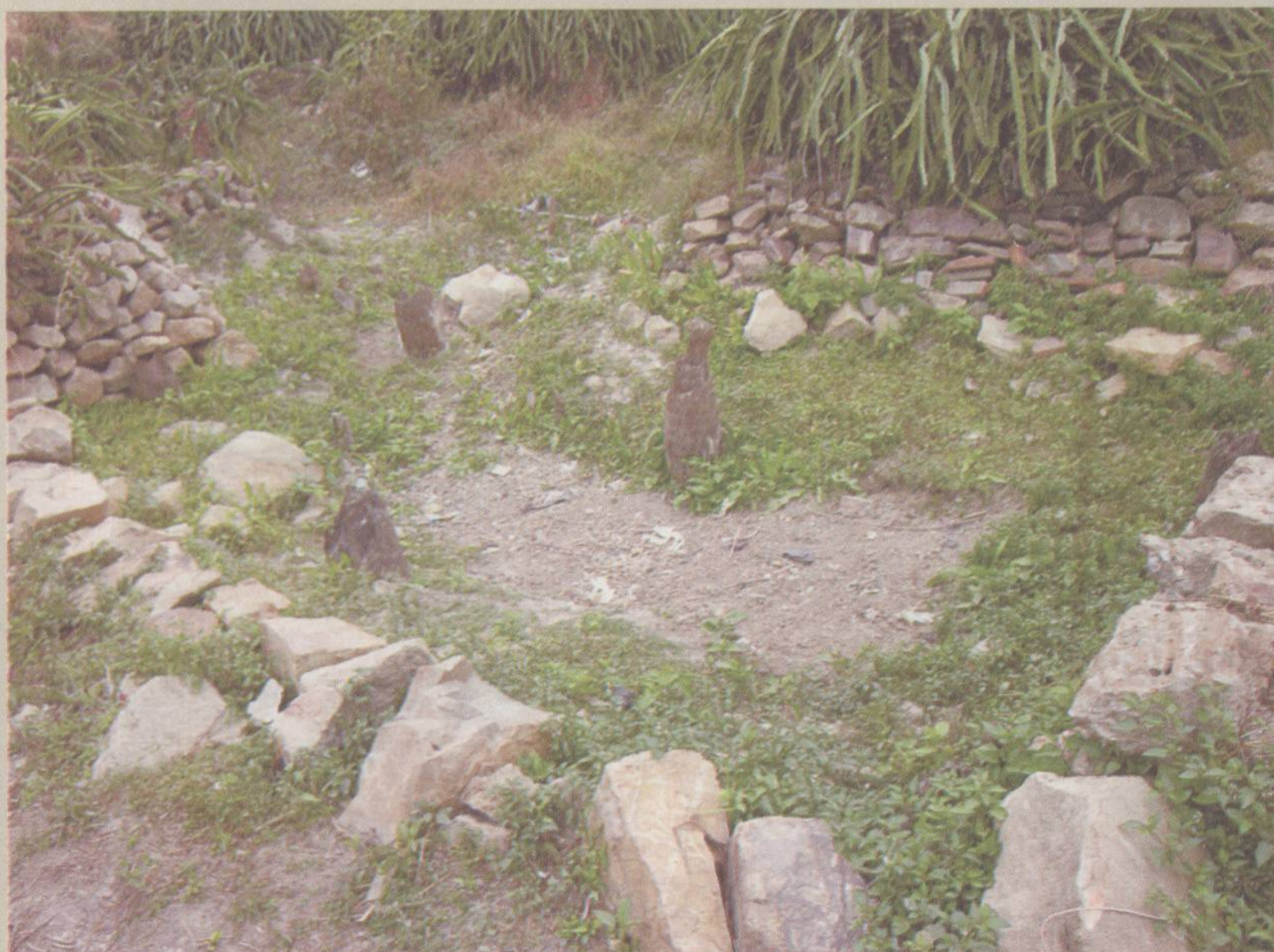
□ 新石器晚期 茅岗水上木构建筑遗址