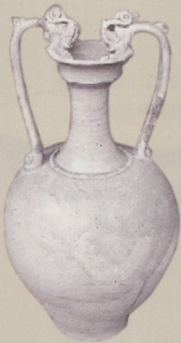
□唐 青白釉双龙耳盘口瓶