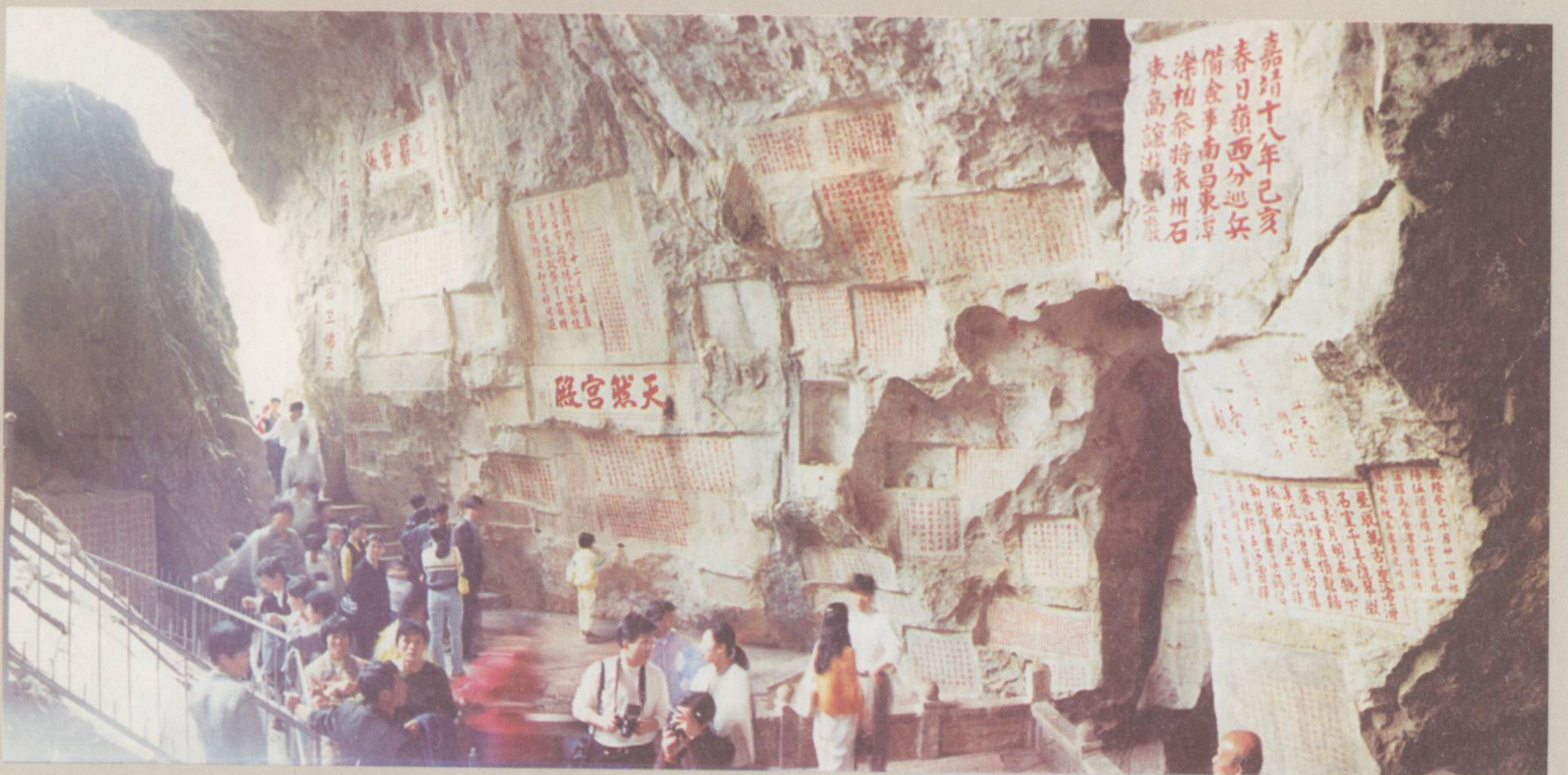
□唐~现代 七星岩摩崖石刻