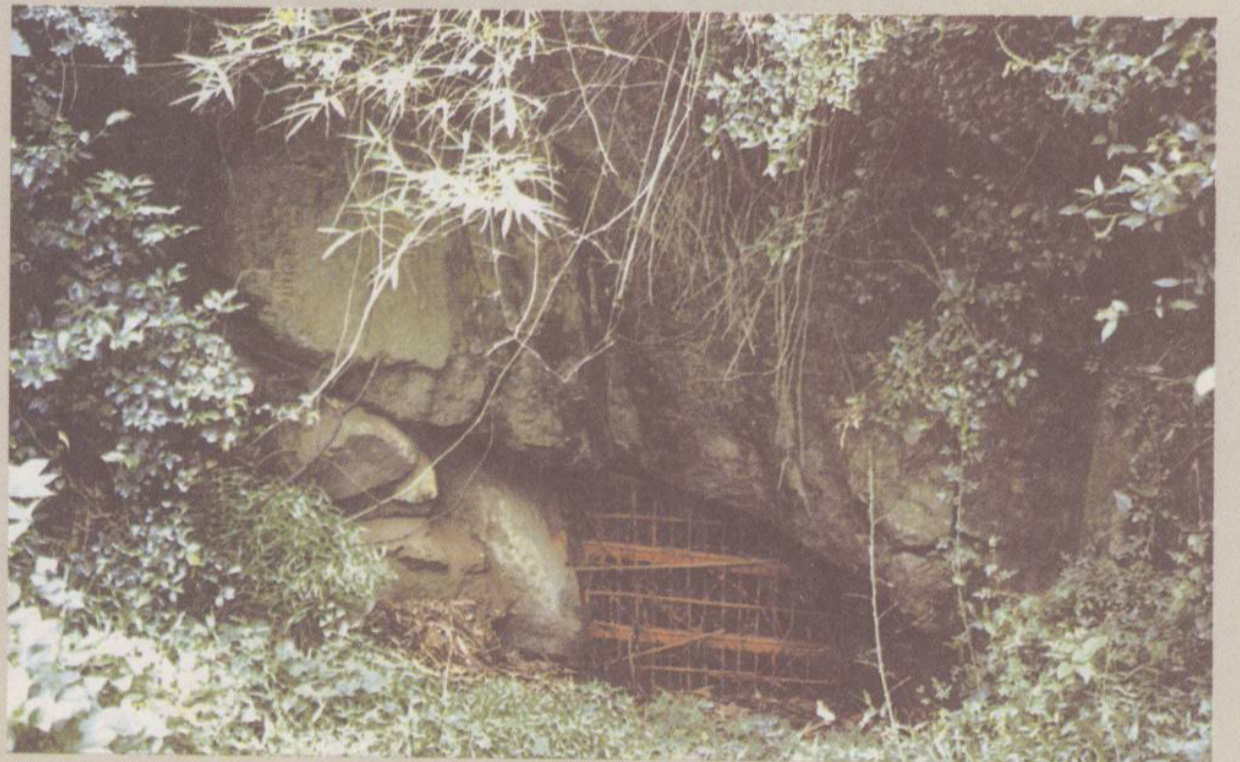
□唐 端溪老坑洞遗址