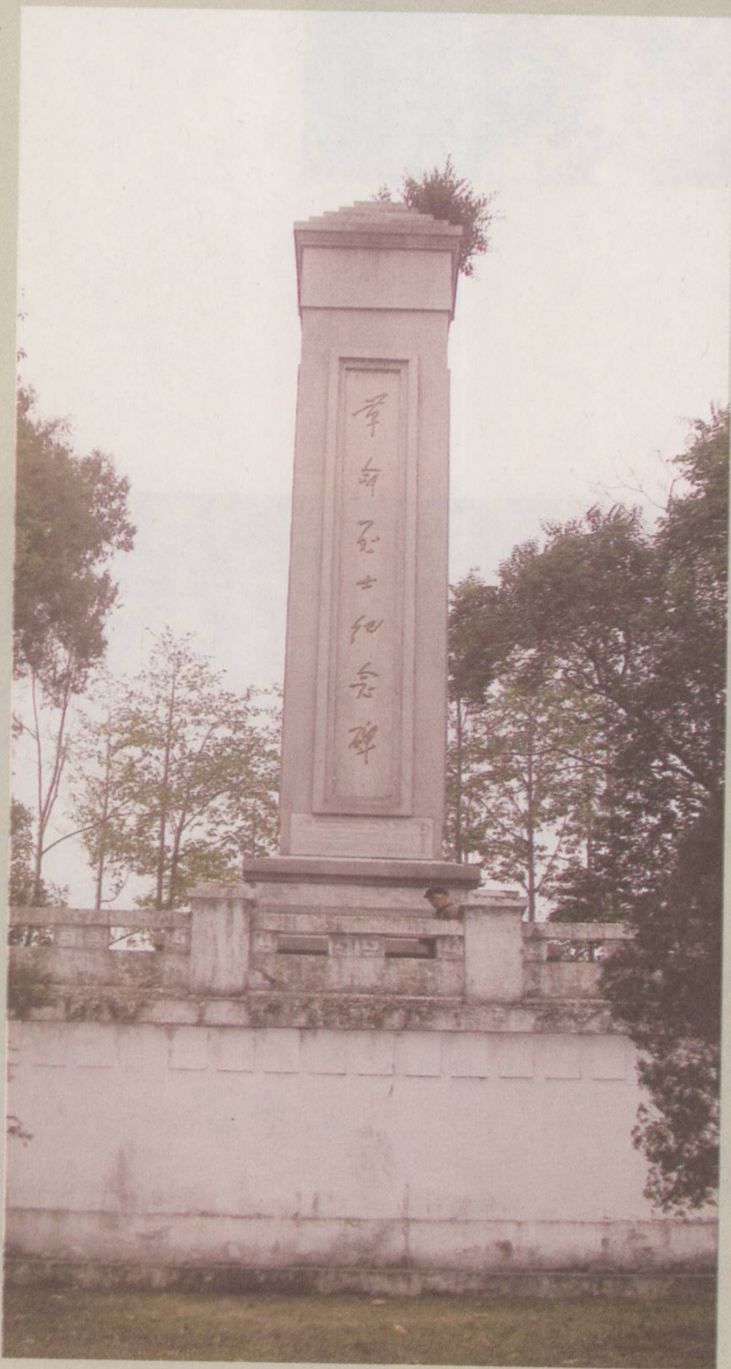
□现代 广宁县城革命烈士纪念碑