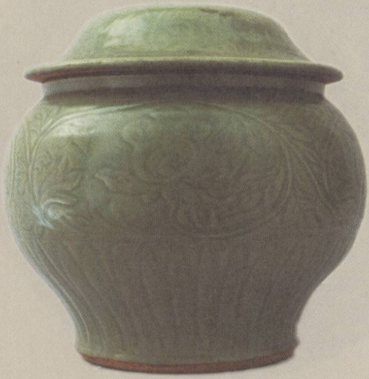
元 龙泉缠枝牡丹纹盖罐