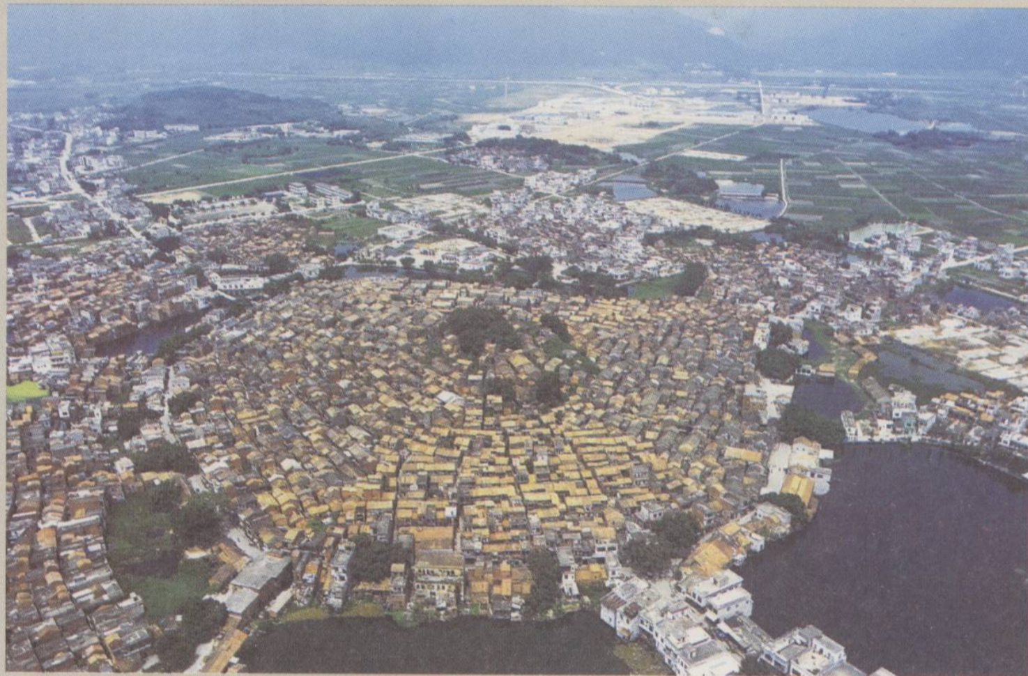
□元 高要蚬岗古村落