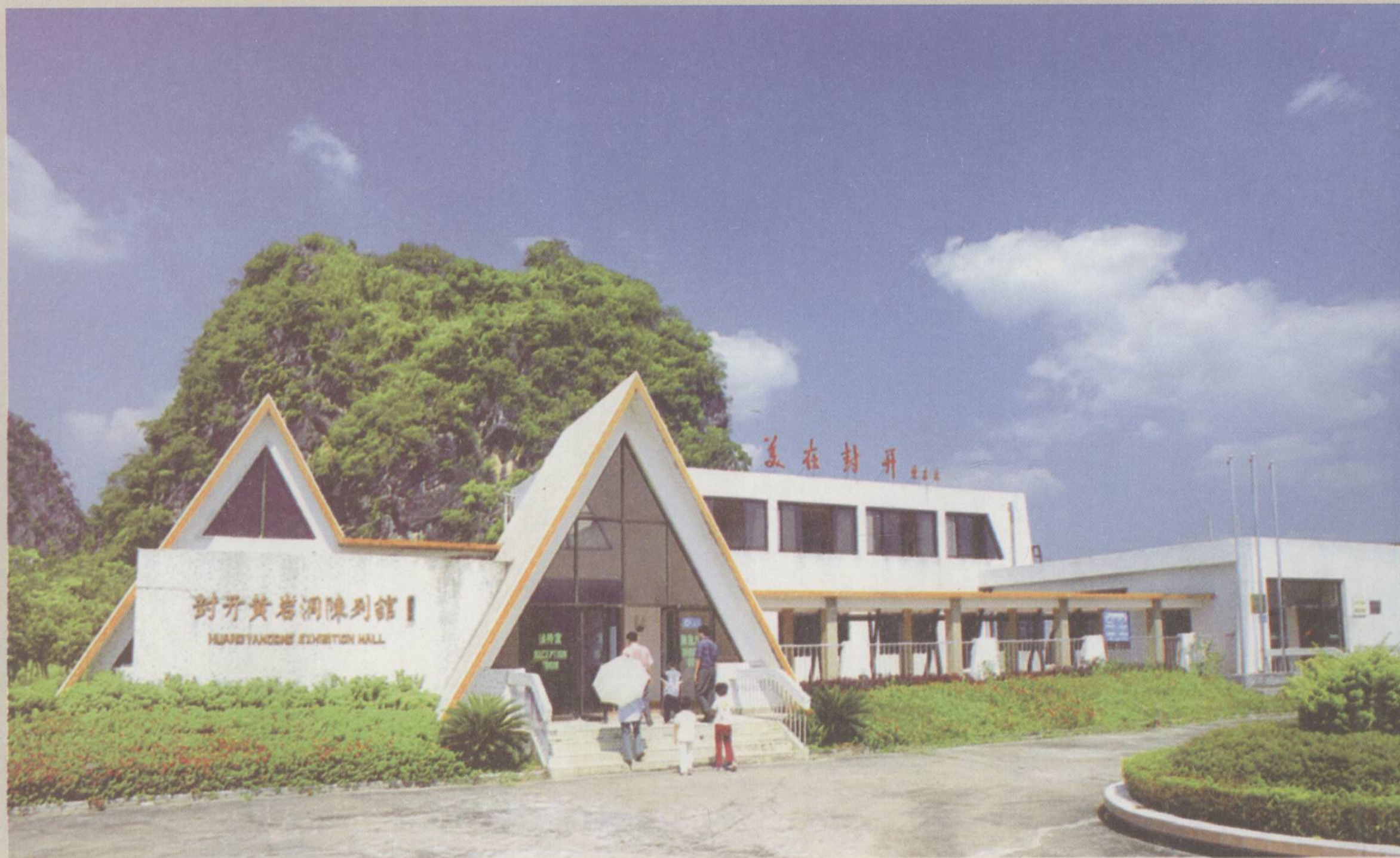
□ 旧石器晚期~新石器早期 黄岩洞遗址 (位于陈列馆后面)