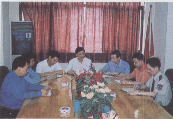
▲ 交通局领导班子集体研究工作。