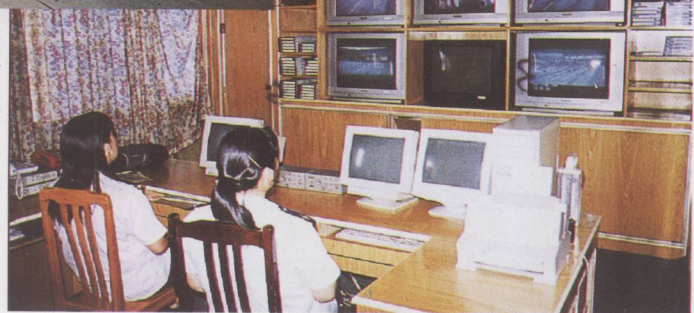
▶ 收费站电脑监控室。