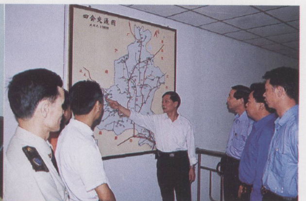
▲ 领导班子民主决策发展交通事业。