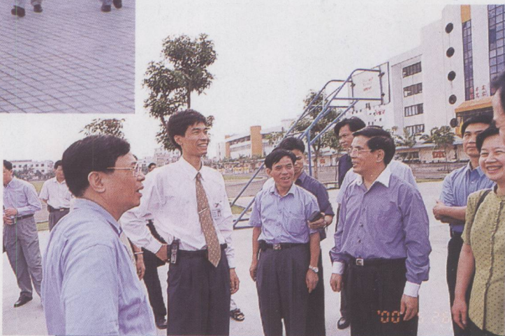
► 省委常委、副省长卢钟鹤（前左四）在四会华侨中学调研。