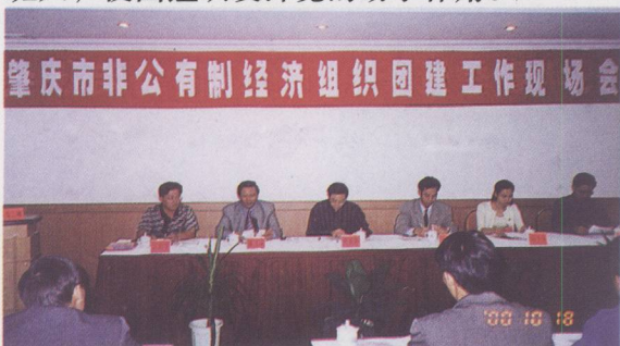
肇庆市建团工作现场会