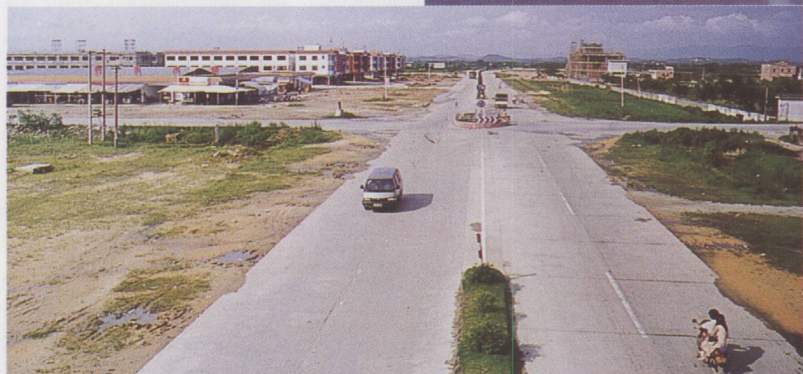
▲ 连大线与四清线交汇点。