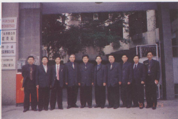
▲ 建设局及系统党委领导成员。

现有办公大楼。 四会市建设局是四会市政府对城镇规划建设管理的综合主管部门。其主要职能是：研究城镇规划建设管理以及建筑业、房地产业等的发展战略和中长期规划；组织城镇总体规划的编制和实施管理；组织和推动城镇建设及房地产开发管理的改革与发展；培育和引导建设市场的发展，规范市场行为；对城镇规划、建设、建筑、设计、施工、房地产业的管理与审批。局内设7个职能科（室）。近几年来，在市委、市政府的领导下，职能明确，权责清晰，分工合理，两个文明建设取得优异的成绩。编制《城市总体规划方案》，建成四会人民广场、江滨堤园等重大民心工程和贞山旅游区、荔枝湾度假村以及商业广场、中山公园、槎山公园等休闲娱乐场所，构成四会风景旅游城市的基本框架。四会市总体建设通过了“南粤杯”达标验收和“岭南杯”近期达标验收，城乡一体化建设取得进展。