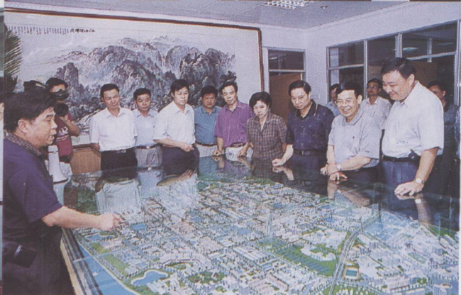
▲ 副省长许德立（右三）在四会南江工业园调研。