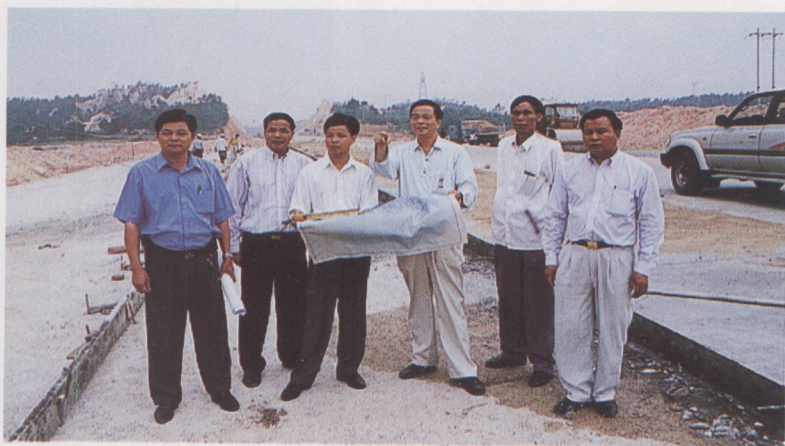
▲ 领导班子深入建设工地进行现场调查。