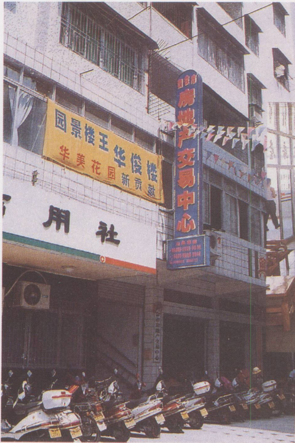
▲ 位于水闸路的房地产交易中心。