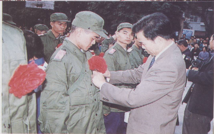
▲ 四会市委、市政府重视每年的征兵工作，市委书记龙红辉为新兵戴红花。