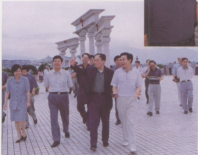
◀ 省委常委、常务副省长王岐山（前右二）在四会调研。