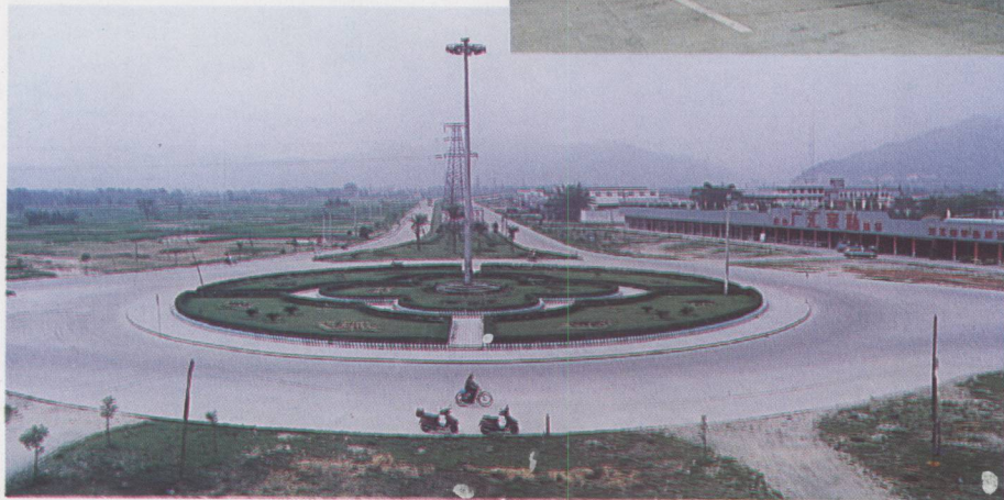
◀ 莲四公路贞山环岛处。