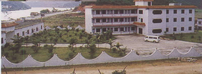
▲ 环境优美的基层单位。