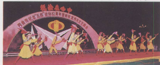
组织纪念“五四”运动文艺晚会。