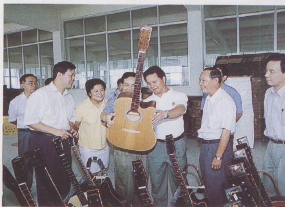
▲ 副省长汤炳权（右三）在四会华声乐器厂调研。