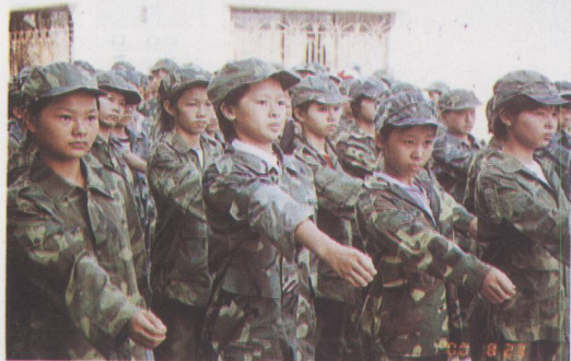
◀ 人武部积极开展国防教育，定期到学校进行军训。