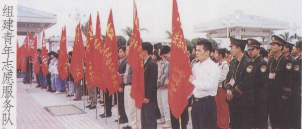
组建青年志愿服务队。