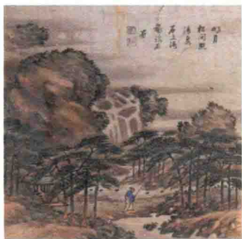
明月松间照，清泉石上流。杨瑞石画。