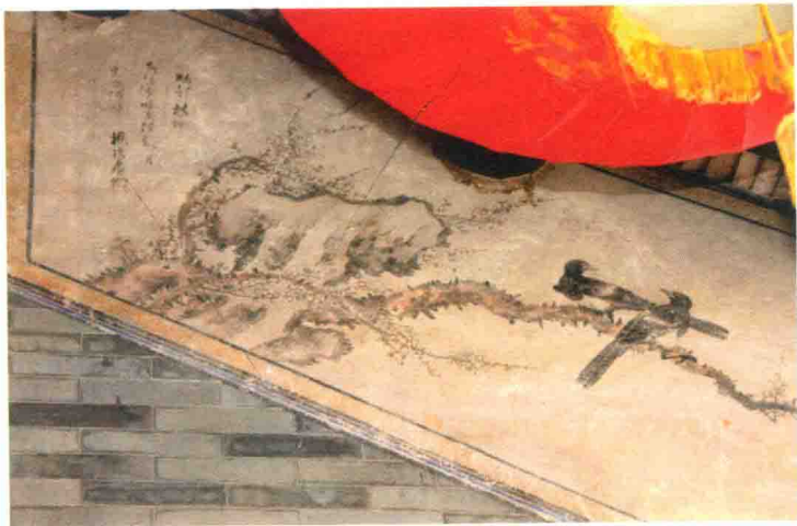
疏影横斜水清浅，暗香浮动月黄昏。偶作。杨瑞石书。

诗是高启所作后，他大为赞赏，不仅重新书录了全诗，而且在诗前注：“高启，字季迪，明朝最伟大的诗人。梅花九首之一。”在“伟大”下面，他还重重划了一道横线以示强调。” ① 毛泽东想到的这首诗是明初诗人高启《梅花九首》的第一首，共八句，后四句是：“寒依疏影萧萧竹，春掩残香漠漠苔。自去何郎无好咏，东风愁寂几回开。”要说明的是，高启的这首诗也是清代广府壁画上常见的题款。