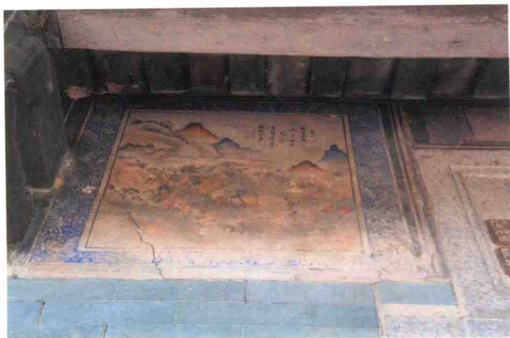
远观山有色，近听水无声。偶书。青萝峰居士韩柱石。