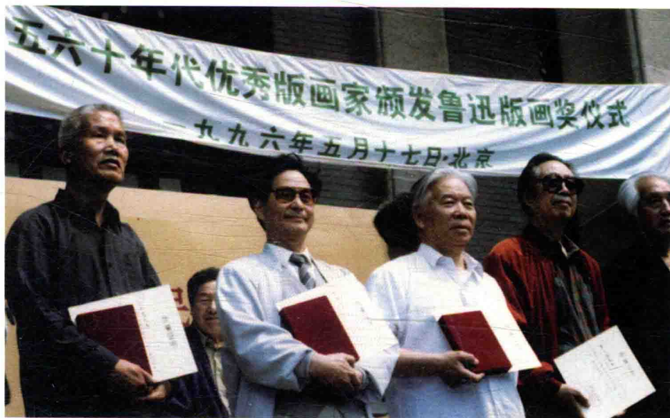
在全国优秀版画家鲁迅版画奖领奖大会上。