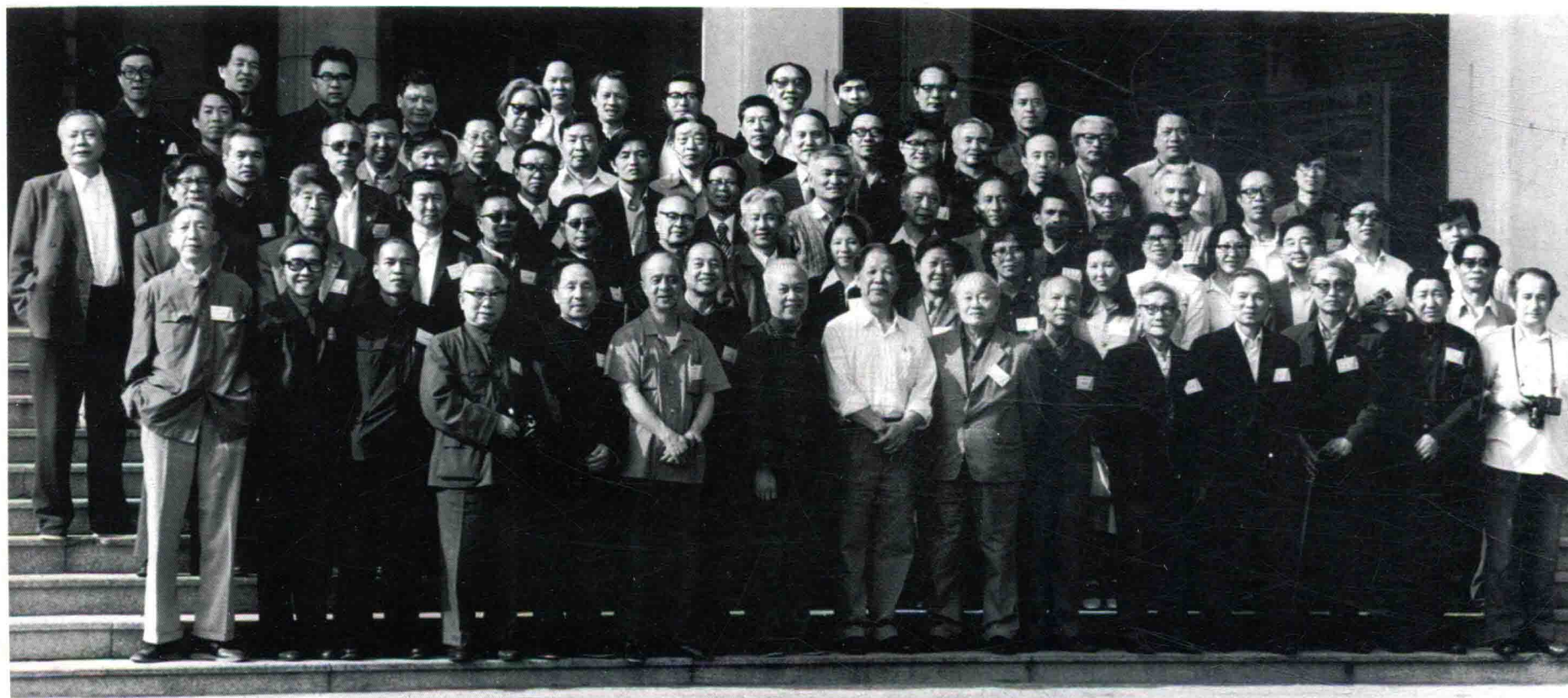
第四届全国美代会上版画界同仁合影