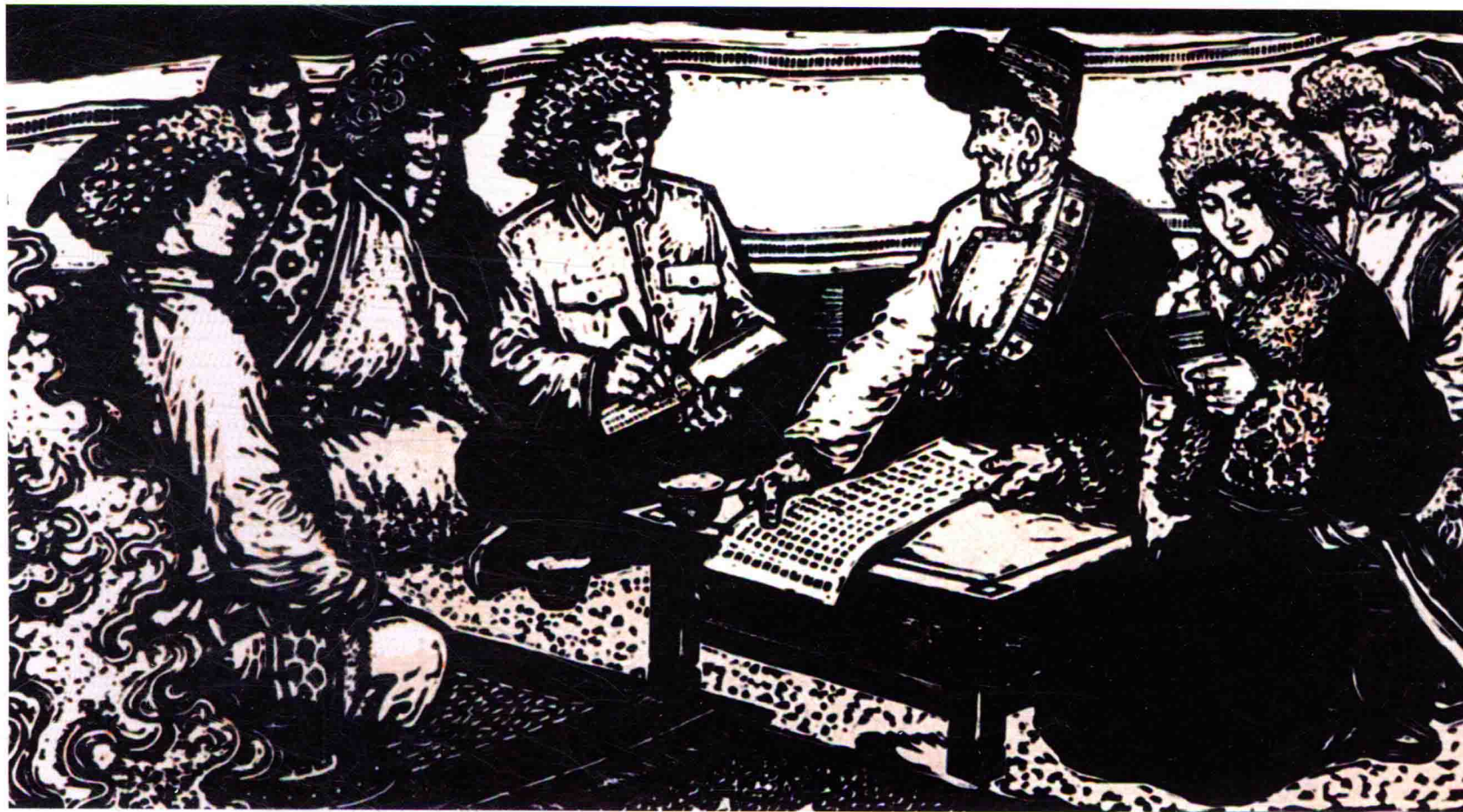
幸福远景今日绘 套色木刻 1963年 1964年参加《第五届全国版画展览》，神州版画博物馆收藏