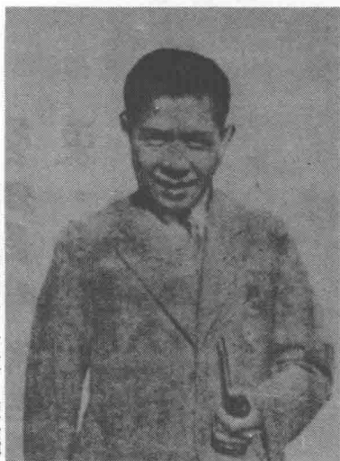
中國共產黨創始人之一——陳公博