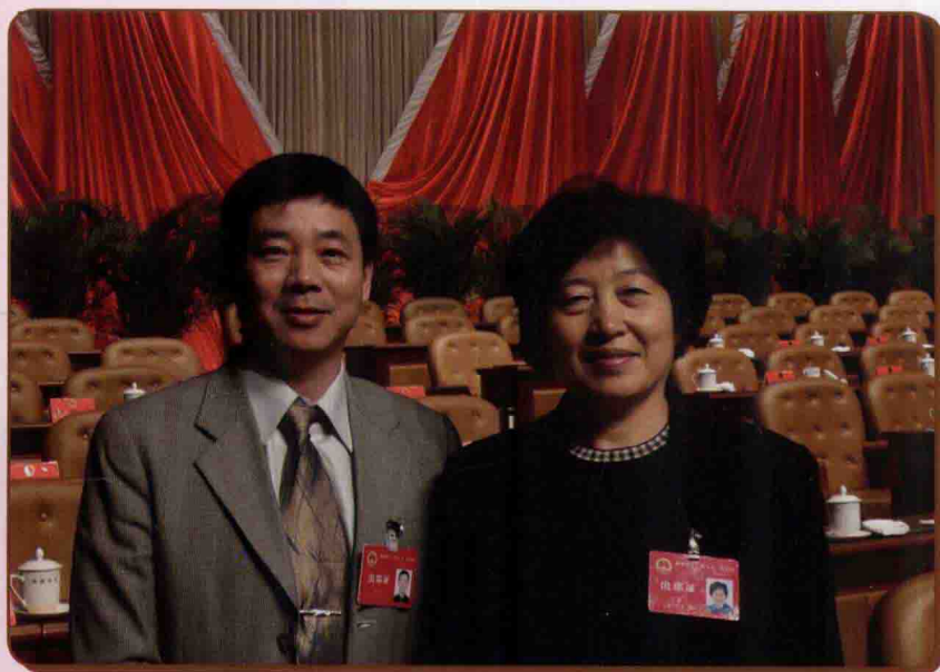
时任福建省委书记 孙春兰接见区侨联 副主席颜达成