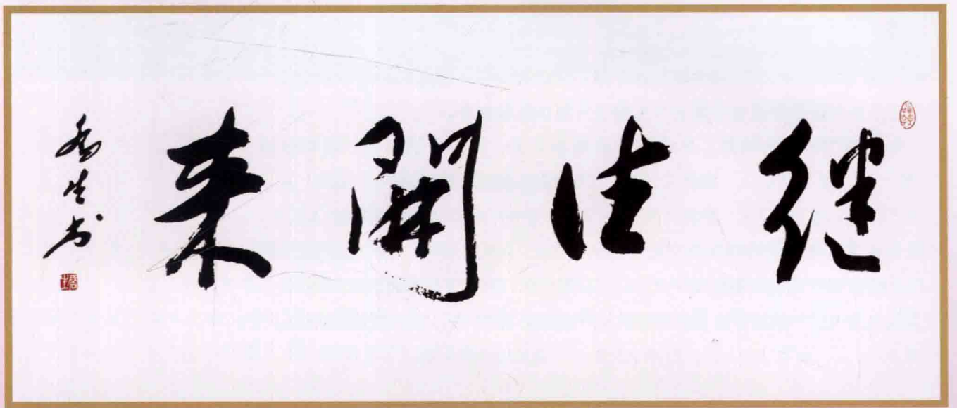
思明区区长 黄乔生