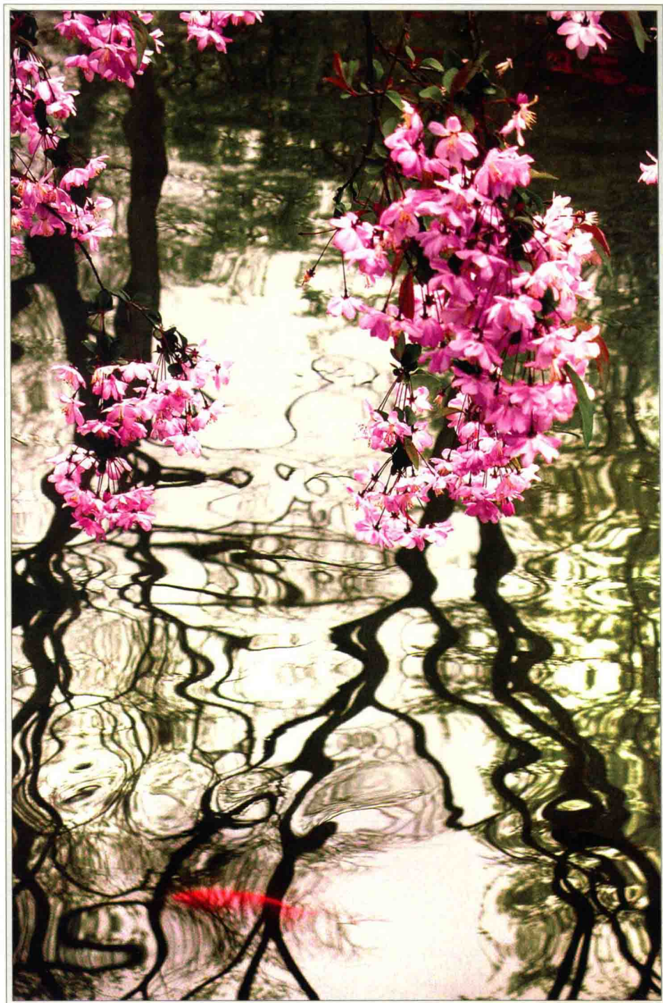
疏影横斜水清浅 海棠依旧