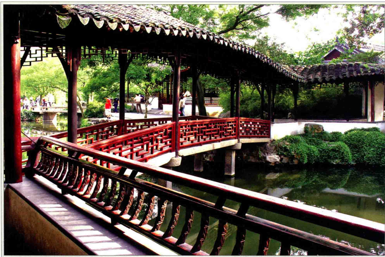
雕阑曲处 梦好难留