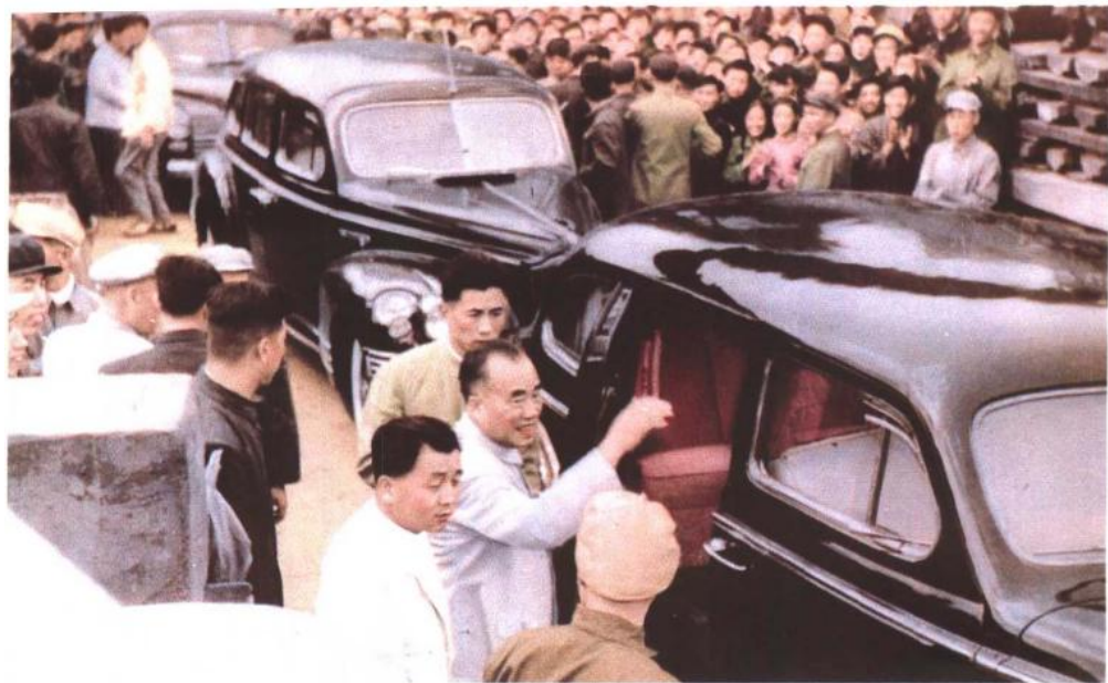
2 1958年7月，朱德委员长、董必武副主席视察沈阳重型机器厂