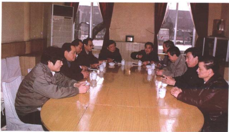
8 厂领导班子在研究如何转换企业经 营机制