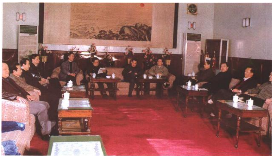
7 厂领导班子在 学习邓小平同志南 巡谈话