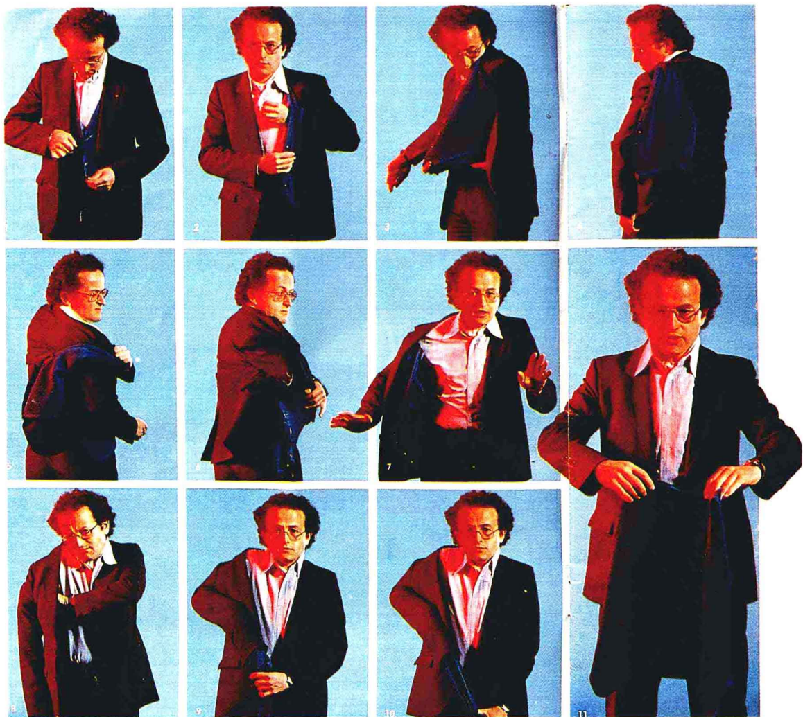
图1：解开背心的钮扣。