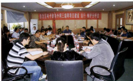
自治区电子政务外网三级网项目建设运行维护分析会