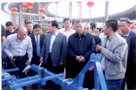
自治区副主席钱智参观第十二届新疆国际农业机械博览会