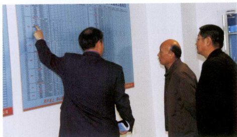
国家信息中心常务副主任杜平检查指导工作