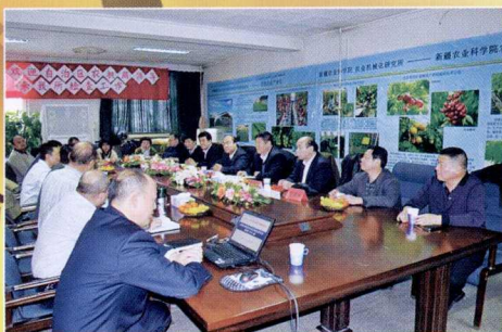
农机局领导到农机化所调研

新疆本土的农机制造企业新疆中收农牧机械公司,直属中国农业机械化科学研究院,是国内收获机械行业中具备生产和研发能力为一体的重点国有生产企业。研制生产的新疆-2.5牵引式联合收割机曾获国家颁发的银质奖,新疆-2收割机代表农机行业参加建国50周年庆典成就展。公司拥有自治区级企业技术中心,各类机械加工设备1200多台,检测设备250台(套),通过了ISO10012计量确认,取得了ISO9001、14001、28001,质量、环境、职业健康安全管理体系证书。经过多年的自主研发,小麦收获机械产品中有5项专利,玉米收获机械产品中有2项专利,棉花和辣椒的采摘、输送机械中有3项专利,在经济作物蓖麻、核桃的收获和加工方面有3项专利,其他农牧产品的储藏和输送方面有3项专利。