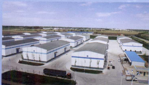
目前,全区地方国有粮食购销企业总仓容达到465万吨,有效仓容366万吨。图为现代化的粮库为我区储粮安全奠定基础。

国以民为本,民以食为天。新疆远离内地,是一个相对独立的经济区,粮食问题不能依赖进口,也不能依赖区外市场,必须立足区内保证自给有余。长期以来,自治区坚持“区内平衡,略有结余”的粮食工作方针,实施了一系列扶持粮食生产的政策措施,有效调动了农民种粮和各地抓粮的积极性,全区粮食生产连续4年实现大丰收,总产突破千万吨,收购量超过400万吨,为确保我区粮食安全和农民增收奠定了坚实基础。