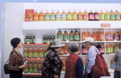
目前,全区“放心粮油”销售店已达582个,不断满足城乡居民消费需求,保障粮油质量安全。图为放心粮油产品进万家。

站在新的起点上,全区粮食系统将紧紧抓住新疆大建设、大开发、大发展的重大历史性机遇,坚持“夯实基础、强化创新、拓展领域、壮大实力”的发展思路,重点推进粮食仓储、现代物流、粮食市场、产业发展、军粮保障、质量监测、行政执法等“七大体系”建设,力争“十二五”末,初步建成涵盖粮食生产和粮食收购、储存、运输、加工、物流、贸易、消费等环节以及政府调控、监管、支持、引导和服务等方面的完整产业体系,实现粮食流通产业的跨越式发展,为确保新疆粮食安全和经济社会稳定发展做出新的更大贡献。