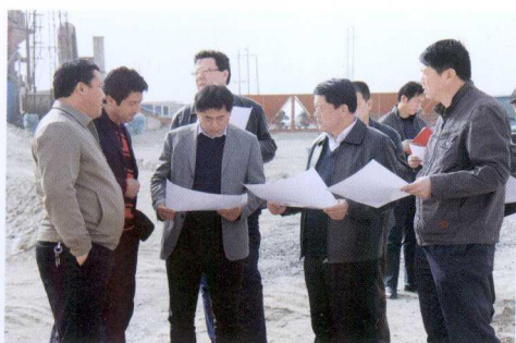
2011年,全区新建粮食仓容38.2万吨,维修改造仓容16.4万吨。图为自治区粮食局党委书记雍其新(左三)在巴州调研粮食仓储设施建设情况。