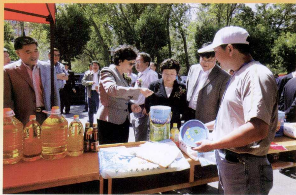
自治区副主席靳诺在科技活动周期间查看我区优质粮油产品