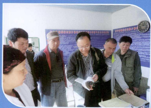
奶业办领导下基层检查指导工作