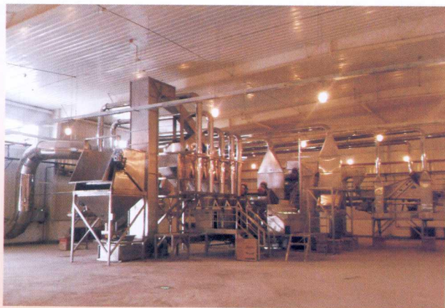
6HT-3000 型核桃破壳、壳仁分离加工成套设备