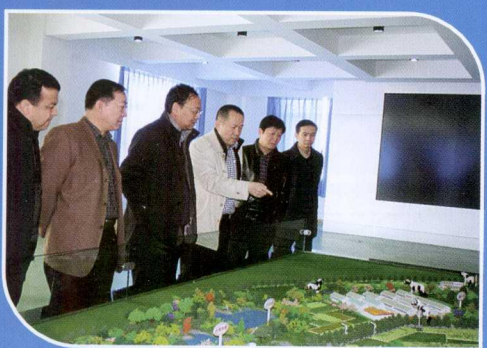
奶业办领导班子观摩检查工作