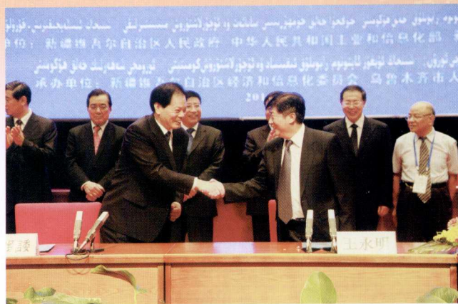
自治区政协副主席、经信委主任王永明与 7 个省市经信委签订产业转移合作协议

2011 年,全区经济和信息化系统贯彻落实中央和自治区的部署,充分发挥新型工业化第一推动力作用,深入推进“十项工程”,全区经济和信息化形势总体向好,实现了“十二五”的良好开局。