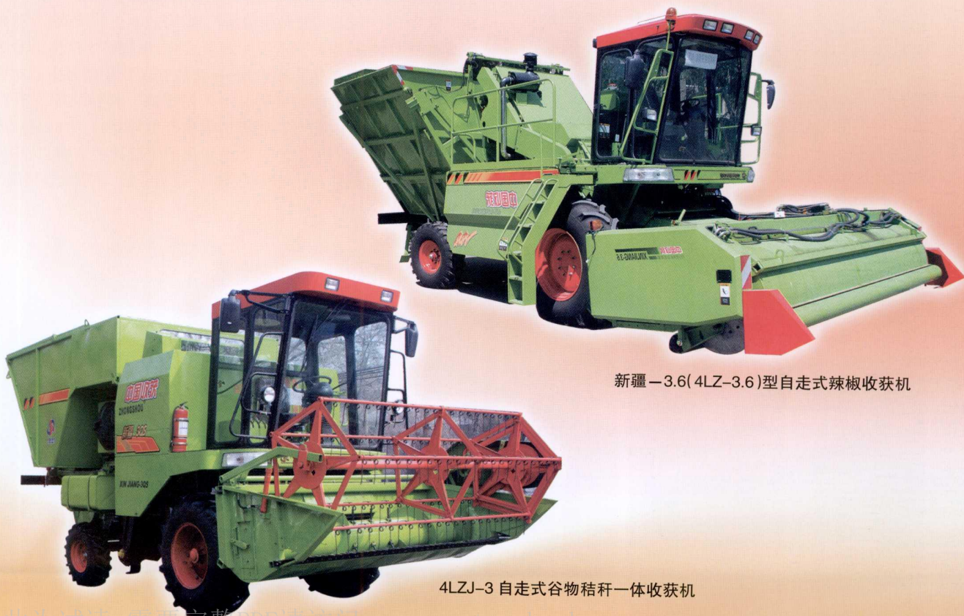
新疆-3.6(4LZ-3.6)型自走式辣椒收获机

为进一步延长核桃产业链,新疆农业科学院农业机械化研究所研制出 6HT-3000 型核桃破壳、壳仁分离加工成套设备,解决了国内核桃加工的技术瓶颈问题,该套设备申报国家专利 19 项,其中授权发明专利 2 项,实用新型专利 9 项。