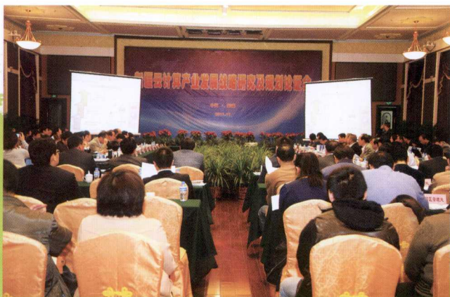
自治区经信委召开“新疆云计算产业发展战略研究及规划论证会”,新疆启动实施“天山云”计划

天然气利民工程取得新成效。提前一年完成全疆 75%城镇实现天然气入户的目标任务。