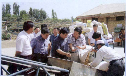
2011年,全区国有粮食购销企业收购小麦300万吨、稻谷40万吨,财政兑付农民粮食直补资金6.84亿元。图为自治区粮食局局长米尔扎依·杜斯买买提(左三)在阿克苏调研夏粮收购工作。