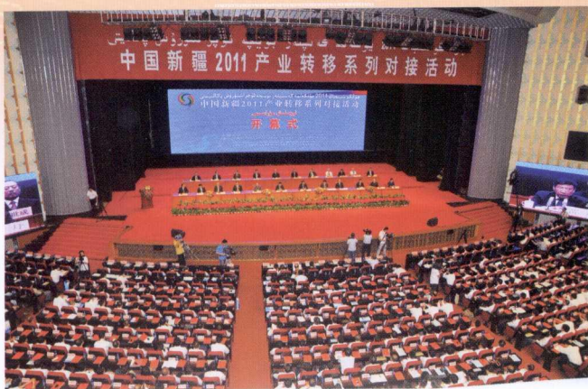
工业和信息化部、自治区人民政府、新疆生产建设兵团主办,自治区经信委承办中国新疆 2011 产业转移系列对接活动