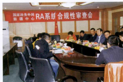
国家电子政务外网新疆 RA 系统认证审查会

自治区信息中心(自治区电子政务外网管理中心)成立于 1988 年,是隶属于自治区发展和改革委员会管理的副厅级事业单位,核定事业编制 85 名,专业技术人员占 75%,其中高级、中级专业技术人才占 50%以上。其主要职责是承担全区经济信息资源开发利用的规划和管理,为自治区党委、人民政府及经济综合管理部门宏观经济决策提供信息服务;承担全区电子政务外网规划、建设、运行、维护及相关管理工作;为党政机关、事业单位提供信息化技术支持与服务。