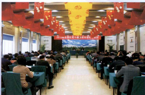
自治区电子政务外网管理培训班

我中心在今后的发展中,将紧紧围绕自治区党委、人民政府和发改委的中心工作,以科学发展观为统领,按照《新疆维吾尔自治区电子政务外网“十二五”发展规划》确定的目标,抢抓机遇,攻坚克难,践行新疆效率,为自治区跨越式发展和长治久安做出新的贡献。