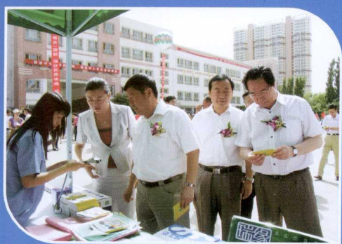
厅领导视察学生饮用奶推广宣传活动