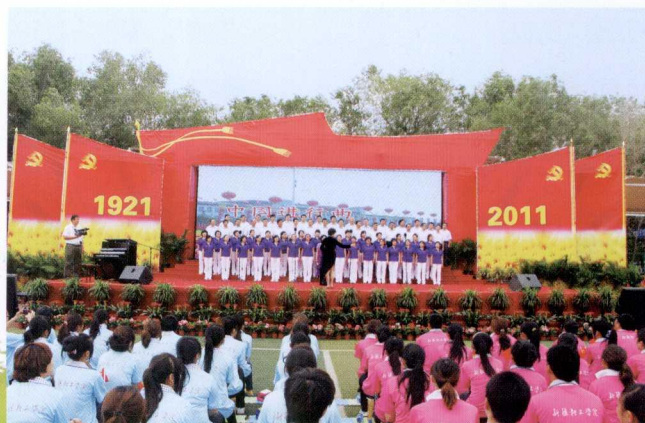
自治区经信委隆重举行“庆祝建党 90 周年老党员重温入党誓词、新党员入党宣誓仪式暨‘唱支新歌给党听’合唱比赛活动”