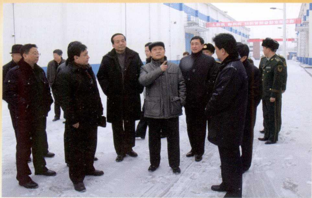
自治区常务副主席黄卫视察新疆乌鲁木齐北站国家粮食储备库