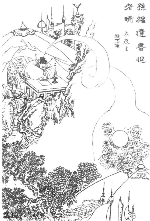
老 孫 權 遣 曹 退 大 茂 主 程 昱 撰

程昱出。操伏几而卧，忽闻潮声汹涌，如万马争奔之状。操急视之，见大江中推出一轮红日，光华射目；仰望天上，又有两轮太阳对照。忽见江心那轮红日，直飞起来，坠于寨前山中，其声如雷。猛然惊