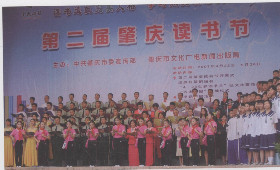
我市举办全民读书节活动