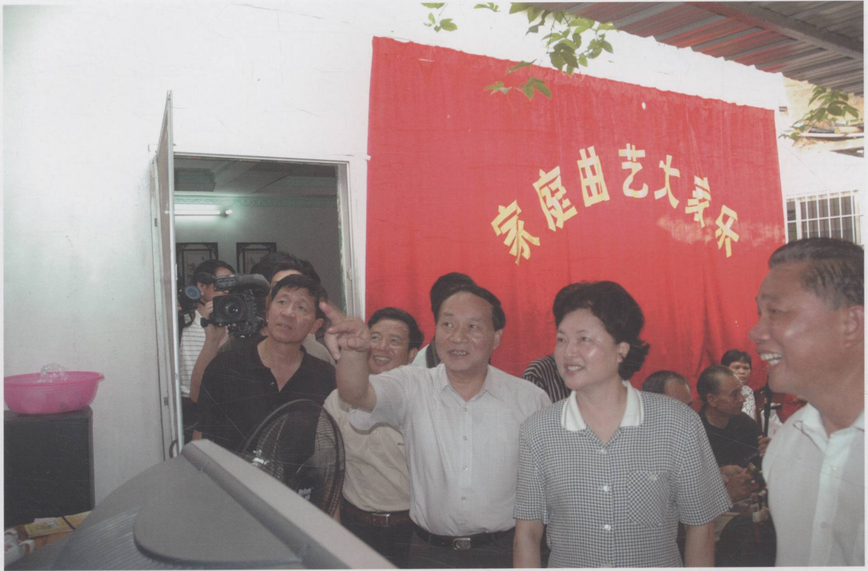
副省长雷于蓝在我市农村文化大户指导工作