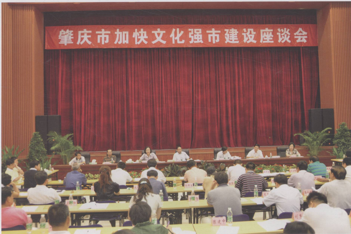
市委书记、市人大常委会主任覃卫东主持召开建设文化强市调研座谈会