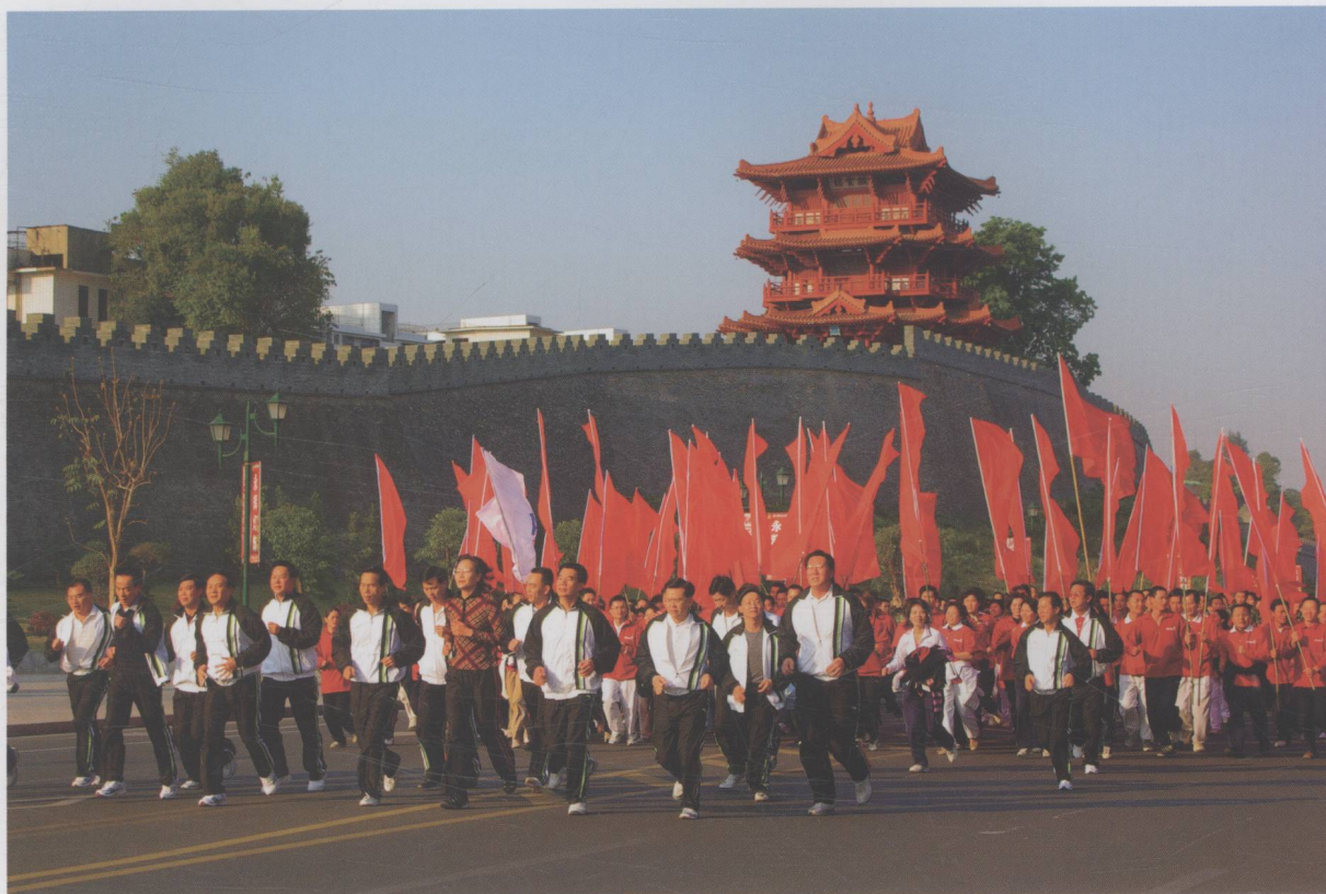
市领导班子带领干部群众迎春跑