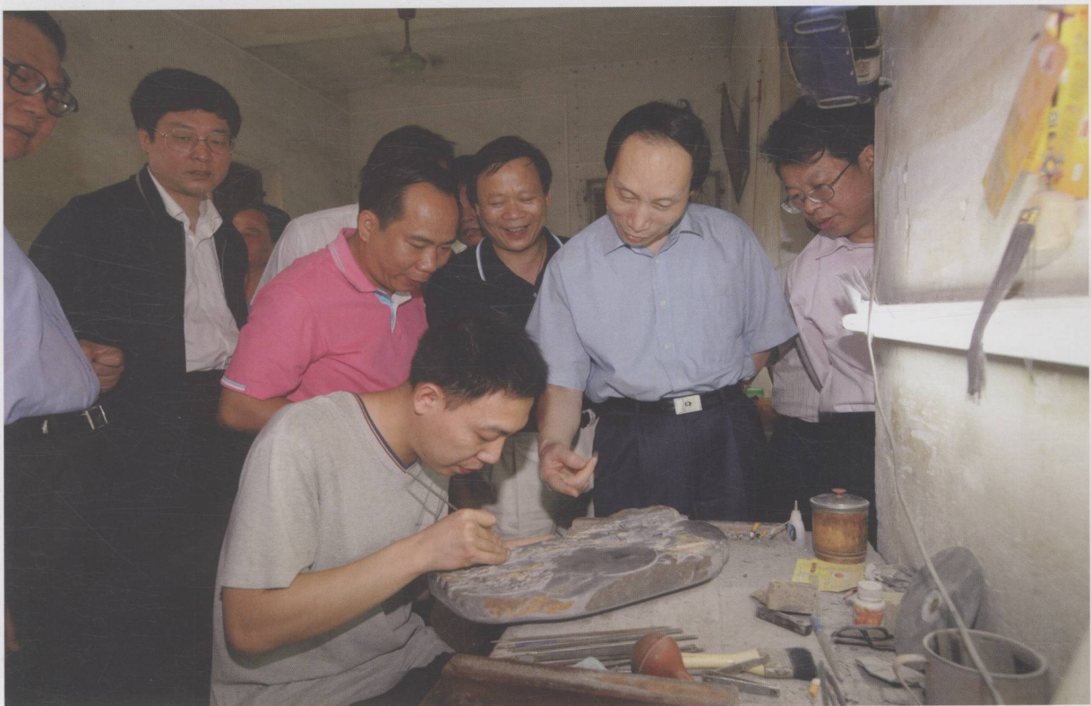
中宣部副部长翟卫华考察肇庆端砚文化村