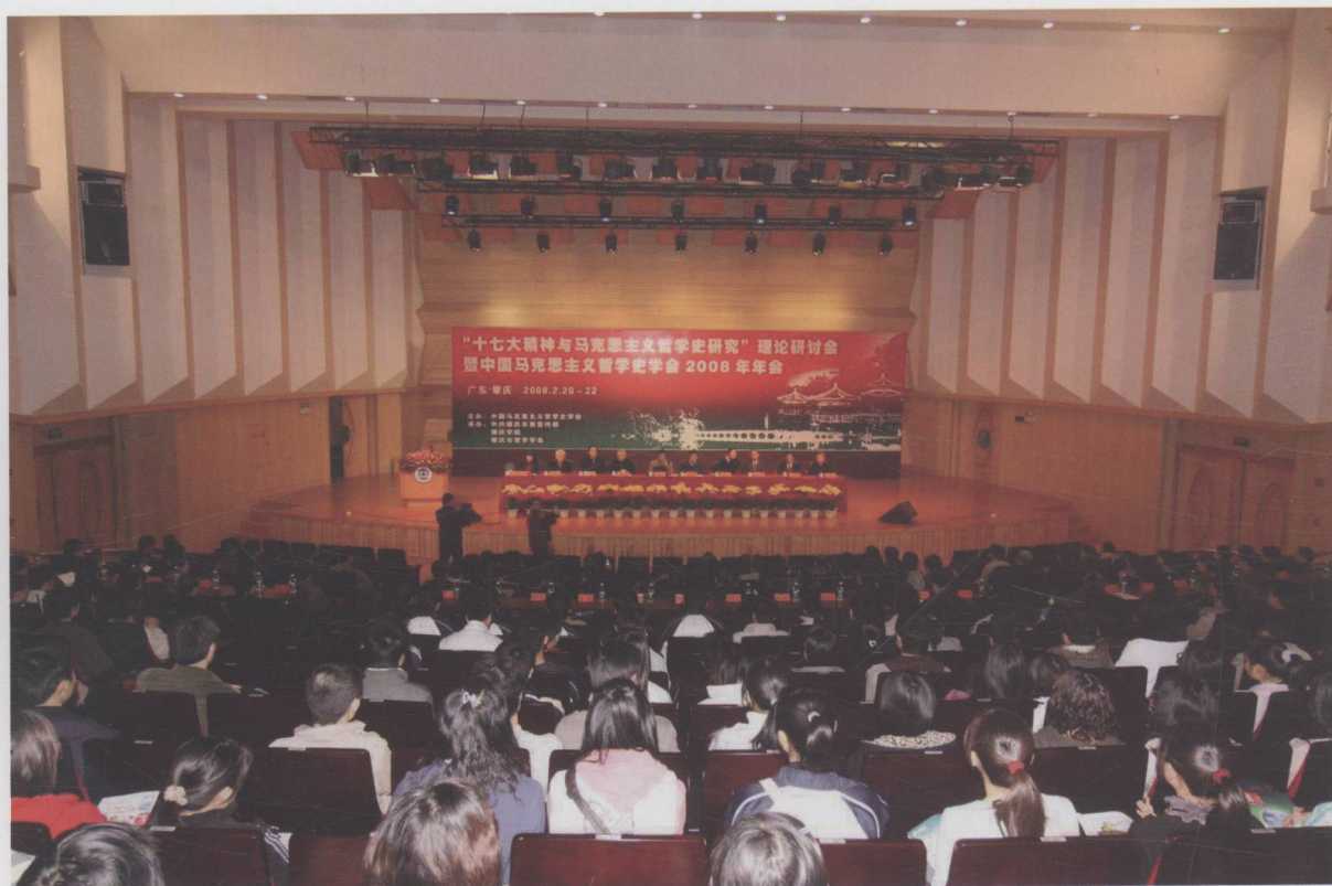
我市召开十七大精神与马克思主义哲学史研究理论研讨会暨中国马克思主义哲学史年会