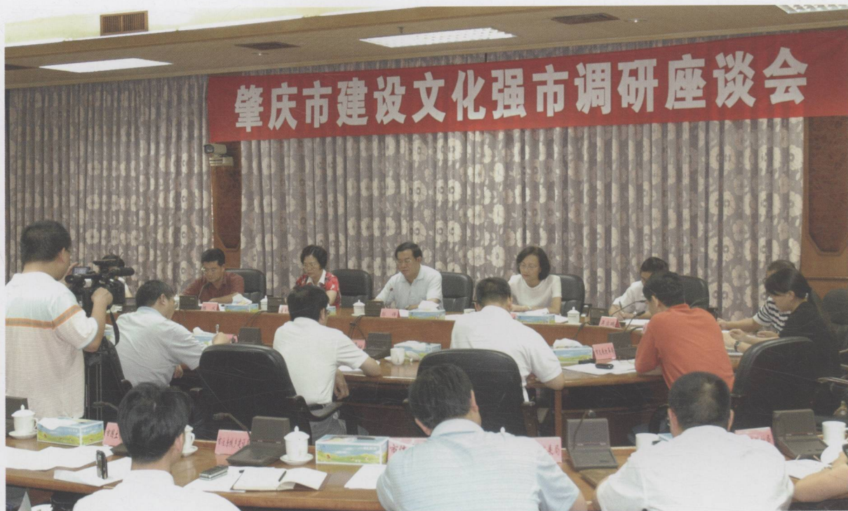
市委副书记、市长郭锋主持召开建设文化强市调研座谈会