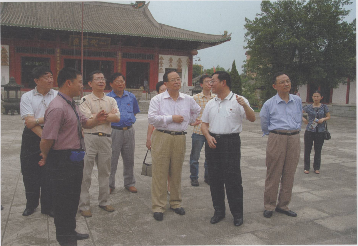
原全国政协副主席周怀西在包公祠等文化景点视察