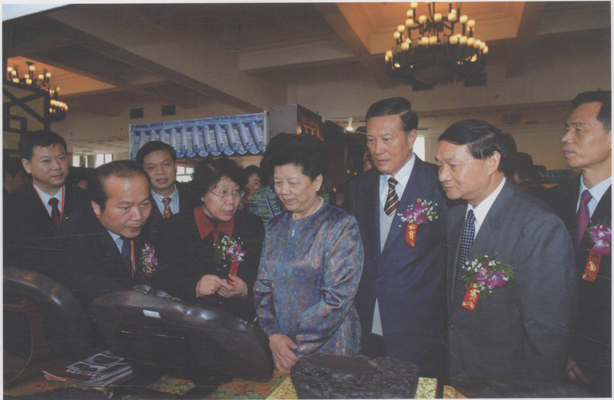
全国人大常委会副委员长、全国妇联主席陈至立在北京全国文房四宝博览会端砚展参观指导