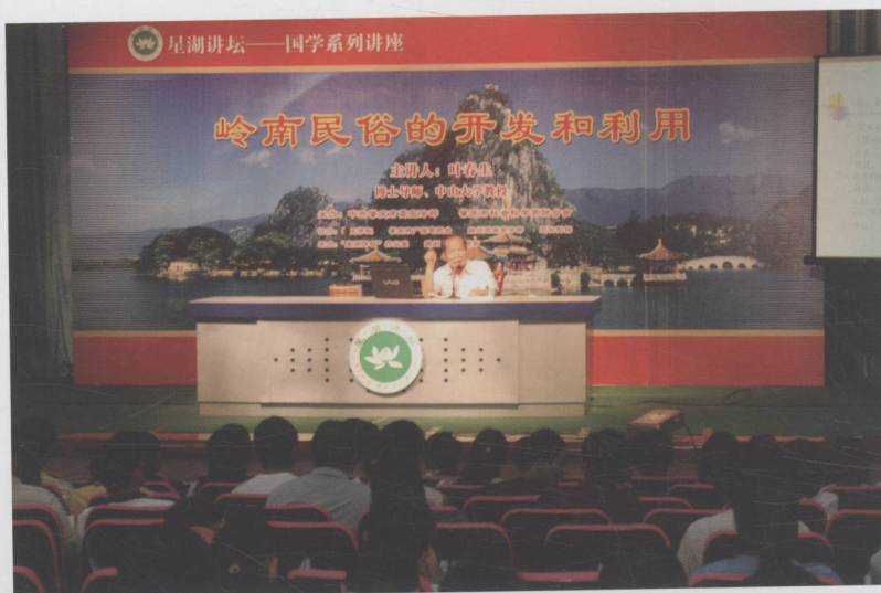
我市举办“星湖论坛——国学系列讲座”活动