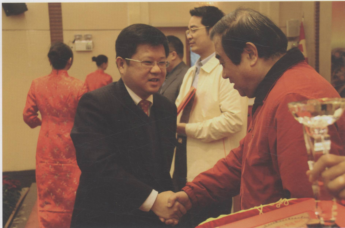
市委副书记、市政法委书记吴华钦出席全市文艺精品表彰大会