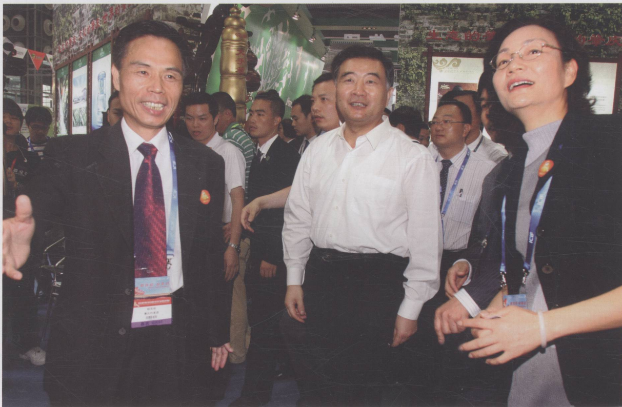
中共中央政治局委员、广东省委书记汪洋参观第五届中国（深圳）国际文化产业博览交易会肇庆馆

点，中宣部副部长翟卫华到我市考察端砚文化建设，中宣部改革办副主任高书生调研我市文化体制改革。省委常委、常务副省长（时任省委常委、宣传部长）朱小丹，省委常委、宣传部长林雄，副省长雷于蓝到我市深入基层指导宣传文化工作。省委宣传部副部长、省文明办主任顾作义，省文化厅厅长方健宏等领导多次到肇庆检查指导宣传文化工作。市委书记、市人大常委会主任覃卫东，市委副书记、市长郭锋深入宣传文化单位开展专题调研，有力地推动了我市宣传文化工作顺利开展。