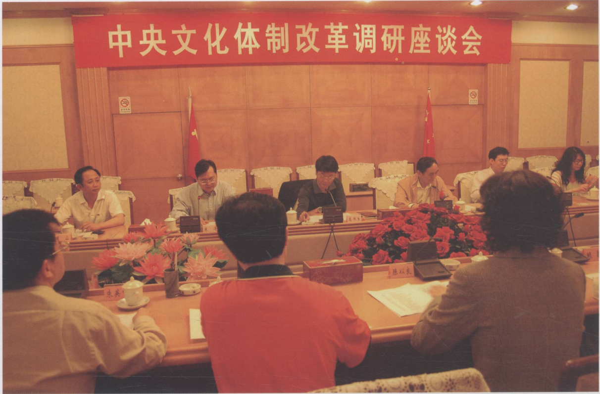
中宣部改革办副主任高书生到我市进行文化体制改革调研