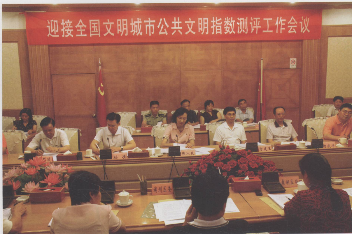
我市召开迎接全国文明城市公共文明指数测评工作会议