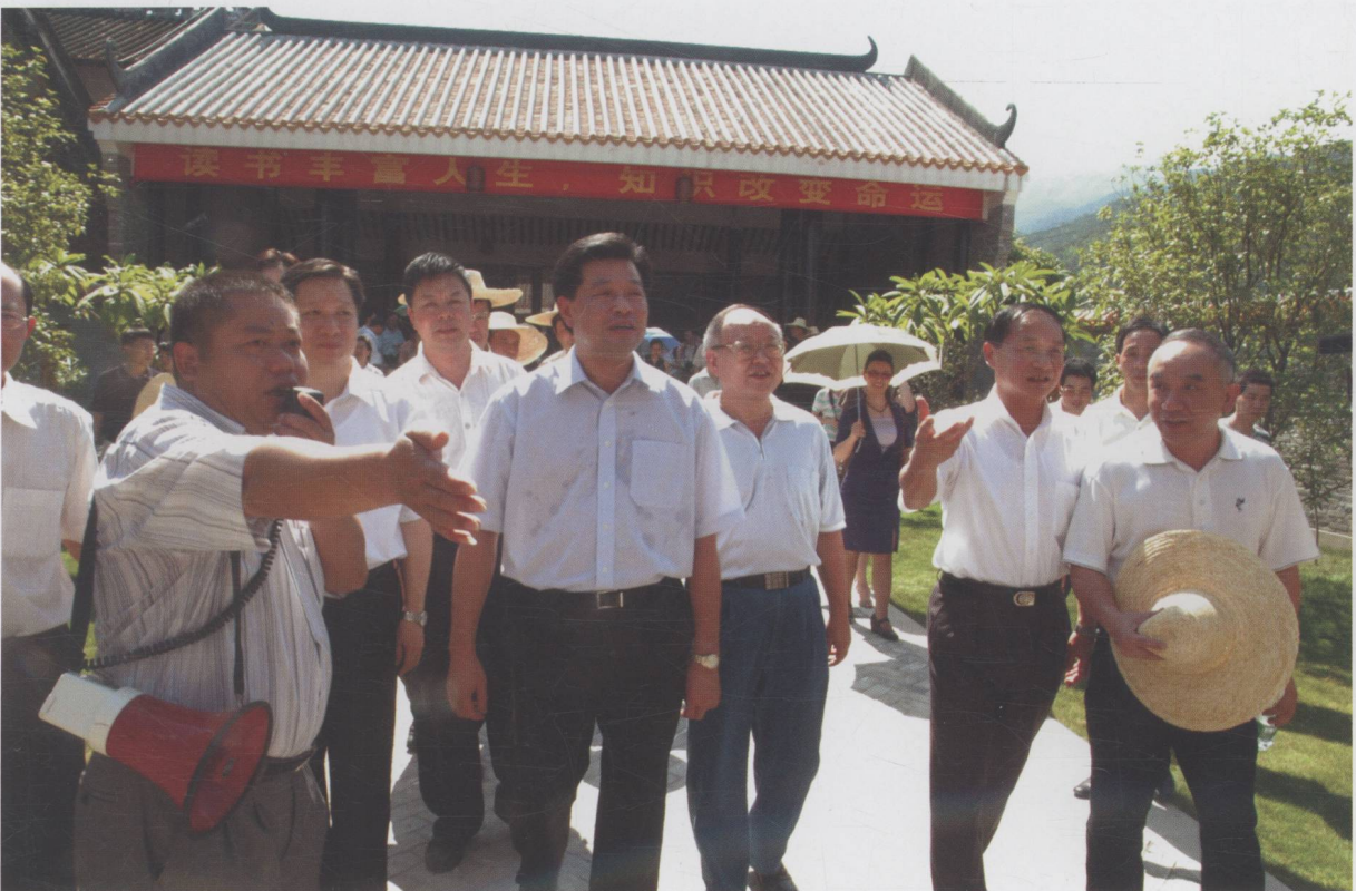
省委常委、宣传部长林雄指导检查我市农家书屋示范点工作