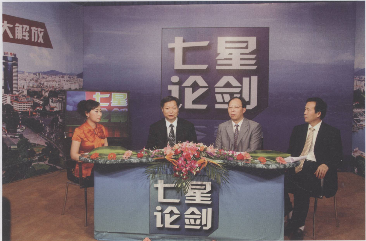
我市开设“七星论剑”电视专栏