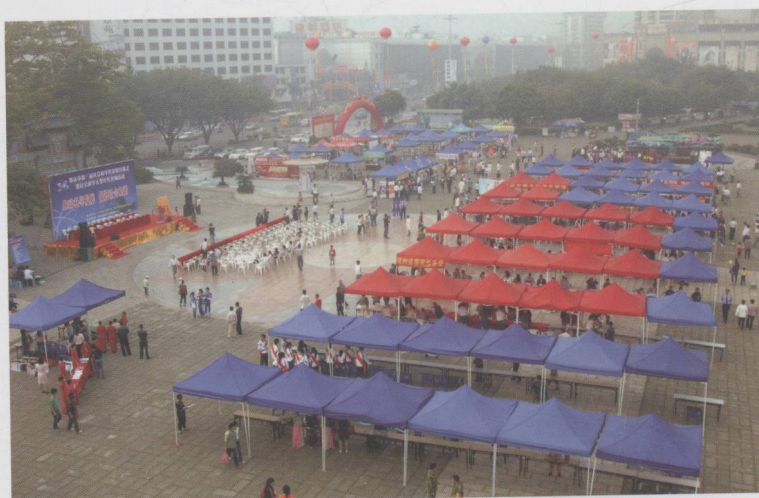
我市举办社科普及周大型活动