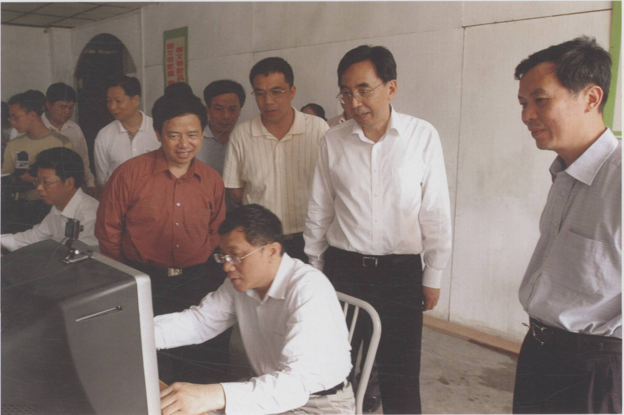
省委常委、常务副省长（时任省委常委、宣传部长）朱小丹深入我市基层指导宣传文化工作