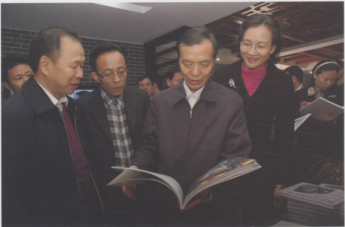
省委宣传部副部长、省文明办主任顾作义深入我市基层指导宣传文化工作