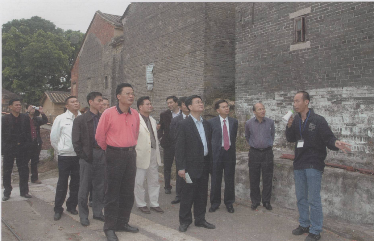
省文化厅厅长方健宏到我市指导基层文化建设工作