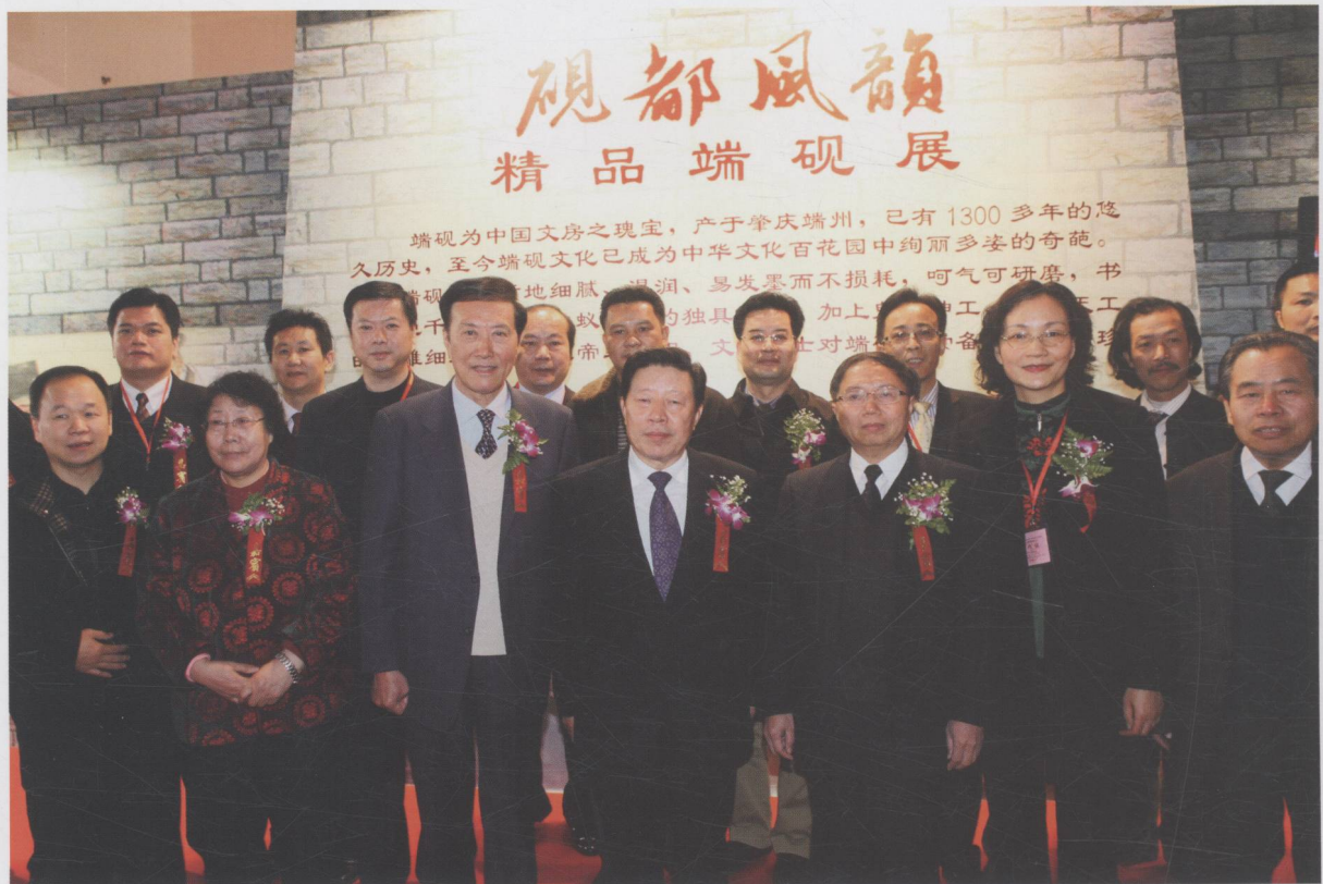
全国政协副主席孙家正等领导在北京全国文房四宝博览会“砚都风韵”端砚展参观指导