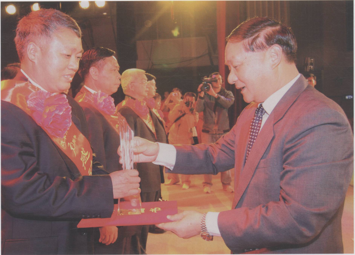
市委书记、市人大常委会主任覃卫东为改革开放30周年感动肇庆人物颁奖