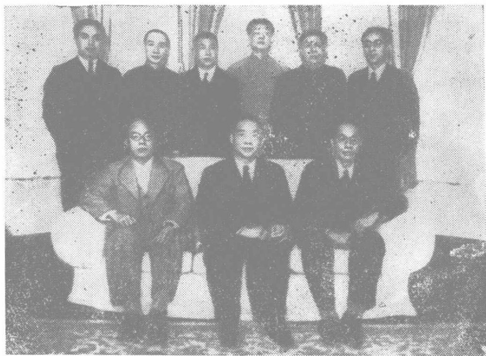
汪精卫与影佐祯昭等人合影