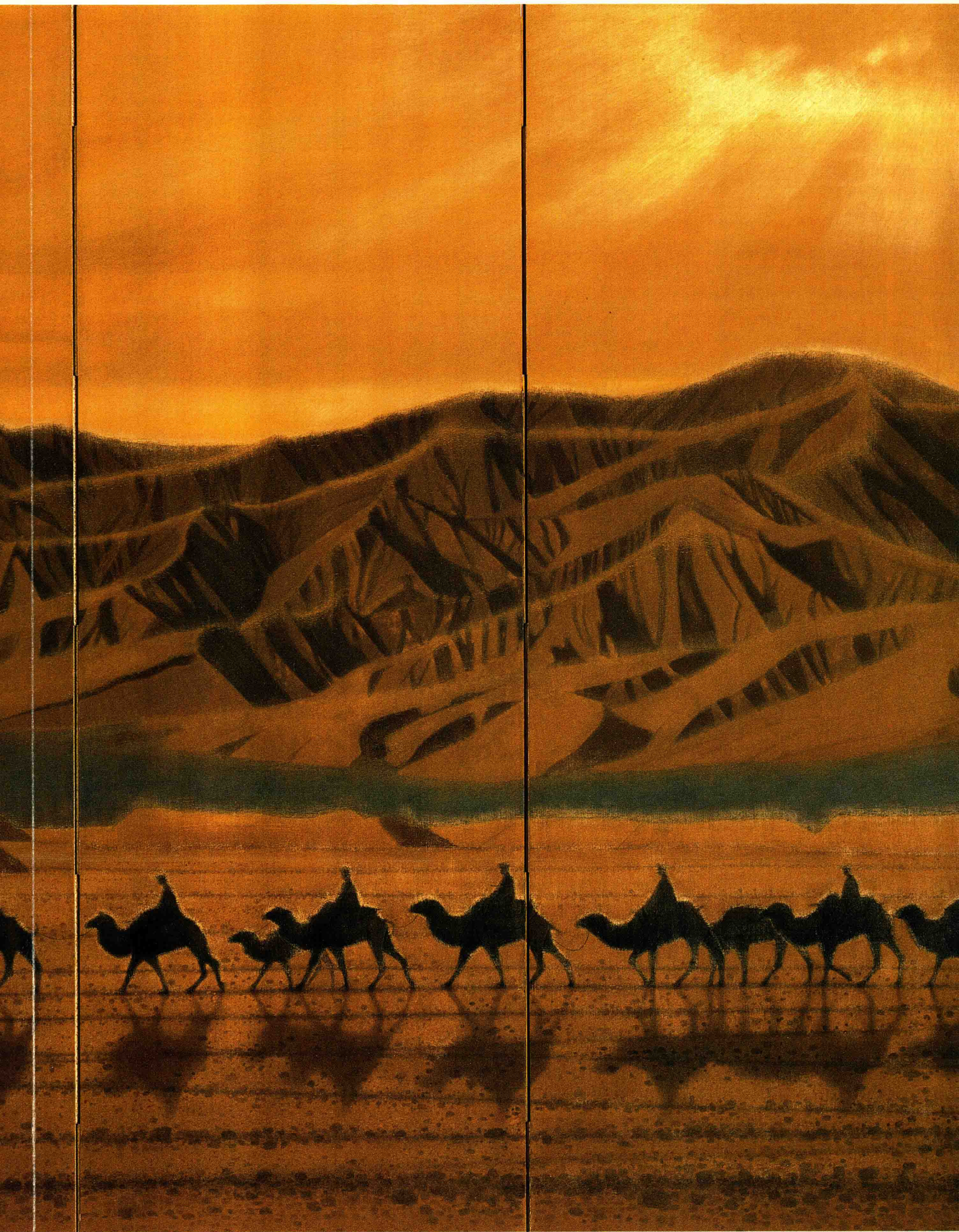
1 丝绸之路天空 Sky over the Silk Road 171.0×363.5cm (六折屏风) 昭和 57年(1982)