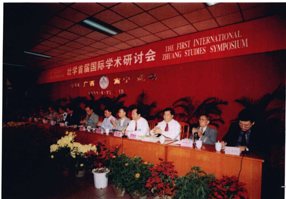
↑ 壮学首届国际学术研讨会主席台，原广西壮族自治区主席李兆焯出席开幕式。