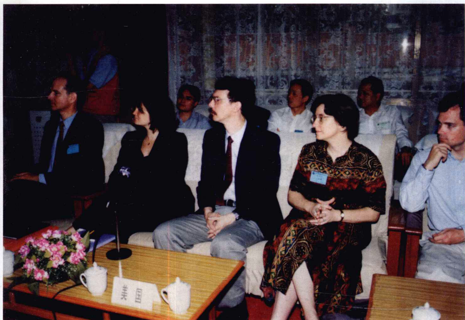
↑ 出席研讨会的外国学者在小组讨论会上。