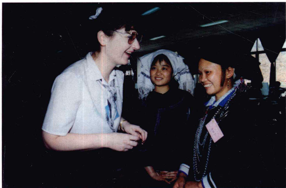
↓ 出席研讨会的捷克学者与壮族女代表亲切交谈。