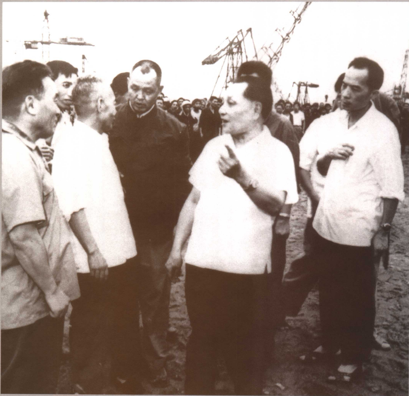
1980年7月，邓小平副主席视察长江葛洲坝工地