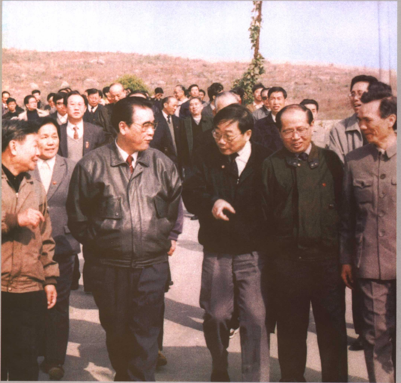
1992年11月，李鹏总理由长江水利委员会主任魏廷琿等陪同视察三峡宜昌前坪基地