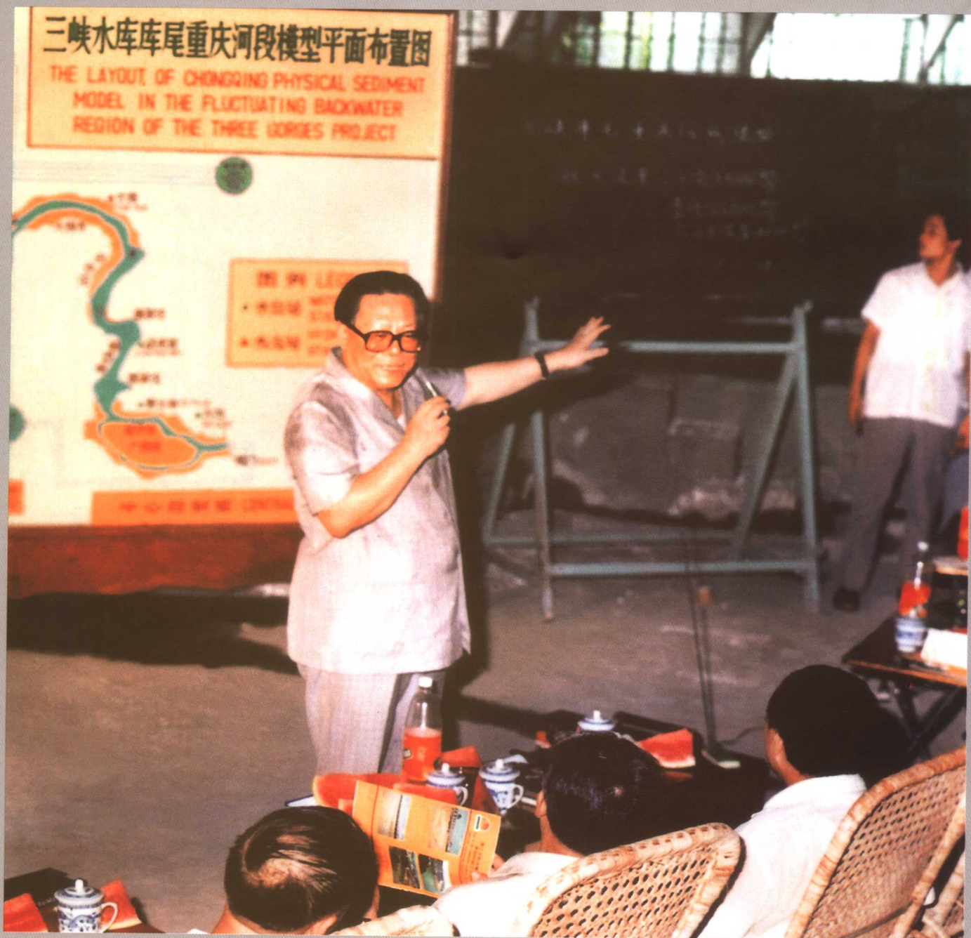
1989年7月24日，中共中央总书记江泽民在湖北武汉视察长江科学院