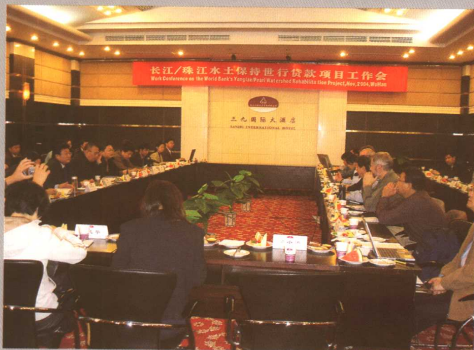
5 《长江志·大事记》终审会 刘小康摄