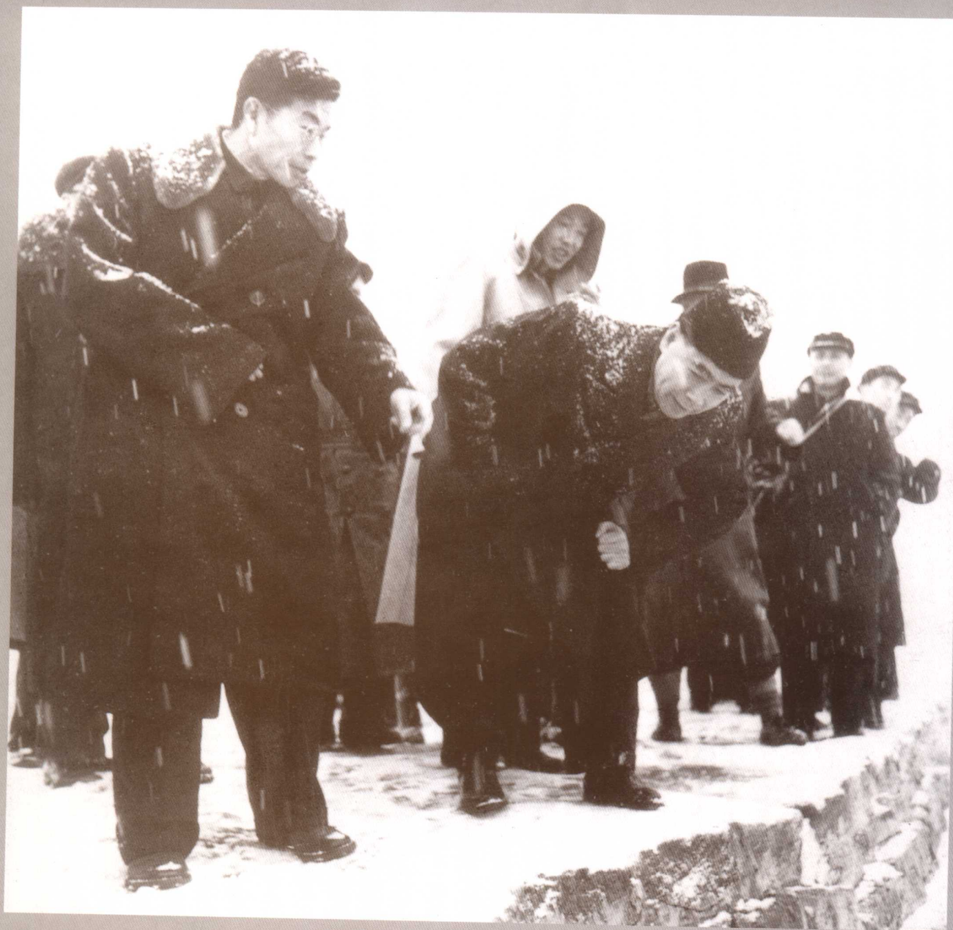
1958年2月，周恩来总理冒雪勘察荆江大堤