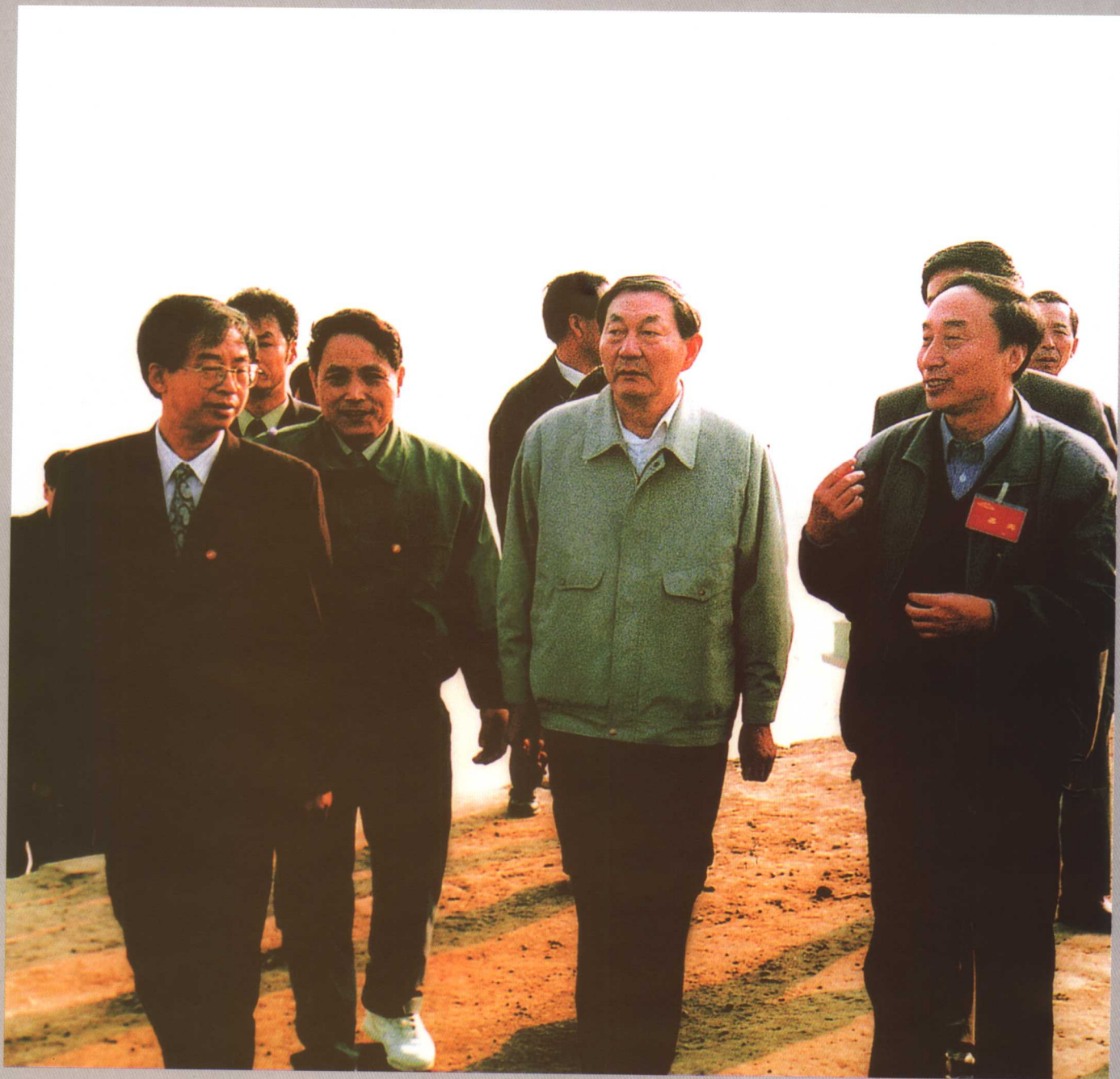
1996年朱镕基副总理由长江水利委员会主任黎安田、长江三峡工程开发总公司总经理陆佑盾陪同视察三峡工地