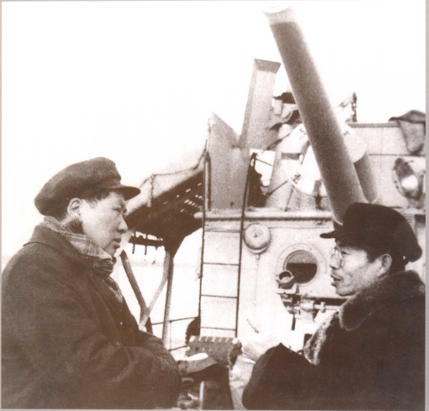
1953年2月，在“长江”航上，毛泽东主席约见长江水利委员会主任林一山，专门听取关于治理长江问题的汇报 长江委长江博物馆供稿