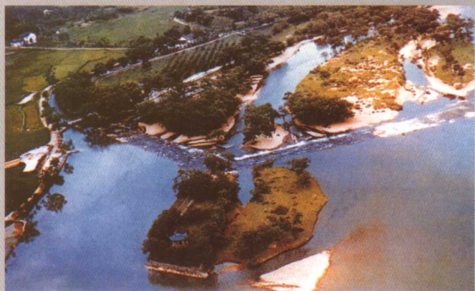
1 京杭大运河（苏洲段）