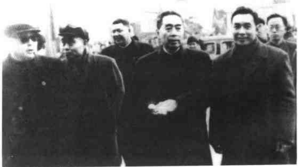
1962年2月周恩来总理(前右二)、陈毅副总理(左一)视察南京无线电工业学校。