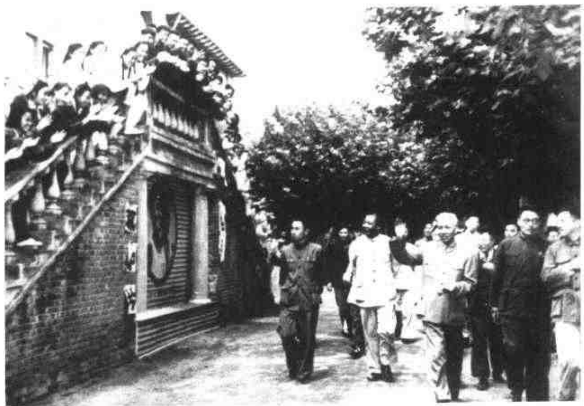
1958年9月27日,全国人大常委会委员长刘少奇(前右三)视察南京工学院。