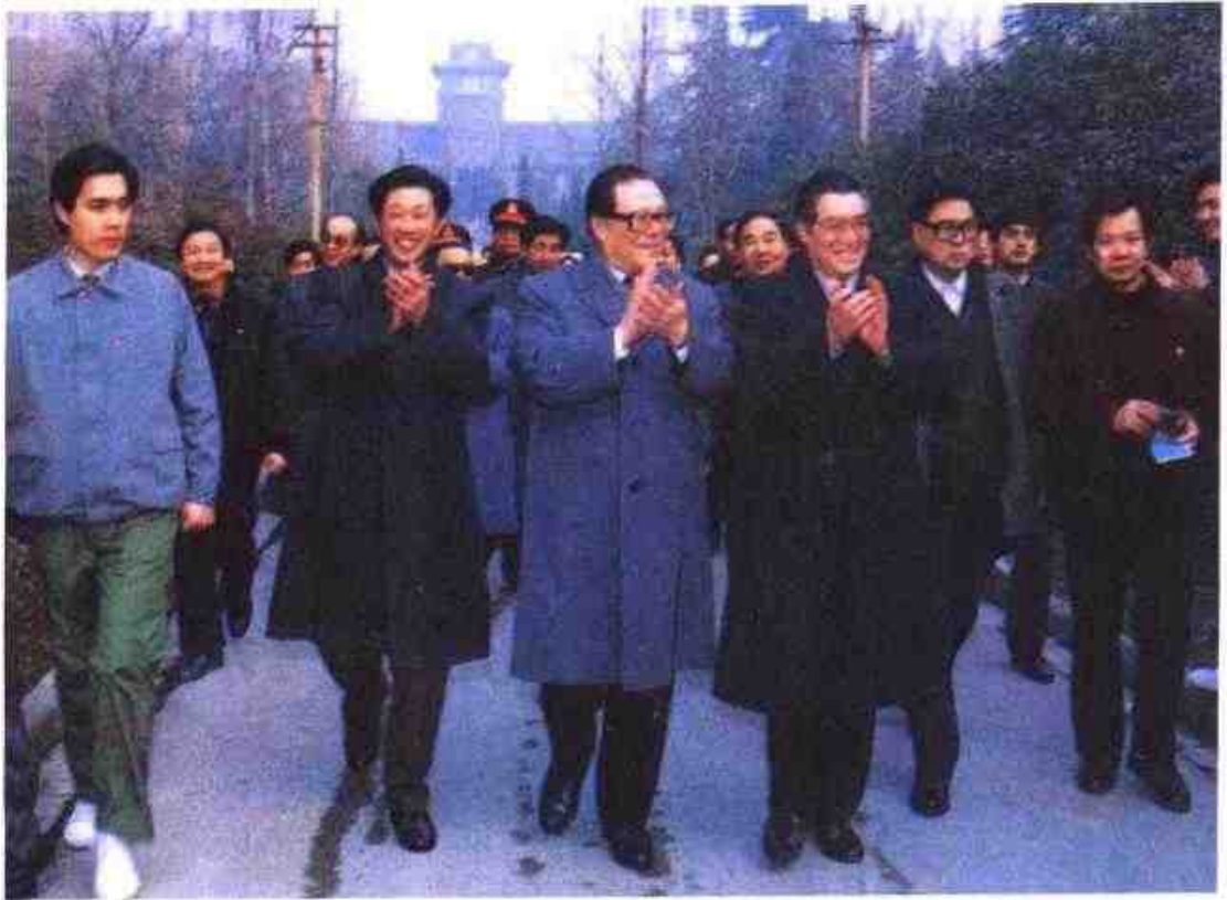
1992年1月24日,中共中央总书记江泽民(前左三)视察南京大学

同日,江泽民总书记在南京大学接见十五位中国科学院学部委员时与南大名誉校长匡亚明教授亲切交谈