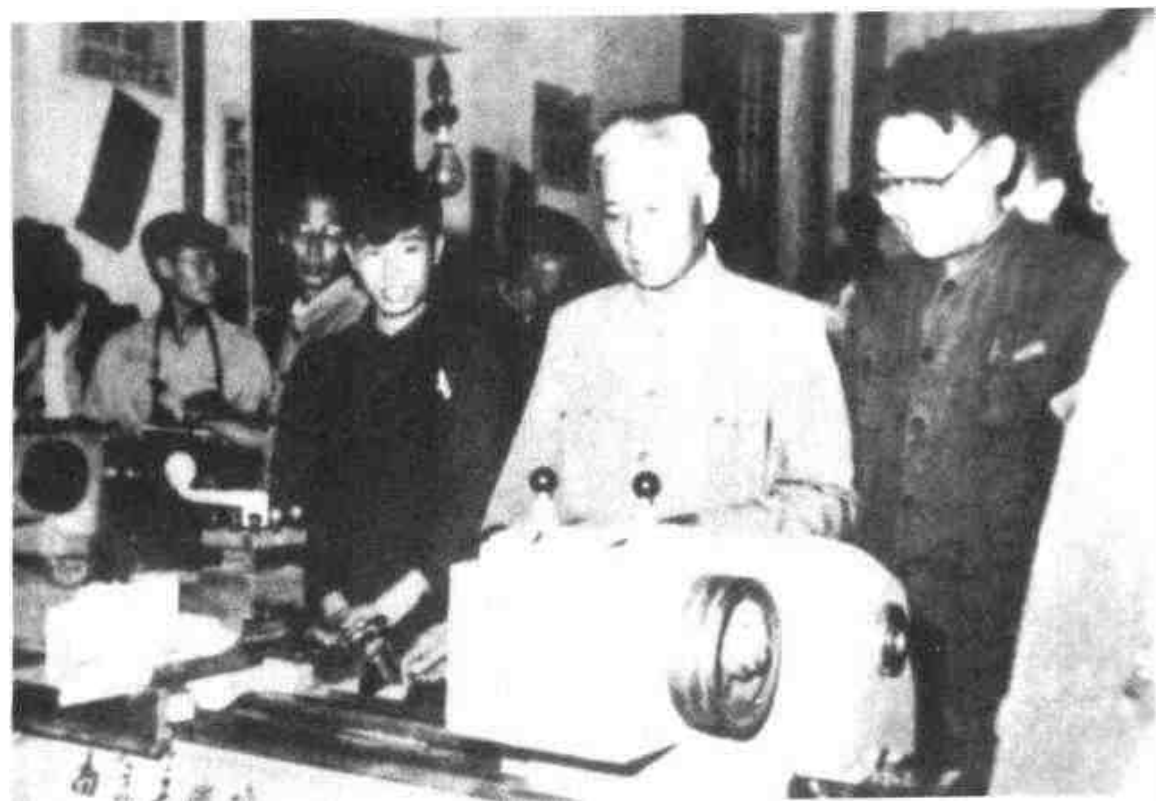
同日,刘少奇委员长视察南京工院校办工厂。