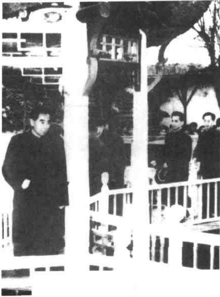
1960年12月周恩来总理(左一)视察南京市五老村幼儿园。